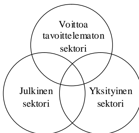
Kuvio 2 Osittain päällekkäiset sektorit (Vernis ym. 2006, 20)

Suomen yliopistot ovat voittoa tavoittelemattomia organisaatioita kuten kansalais-järjestötkin. Yliopistokoulutus on lain nojalla ilmaista ja kaikki yliopistot lukuun otta-matta Turun Åbo Akademia ovat julkisia organisaatioita. Kaikki yliopistot ovat kuiten-kin pääosin valtion tai kunnan rahoittamia, mikä on yksi syy siihen, että niiden katso-taan kuuluvaksi julkiseen sektoriin. (Seppänen 1999, 125.) Sektoreiden rajat ovat kui-tenkin osittain päällekkäisiä, joten sektoreiden välille ei ole järkevää vetää tiukkoja rajoja (kuvio 2). Julkiset organisaatiot voivat joissain tapauksissa toimia yritysten lailla ja kerätä tuottoa esimerkiksi palveluilla, tai vastaavasti voittoa tavoittelematon organi-saatio voi saada rahoitusta valtiolta.