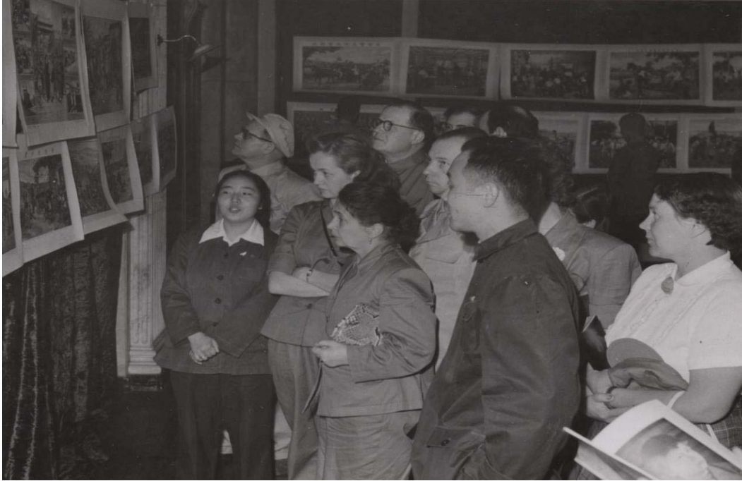
Kuva 4; Valtuuskuntalaiset tutustumassa uudenvuodenkuviin.