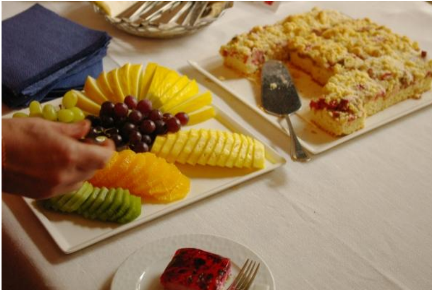
Kuva 5. Hedelmällinen työskentely tulevaisuusverstaissa syntyy sekä henkisestä että aineelli- sesta ravinnosta.

Verstaalla on yksi tai useampia vetäjiä, jotka huolehtivat työn sujumisesta tavoitteiden mukaisesti ja kaikkien tasaveroisesta osallistumisesta. Riittävä aika on välttämätöntä, jotta ideointi pääsee vauhtiin ihmisten välisessä vuorovaikutuksessa. Verstaat voivatkin kestää esimerkiksi päivän tai kokonaisen viikonlopun tai ne voivat muodostaa usean erillisen päivän työskentelyn sarjan. Verstaissa on myös huolehdittava viihtyisyydestä ja esimerkiksi siitä, ettei nälkä pääse häiritsemään työn edistymistä.