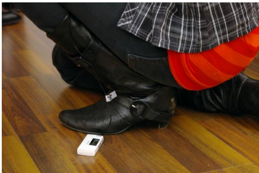
Kuva 1. Näkökulma nuorten taide- ja kulttuuritoiminnan nyky- tilanteeseen ensimmäisessä tulevaisuusverstaassa.

Aikuiset ovat asettuneet joka taholla yhteiskunnassa alttiiksi nuorten tunteille ja ajatuksille. He ovat uskaltaneet kohdata ne rajussa ja herkässä muodossa. Aikuiset ovat luottaneet nuoriin ja asettuneet avoimen kuuntelemaan ja tasavertaiseen vuoropuheluun heidän kanssaan. He ovat olleet läsnä ja välittäneet, missä tehtävissä yhteiskunnassa ovat toimineetkin. Tämä on tarvittu, jotta taiteen tekeminen on voinut tukea nuorten kasvua.