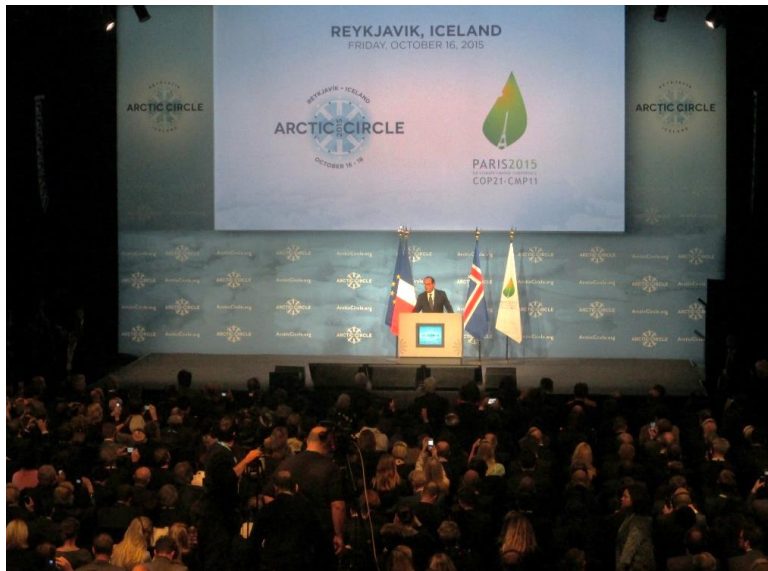
Kuva 4. Ranskan presidentti François Hollande puhumassa Arctic Circle Assemblyn avajaisissa 2015.