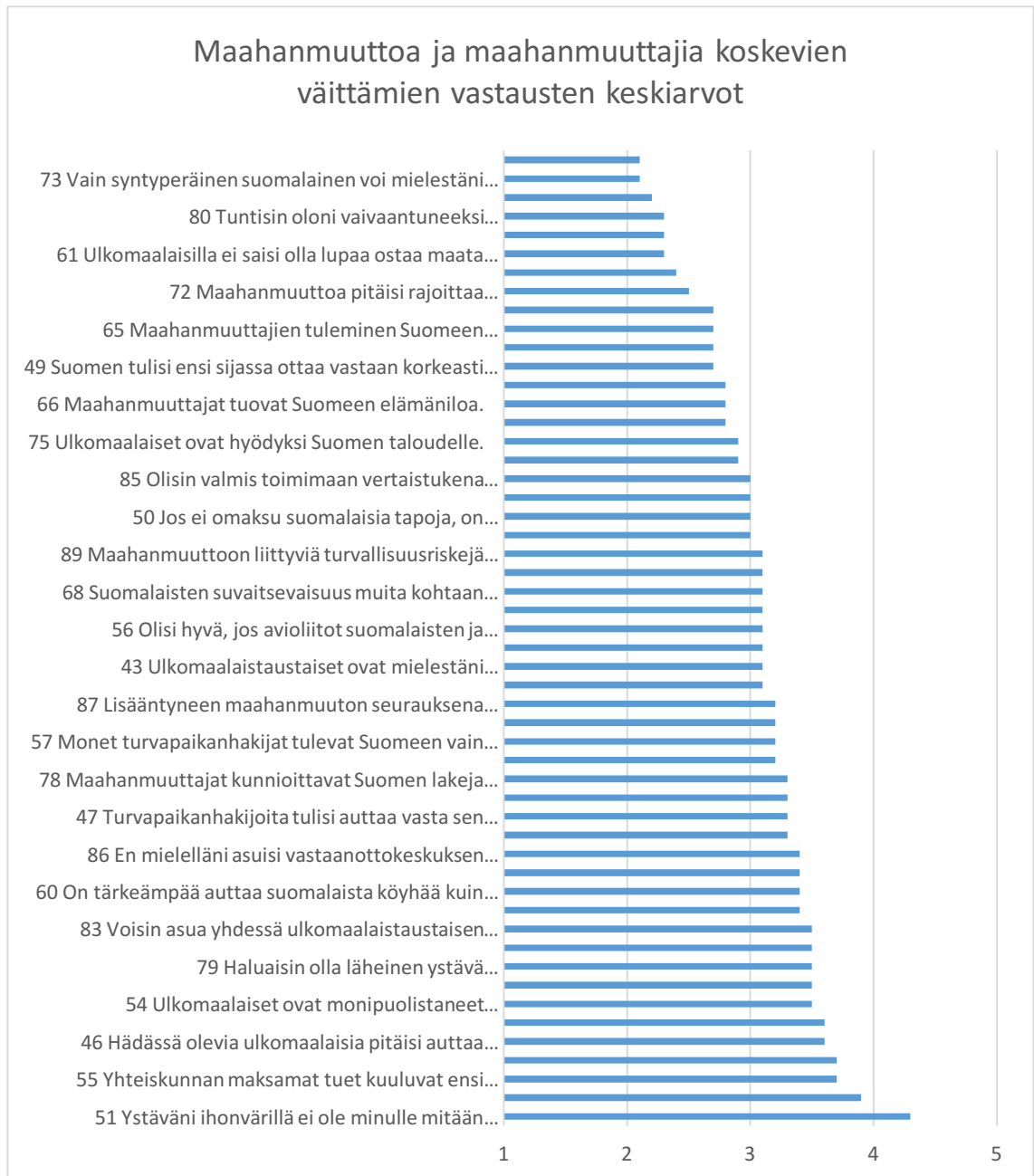
Kuvio 1. Kaikkien maahanmuuttoväittämiä vastausten keskiarvot (1= Täysin eri mieltä, 3= Ei samaa eikä eri mieltä 5= Täysin samaa mieltä)