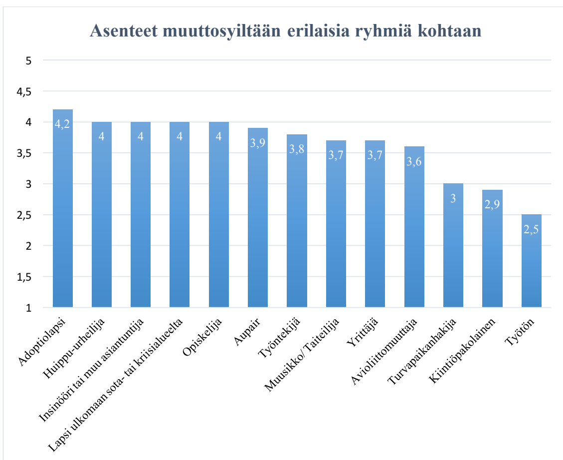
Kuvio 6. Asenteet muuttosyiltään erilaisia ryhmiä kohtaan

Nuorten maahanmuuttoasenteissa oli eroja eri maahanmuuttoryhmien suhteen (Kuvio 6.). Kuten aikaisemmissakin tutkimuksissa, tähän tutkimukseen osallistuneet nuoret suhtautuivat kaikkein kielteisimmin työttömiin muuttajiin, kiintiöpakolaisiin sekä turvapaikanhakijoihin.