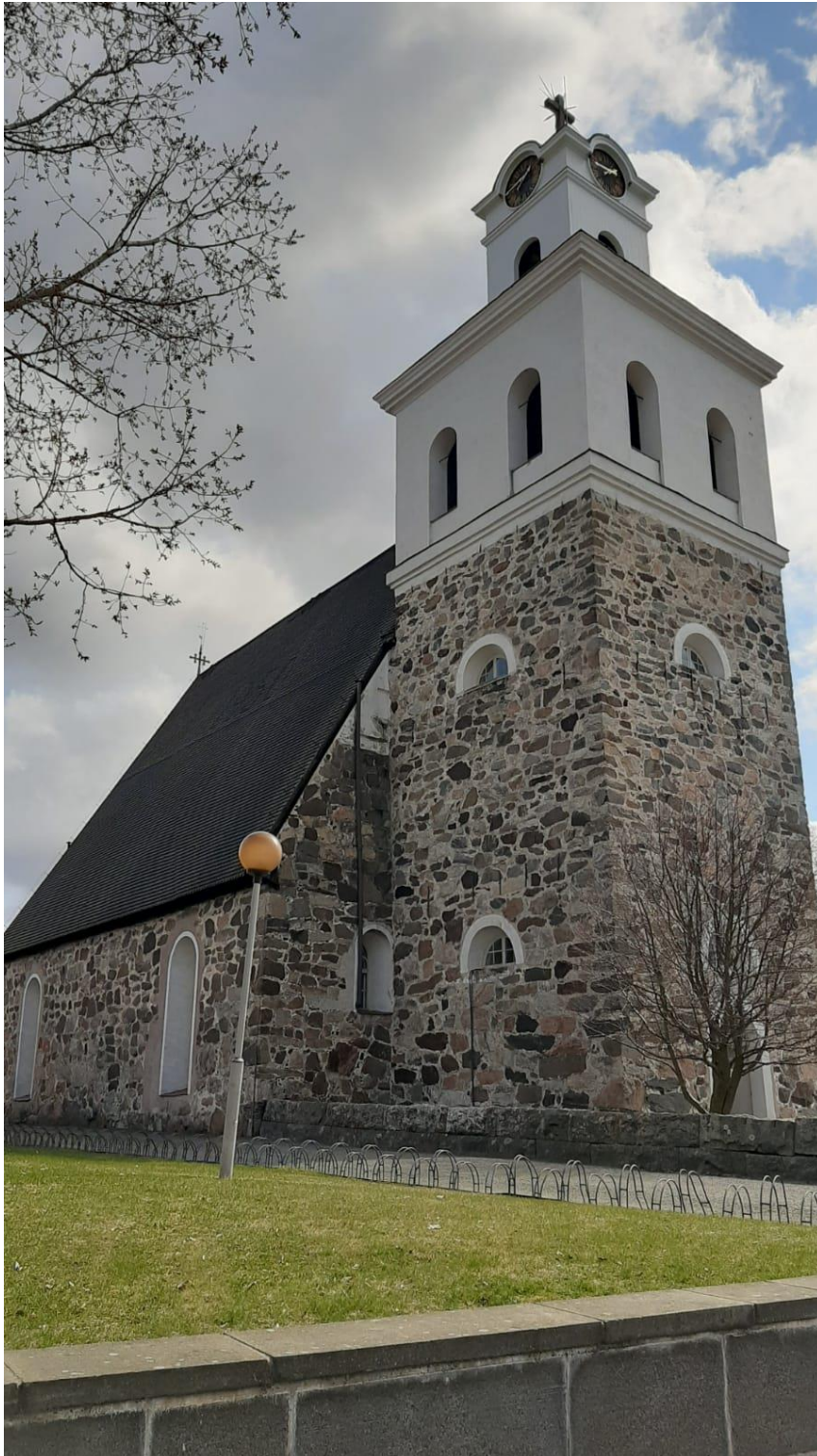
Pyhän Ristin kirkko ulkoa. (Malmstén, 2020.)