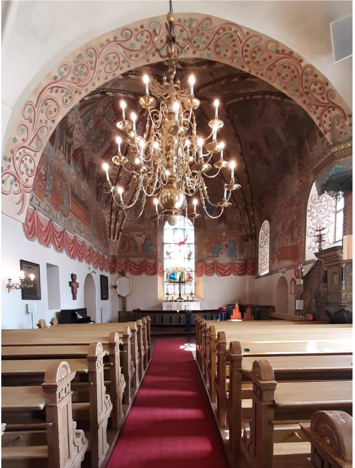
Pyhän Ristin kirkko sisältä. (Malmstén, 2020.)