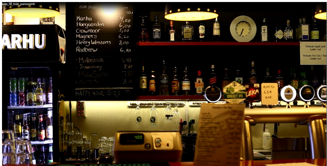
Kuva 9. Ravintola Three Beersin baaritiski helmikuussa 2018. (Kuvakaappaus Tarinoita Trebarista -dokumentin täytekuvamateriaalista. Kuvaaja: Ikaros Ainasoja 2018.)

Ensimmäisenä tiskillä vastaan tulivat jääkaapit, joista löytyi usean hyllyn verran erikoisoluita ja siidereitä, sekä muutama pullo jäädytystä vaativia tiukempia viinoja. Myös alkoholittomille tuotteille oli oma hyllynsä. Kahdeksan eri hanaa tarjosivat asiakkaille seitsemää eri tuotetta. Kaksi hanoista oli varattu hanalagerille ja yksi