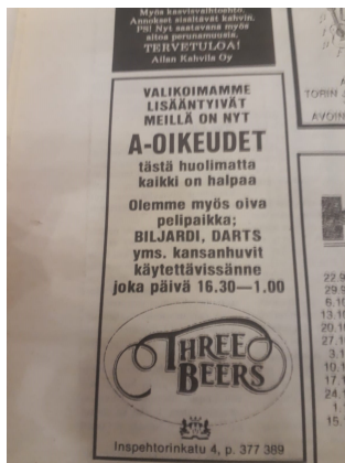
Kuva 2: Ravintola Three Beersin mainos 1990-luvun alussa Turun ylioppilaslehdessä. (Kuvaaja: Niklas Pietilä 2020).

Lama söi asiakasmääriä ja vielä 1993 ei lamalla näyttänyt olevan loppua. 127 Lamavuodet olivat koko Suomen ravintola-alalle, jolla ei aiemmin juuri konkurssreja tunnettu, hyvin tuhoisat, ja ala nousi vauhdilla konkurssitilastojen kärkisijoille. 128 Erikoisena piirteenä laman keskellä Suomeen syntyi olutkuppiloita kuin sieniä sateella. Vuonna 1992 Turun alueella oltiin avattu joka viikko uusi pubi ja kaupungissa niitä oli yli 190. 129 Tämä osittain selittyi sillä, että vielä 1980-luvun alussa kiven alla olleet anniskelu-oikeudet koettiin varmana toimeentulona yrittäjille ja tuovan etuja kuten aiemmin. Vuodesta 1987 Alko oli alkanut myöntää anniskelu-oikeuksia vapaasti ja kilpailu oli lisääntynyt. Lisäksi monet työttömäksi jääneet ravintolatyöntekijät pyrkivät työllistämään itsensä perustamalla yrityksen. 130 Lama näkyi Three Beersin kohdalla opiskelijoiden kulutusmahdollisuuksissa. Turussa elää edelleen urbaanilegenda, jonka mukaan 1990-luvun laman aikana opiskelijat metsästäivät Ylioppilaskylässä fasaaneja ravinnokseen. 1990-luvun alussa saatuaan A-oikeudet 131 , Three Beers vetosi mainoksissaan Turun ylioppilaslehden lukijoihin halpuudellaan ja erilaisilla pelaamismahdollisuuksilla. 132 Three Beersin alkuvuodet sijoittuivat siis yrittäjille riskialttiiseen kauteen Turun historiassa.