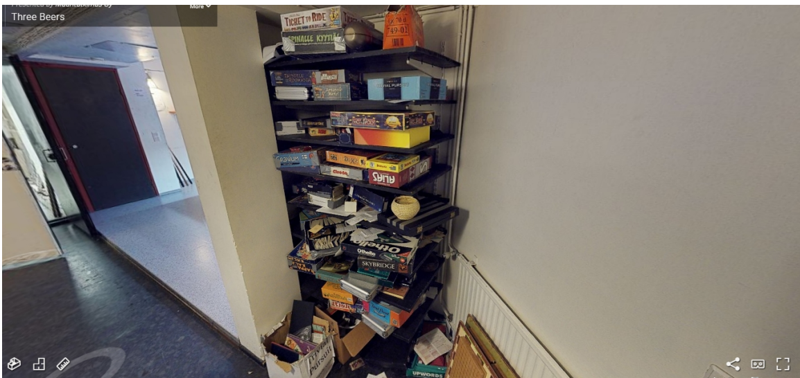
Kuva 10. Ravintola Three Beersin lautapelihylly kauheimmillaan.

Toisaalta lautapelikulttuuriin perehtynyt silmä kiinnitti ravintolan pelihyllyssä huomiota siihen, että pelihyllyyn oli panostettu harrastajatasolla. Hyllyiltä löytyivät perinteisten baaripelien lisäksi myös Dixitin , Menolipun , Bohnanzan , Dale of Merchantsin ja Agricolan kaltaisia 2000-luvun ensimmäisen vuosikymmen puolivälin tienoilla alkaneen lautapelien uuden tulemisen aikaisia uusia klassikkoasemaa lähestyviä sekä harrastajille suunnattuja pelejä.