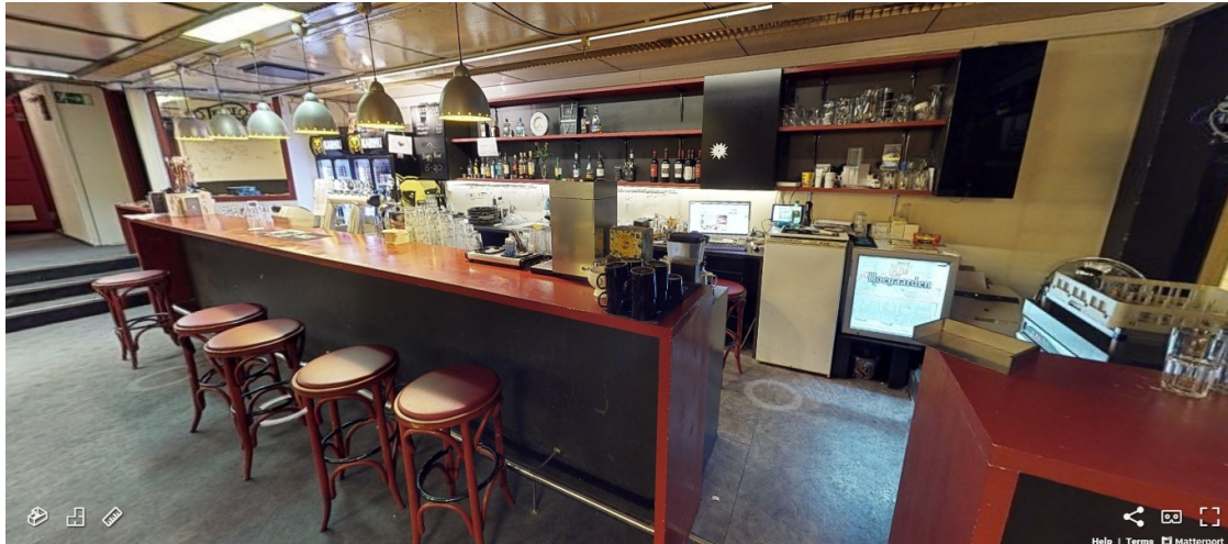
Kuva 8. Ravintola Three Beersin baaritiski. (Kuvakaappaus Muuritutkimus ky:n 3d-mallista. Kameraoperaattorit: Arttu Liimatainen ja Akseli Tolvi 2018.)

Beersissä harjoitusten jälkeisillä. 163 Liitutaulu tiskin takaa ilmoitti tuotteiden hinnat ja opiskelijoiden happy hourin jatkuvan kolmesta kahdeksaan illalla. Taulun viereistä, useiden eri viinujen asuttamaa viinahyllyä tarjoukset eivät koskeneet. Tarjoukset koskivat ainoastaan hanatuotteita ja ne oli suunnattu opiskelijoille.