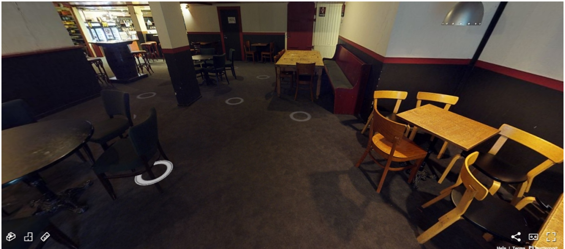
Kuva 5. Ravintola Three Beersin yläsali. (Kuvakaappaus Muuritutkimus ky:n 3d-mallista. Kameraoperaattorit: Arttu Liimatainen ja Akseli Tolvi 2018.)

arkkitehtisuunnitelman mukaan molemmat oltiin rakennettu. Heti ovesta sisälle astuessa oli kaksi pienempää pöytää. Eräs parivaljakko oli nimennyt toisen pöydistä resonointipöydäksi, jossa tuoksui kloori. Tuoksu kantautui vanhasta Holiday Club Caribbean ja Three Beersin yhdistävästä maanalaisesta käytävästä, jonka sisäänkäynti taannoin peitettiin seinälevyllä pöytää vierustavan seinän taakse. Seinälevyn takana tönötti tunneliin johtava avattava ovi, joka Three Beersia kohti kulkiessa johti päin seinää. Pöydän lempinimi tuli siitä, että pöydässä keskusteltaessa ääni alkoi resonoida. 149