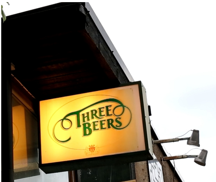
Kuva 3: Ravintola Three Beersin valokyltti. (Kuvakaappaus Tarinoita Trebarista -dokumentin tätekuvamateriaalista. Kuvaaja: Ikaros Ainasoja 2018.)

Sosiologit ovat todenneet, että alkoholitutkijoiden käyttämä termi ravintola-annos on osuva. Ravintolassa ei osteta ainoastaan lasillista juomaa, vaan annos ravintolaa – sen ilmapiiriä, ihmisiä, irtiottoa kodista, alati läsnä olevaa mahdollisuutta seikkailuun. 146