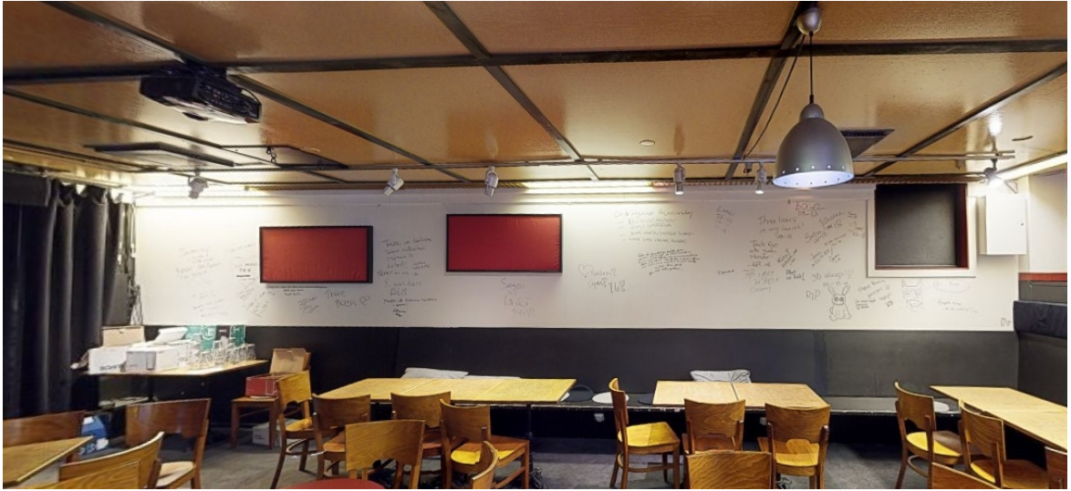
Kuva 12. Ravintola Three Beersin alaselin seinä täynnä seinäkirjoituksia ravintolan toiminnan loputtua.

lopussa. Rakennukseen ei olla avaamassa baaria. 258