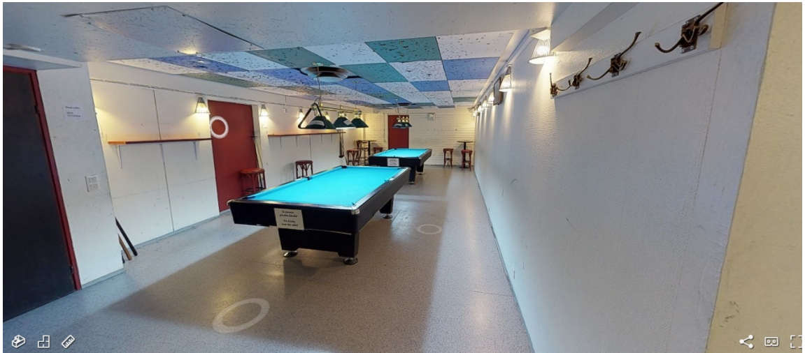
Kuva 11. Ravintola Three Beersin biljardihuone. (Kuvakaappaus Muuritutkimus ky:n 3d-mallista. Kameraoperaattorit: Arttu Liimatainen ja Akseli Tolvi 2018.)

haittaavat vaatekappaleet lojuivat seiiniä vierustavilla punaisilla baarijakkaroilla ja biljardikepit nojailivat ryppäissä salin nurkissa, vaikka ilmoituslaput seinässä kehottivatkin palauttamaan biljardikepit takaisin paikoilleen telineisiin. Tilassa oli kaksi kahdeksanjalkaista biljardipöytää, jotka eivät tosin enää täytä kilpatason vaatimuksia, sillä viralliset kilpailut pelataan yhdeksänjalkaisilla pöydillä kisasääntöjen muututtua. Useimmiten ainakin toisessa pöydistä oli peli käynnissä. Kummankin biljardipöydän päätyä koristi laminoitu viesti, joka kehotti asiakasta pitämään juomat etäällä pöydästä. Biljardipöytien verat vaihdettiin vuosittain tasokkaan pelikokemuksen ylläpitämiseksi ja veralle läikkynyt juoma pakottaisi pöydän ylimääräiseen huoltoon, joka tulisi ravintolalle hyvin kalliiksi puhumattakaan harrastustoiminnan väliaikaisesta katkeamisesta. 170 Seiniin asennetut puiset tasot, joille myös liidut oli koottu, olivat juomien säilyttämistä varten. Tila oli kirkaasti valaistu seiiniin kiinnitettävillä lampuilla. Seinillä oli myös taulutelevisiot, jotka mahdollistavat urheiluotteluiden seuraamisen pelaamisen ohessa. Salin katto oli täynnä reikiä, jotka todennäköisesti oli tökitty biljardikepeillä kuka vahingossa, kuka tahallaan. Yllä kuvattu ympäristö johdatti asiakkaan Ravintola Three Beersin ravintola-annokseen vielä vuoden 2018 ensimmäisellä puoliskolla.