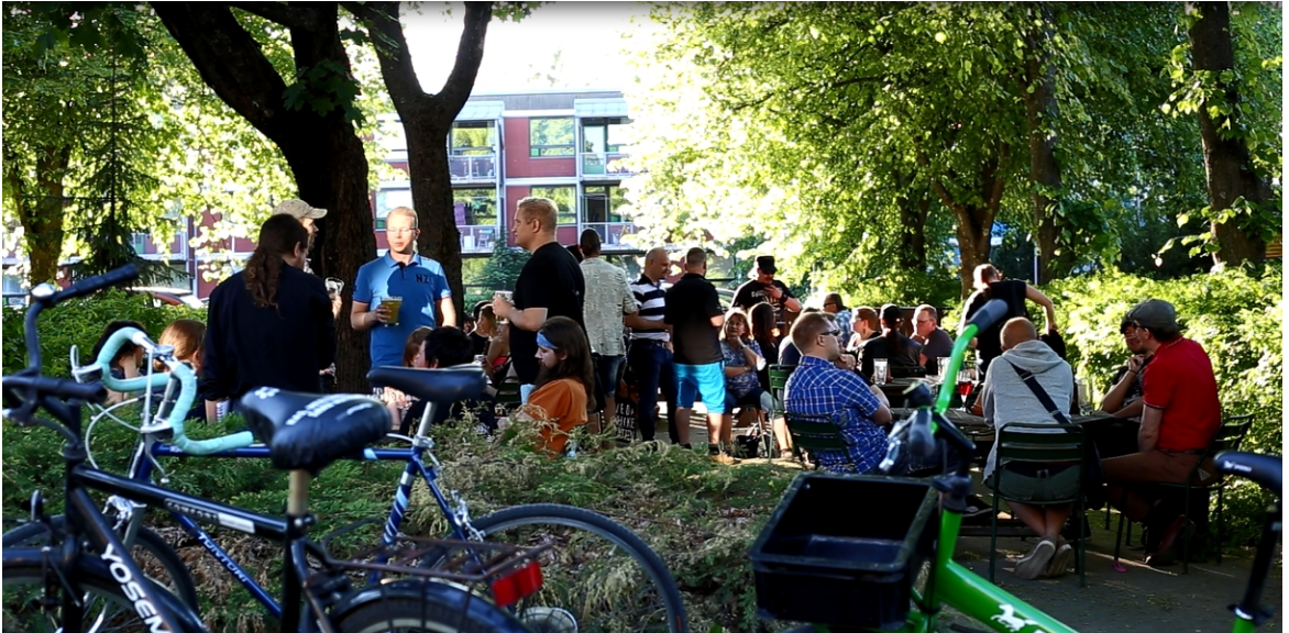
Kuva 4. Ravintola Three Beersin terassi Kantis-iltana 2.6.2018. (Kuvakaappaus Tarinoita Trebarista -dokumentin täytekuvamateriaalista. Kuvaaja: Ikaros Ainasoja 2018.)

kaikennähnyt sementtijalkaan istutettu metallinen tuhkakuppi. Ensimmäisen vihjeen ravintolan ilmapiiristä sai jo ovelta, sillä järjestyksenvalvojaan kulkija ei todennäköisesti törmännyt ovelta tai edes oven auettua. Ravintola ei tarvinnut ovelleen tuimaa portinvartijaa kuin harvoina tuvan äärimmilleen vetävinä erikoisiltoina. 147