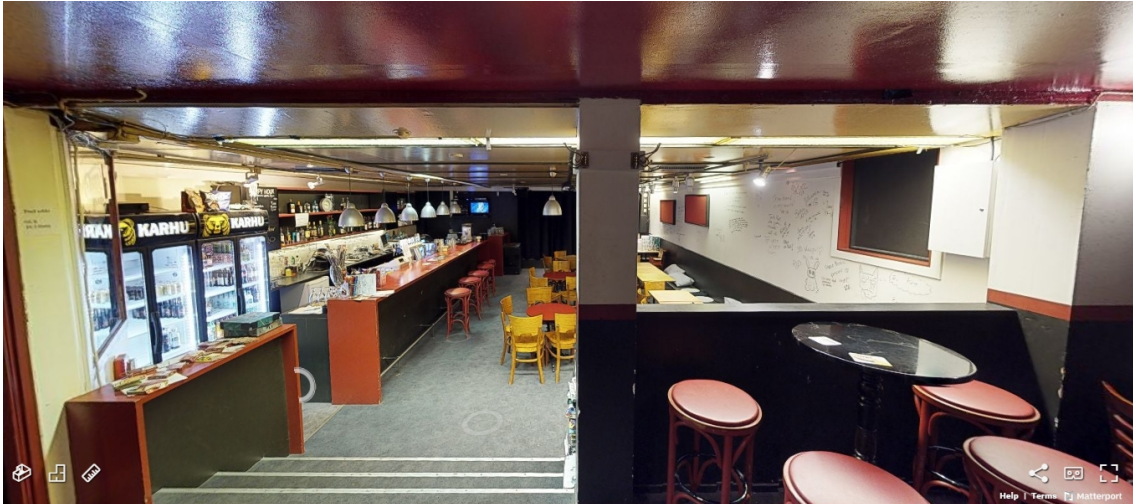
Kuva 7. Ravintola Three Beersin alasali.