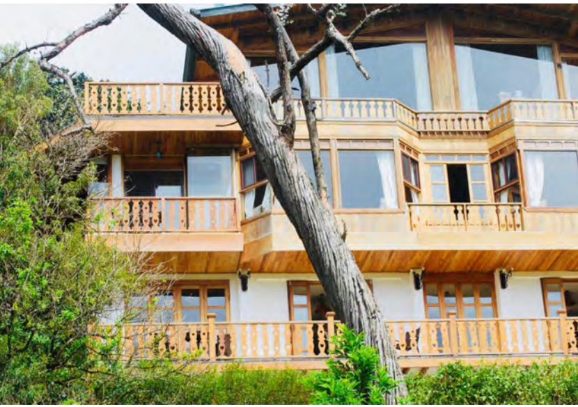
Ylhäällä: Hotel Belmar

Cala Lodge on myös osa perhehotellien keskittymää Monteverden seudulla. Osana hotellin toimintaa tehdään hyväntekeväisyyttä ja edistetään sosiaalisesti kestävästä kehitystä. Hotelli pyrkii merkittävästi edistämään sukupuolten välistä tasa-arvoa ja naisten osallistumismahdollisuuksia. Yhdistämällä taloudellista kehitystä sosiaaliseen kestävyteen, hotelli tukee naisten johtamien PK-yritysten osallistumista. Suurimmat haasteet ovat turismin vaikutukset sosiaaliseen hyvinvointiin sekä suurista matkailijavirroista aiheutuva kulttuuriperinnön ja paikallisidentiteetin rapautuminen. Muita haasteita ovat matkailun kielteiset vaikutukset paikalliseen maa- ja meriekosysteemiin.