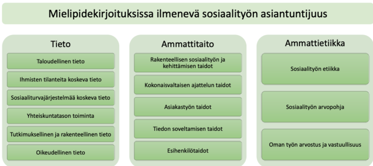
Taulukko 3: Mielipidekirjoituksissa ilmenevä sosiaalityön asiantuntijuus

Tutkimuksen toteuttamisen ja aineiston analyysin kuvailun jälkeen esittelen tutkielmani tuloksia. Olen lähtenyt analyysissäni liikkeelle tarkastellen mielipidekirjoituksia suhteessa sosiaalityön asiantuntijuuden kolmeen ulottuvuuteen, tietoon, ammattitaitoon ja ammattietiikkaan. Aineistosta nousseet sosiaalityön asiantuntijuuden piirteet jakaantuivat näihin ulottuvuuksiin niin, että tieto - ulottuvuus oli suurin (97 poimintaa), taito -ulottuvuus toiseksi suurin (73 poimintaa) ja ammattietiikan ulottuvuus reilusti näitä pienempi (36 poimintaa). Mielipidekirjoituksissa ilmenneen sosiaalityön asiantuntijuuden yläluokkatasoinen jaottelu on koottu Taulukkoon 3 ja tarkempi analyysi alaluokkineen löytyy tutkielman liitteistä (Liite 2).