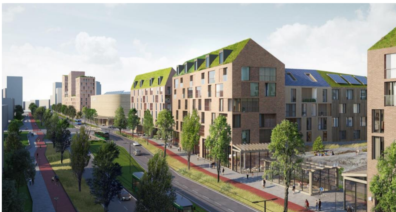
Kuva 6. Näkymäkuva kaava-alueelta Riistavuoren suuntaan.