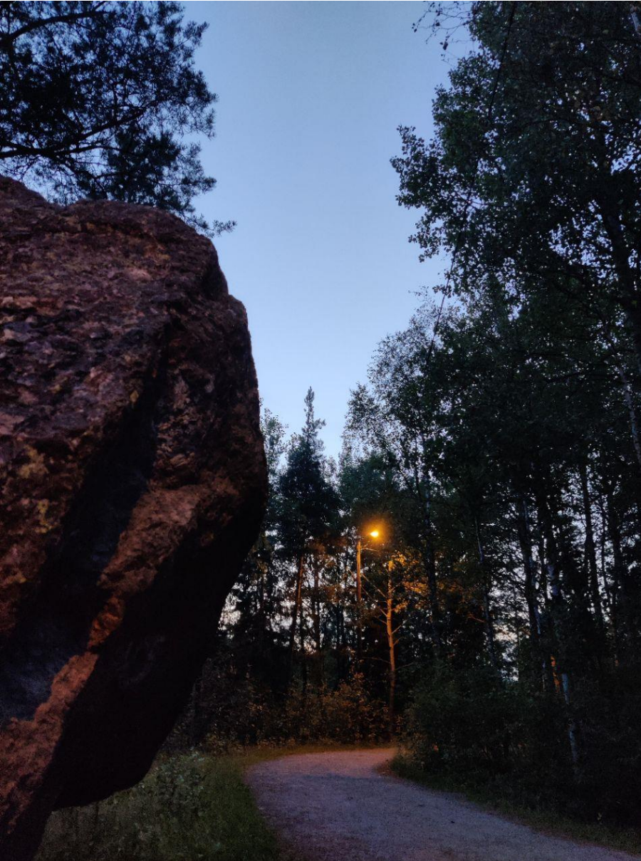
Kuva 7. Riistavuoren puistoa kesäiltana 2021.

Esimerkit osoittavat miten moninaiset tekijät vaikuttavat ihmisten muistijälkien kautta palautuvien ja sekoittuvien aistikokemusten syntymiseen ja siten paikkasuhteen muodostumiseen.