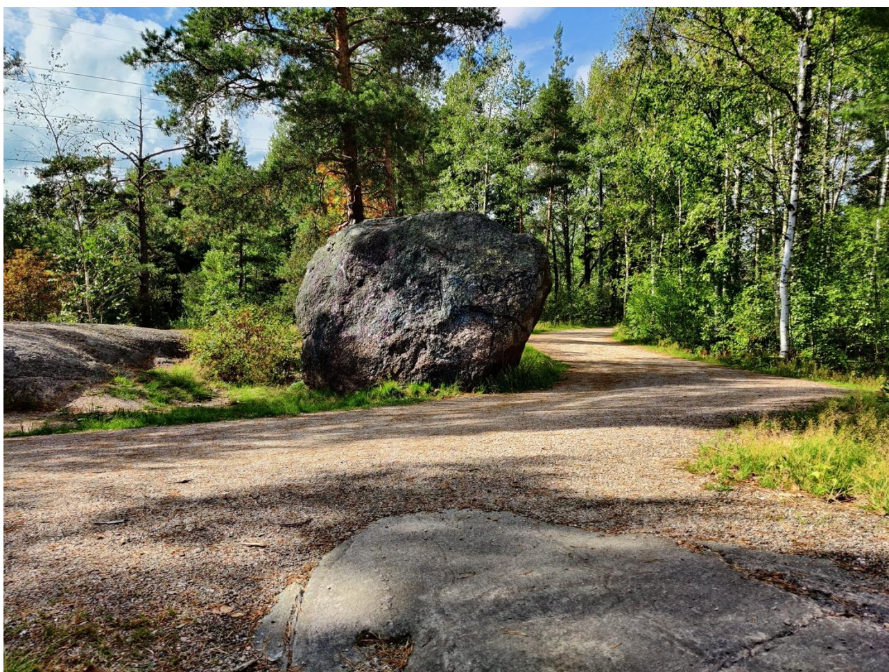
Kuva 8. Näkymää Riistavuoren puistoon kesällä 2021.

Myös eläinten havaitseminen tuotti vastauksien perusteella ihmisille elämyksen tunteita ja voimisti kokemusta luonnollisesta, merkittävästä ympäristöstä.