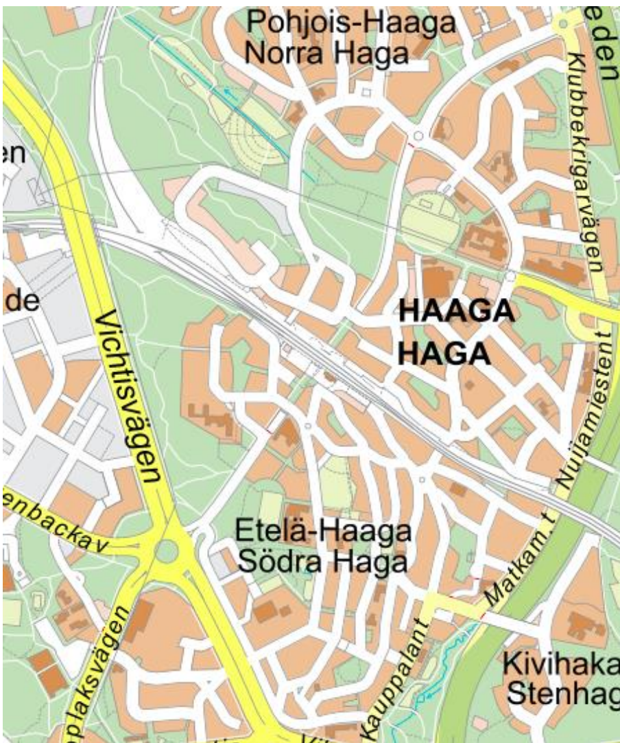
Kuva 1. Kartta Riistavuoren puistosta Helsingin Haagassa 2021.

Riistavuoren puisto sijaitsee läntisessä Helsingissä Haagan kaupunginosassa. Kuvan 1 kartta osoittaa, miten viheralue rajautuu lännessä Vihdintiehen, idässä Etelä-Haagan asuinalueeseen ja pohjoisessa Vantaankosken radan sekä Leppävaaraan kaupunkiradan / Turun rantaradan risteämäkohtaan. Riistavuoren eteläpuolella puisto rajautuu Haagan liikenneympyrään sekä Eliel Saarisen tiehen, jonka varrelle on rakenteilla pääkaupunkiseudun uusi runkolinjayhteys. Koko Haagan itäpuolella kaupunginosaa reunustaa Hämeenlinnanväylä, jonka vieressä on Helsingin keskuspuisto. 111