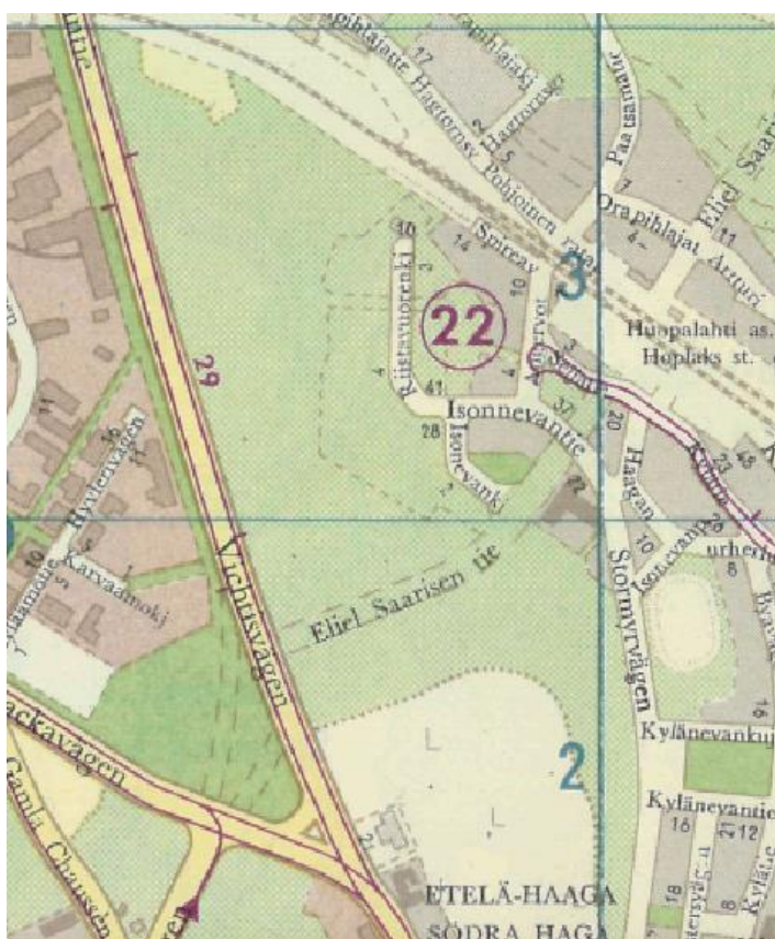
Kuva 3. Riistavuori Helsingin kartalla 1962.