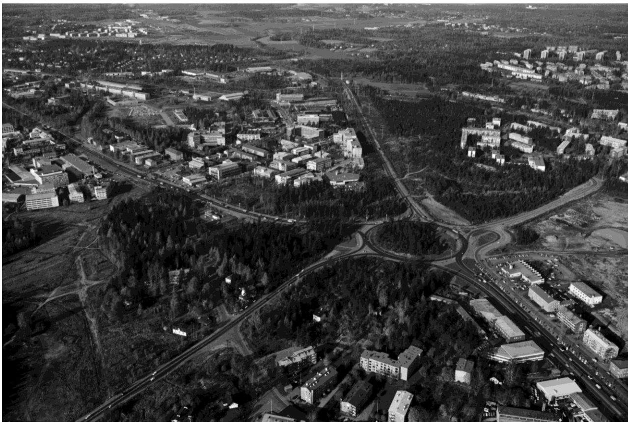
Kuva 4. Ilmakuva Riistavuoren suuntaan 1970.

Kuvan 4 ilmakuva 121 antaa osviittaa siitä, miltä Riistavuori lähialueineen näytti 70-luvulla, kun Eliel Saarisen tiekin oli jo rakennettu Riistavuoren poikki. Riistavuori on kuvassa oikealla liikenneympyrän jälkeen. Se vasemmalla puolella on Vihdintie, kuvan oikeassa laidassa on tuolloin uudeksi Haagan puistoksi rakennettu alue ja uusi Eliel Saarisen tie. Eliel Saarisen tien nimi kertoo myös alueen historiasta, sillä tie kulkee juuri siinä kohdassa, missä Bertel Jungin ja Eliel Saarisen vuoden 1915 Munkkiniemi-Haaga -suunnitelmassa kulki Haagan toinen pääkatu 122 .