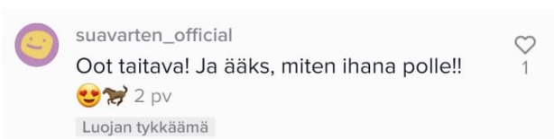
Kuva 3: Esimerkki Sua varten somessa -hankkeen jalkautuvasta nuorisotyöstä.

Sua varten somessa -hanke tekee nuorisotyötä niillä alustoilla, joita nuoret suosii. Sua varten somessa -hankkeen työntekijät päivystävät hankkeen sosiaalisen median tilejä arkisin klo 9–20, ja vastailevat nuorilta tulleisiin yksityisviesteihin. Yksityisviestien lisäksi toiminta on niin sanottua jalkautuvaa nuorisotyötä, mikä Sua varten somessa -hankkeen kohdalla tarkoittaa sitä, että hankkeen tili seuraa aktiivisesti heidän seuraajiaan, sekä muiden nuorten tekemää sisältöä sosiaalisessa mediassa. Hankkeen työntekijä käy läpi julkaisujen kommenttikenttiä ja puuttuu mahdolliseen kiusaamiseen tai häirintään. Sua varten somessa -hankkeen työntekijä tiedottaa nuorille esimerkiksi julkaisun kommenttikentillä, että kiusaaminen on väärin sekä kertoo nuorille miten häiritsevien kommenttien tai kiusaamisen kanssa voi tehdä. Työntekijä voi pyytää nuoria myös juttelemaan heille yksityisviestillä nuoren kokemasta kiusaamisesta. Lisäksi nuoret voivat itse sosiaalisen median alustoilla merkitä (tägätä) kommentteihin Sua varten somessa -hankkeen tilin, jos huomaavat kiusaamista tai häirintää. Tällöin Sua varten somessa tili tietää tulla paikalle puuttumaan häirintään. Sua varten somessa -hanke tuottaa myös itse sisältöä sosiaaliseen mediaan, jonka tarkoituksena on tiedottaa nuoria kiusaamisesta, seksuaalisesta häirinnästä sekä häirintään puuttumisesta. 141