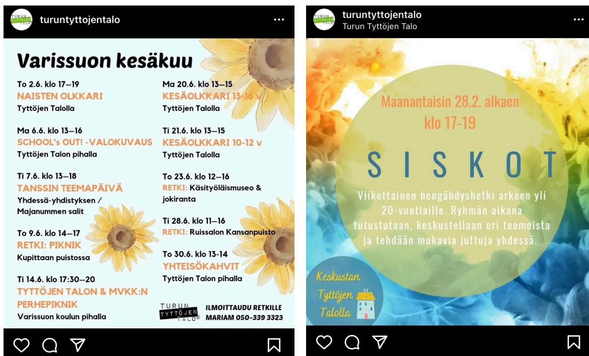
Kuvat 1 ja Kuva 2: Vasemmassa kuvassa on näkyvissä Varissuon toimipisteen kesäkuun 2022 aikataulu. Oikeassa kuvassa puolestaan on keskustan toimipisteen Siskot-ryhmän mainos. Molemmat kuvat on julkaistu Turun Tyttöjen Talon Instagram sivuilla. Kuvakaappaukset Turun Tyttöjen Talon Instagramista (@turuntyttojentalo).

Turun Tyttöjen Talon keskustan ja Varissuon toimipisteet toteuttavat kohderyhmilleen sekä ryhmätoimintaa, että yksilötyötä. Toimintaa toteutetaan arkipäivisin ja toiminnasta tiedotetaan Turun Tyttöjen Talon nettisivuilla sekä sosiaalisen median kanavilla. Turun Tyttöjen Talo julkaisee yleensä aikataulun, josta näkyy joko koko kuukauden tai viikon ryhmätoiminnat ja avoimet ajat. 95