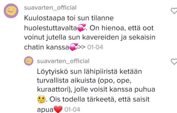
Kuva 6: Esimerkki Sua varten somessa -hankkeen emojiä käytöstä. (Lähde: Sua varten somessa -hankkeen koulutuksen diat).

Haasteena puolestaan chat muotoisessa nuoren kohtaamisessa on kehonkielen puuttuminen. Ainoa viestinnän väline on siis teksti sekä mahdollisesti emoji, joilla nuorisotyöntekijän tulee yrittää ilmaista esimerkiksi myötätuntoa, ja joiden avulla nuorisotyöntekijän tulee yrittää tunnistaa nuoren kokemat tuntemukset. 165 Mutta kuten tutkimusaineistosta kävi ilmi, empatian näyttäminen verkossa on mahdollista, vaikka se onkin hankalampaa. Empatian näyttämisen mahdollisuuksista on esimerkkinä Sua varten somessa -hankkeen viestinnän muoto, jossa he käyttävät paljon emojiä kuvaamaan esimerkiksi myötätuntoa.