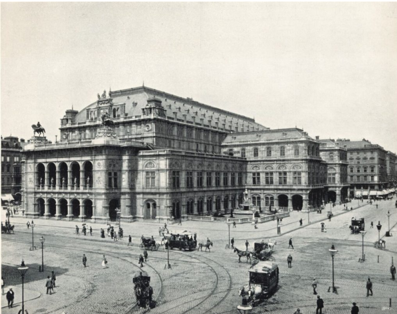
Vuonna 1869 valmistunut uusi oopperatalo.

Kuten Ringstraße kaupunkitilana on edelleen läsnä nykypäivässä, myös 1800-luvun modernin muros vaikuttaa monin tavoin sinä kulttuurissa, jossa me elämme tänä päivänä. Tämän päivän Eurooppa ongelmineen ja jännitteineen on 1800-luvun poliittisten ja sosiaalisen muurosten muovaama, eikä sitä voida ymmärtää ilman ymmärrystä historiasta.