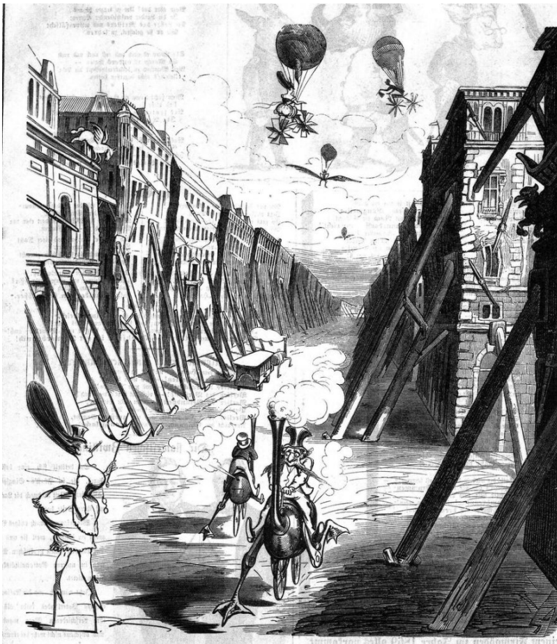
Pilakuva Kikeriki-lehdestä vuodelta 1869.

Vaikka pilalehtien poliittisen satiirin traditio liittyi etenkin vuoden 1848 vallankumoukseen, 1800-luvun lopun pilalehdet toimivat uudenaikaisessa kaupallisessa ja intermediaalisessa ympäristössä. Pilalehtiä on aikaisemmin tutkittu etenkin lehdistön historian näkökulmasta, mutta väitöskirjani tarkastelee niitä osana aikakautensa populaarikulttuuria. Pilalehtien huumori perustui monenlaisiin viitteisiin eri kulttuurin osa-alueille, se toi yhteen arkielämän kokemukset kaupungissa ja viittaukset historiaan, politiikkaan, taiteisiin, tieteisiin ja klassiseen kirjallisuuteen. Huumorin ymmärtäminen perustui jaetuille kokemuksille ja merkityksille. Viitsit ja pilakuvat toivat yhteen erilaisia yllättäviä ja ristiriitaisia elementtejä, ja niiden koomisuuden ymmärtäminen vaati toisinsa sopimattomien kontekstien ja assosiaatioketjujen oivaltamista.