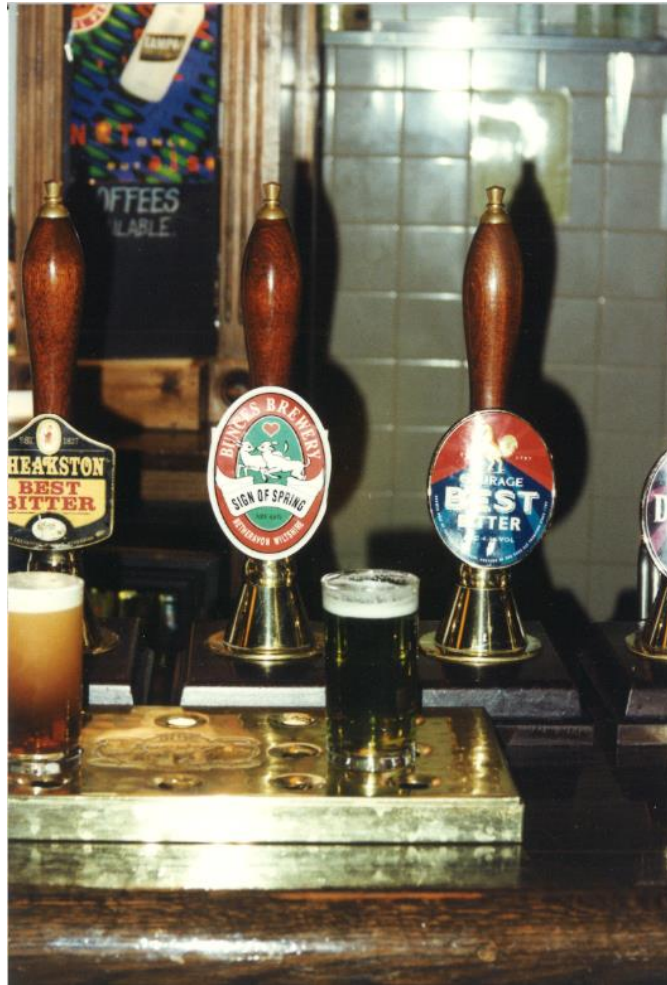
Kuva 6: Kuva joltakin bankkiirien 1990-luvun olutmatkalta Englannista. Kuvassa brittiläisiä Real Ale -hanoja, joista on ilmeisesti juuri pumpattu ale-olutta tuoppeihin maisteltavaksi.

Moni muistaa työntekijöiden tekemät reissut ulkomaille, ensin olutta hakemaan ja sittemmin vain ”tutustumaan maailman eri puolille”. Alkuun reissuja tehtiin kerran vuodessa ja kahdessa osassa, sillä kaikki eivät voineet olla poissa töistä samalla kertaa. Ensimmäinen tehty reissu suuntasi Brysseliin, jolloin Old Bankiin haettiin pääasiassa Cantillon-olutta. Haastateltava muistelee, kuinka kyseessä saattoi olla ensimmäinen Suomeen tullut Cantillon-merkkinen olut. Brysselin reissun aikataulu oli kiireinen, Kovasiipi oli ajanut etukäteen paikan päälle ison peräkärryn kanssa, jonne Suomeen tuotavat oluet saatiin mahtumaan. Työntekijöitä mukana reissussa oli kolme, ja pian lähdettiin ajamaan kohti Rotterdamia. Matkan varrella pysähdyttiin jokaisessa vastaan tullessa kuppilassa, mutta harvemmin olutta ehdittiin juomaan loppuun ennen kuin kuului että ”paikka on nähty” ja lähdettiin kohti seuraavaa etappia. ”Joka paikas otettiin olutta ja maisteltiin, siellähän niitä oluita riittää, mutta koskaan ei ehditty juomaan loppuun kun sit mentiin taas.” (H2.) Yhdellä reissulla taas haettiin pakettiautolla oluita Belgian ja Pohjois-Ranskan pienpanimoista. Myös