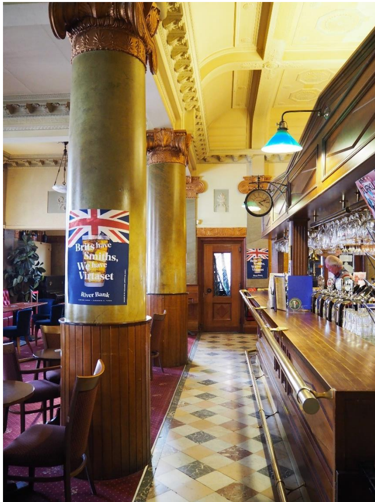
Kuva 8: Old Bank vuonna 2019 ennen sulkemistaan. Pankin viimeisinä aikoina seinille ja pylväisiin ilmestyi julisteita, joissa humoristisesti mainostettiin uudet britti-pubi River Bankin avautumista.

Vuoden 2019 marraskuussa saapunut uutinen Old Bankin lopettamisesta sai aikaan runsaasti uutisointia. Sosiaalisen median päivityksissä käytiin mielipiteiden vaihtoa asian suhteen. Etenkin meillä Old Bankissa keskustelu kävi kuumana, mutta varmasti juttua riitti ympäri Turun ravintoloita. Ensimmäisten joukossa uutisesta saimme kuulla me työntekijät. Muistaakseni olo oli epäuskoinen ja hämmentynyt. Epätietoisuus tulevan suhteen oli häiritsevää – missä määrin paikka jäisi Old Bankiksi ja mitä muutettaisiin. Seuraavaksi asiasta saivat kuulla kaupunkilaiset erilaisten lehtijuttujen muodossa. Tiskillä sai vastaila asiakkaiden kysymyksiin, heilläkin oli selvästi sulatteleminen asian suhteen. Vaikka joukossa oli mielenkiinnolla tulevaa ravintolaa odottavia, ovat mieleeni jääneet etenkin ne runsaslukuiset kävijät, jotka olivat tyytymättömiä tilanteeseen. Ehkä