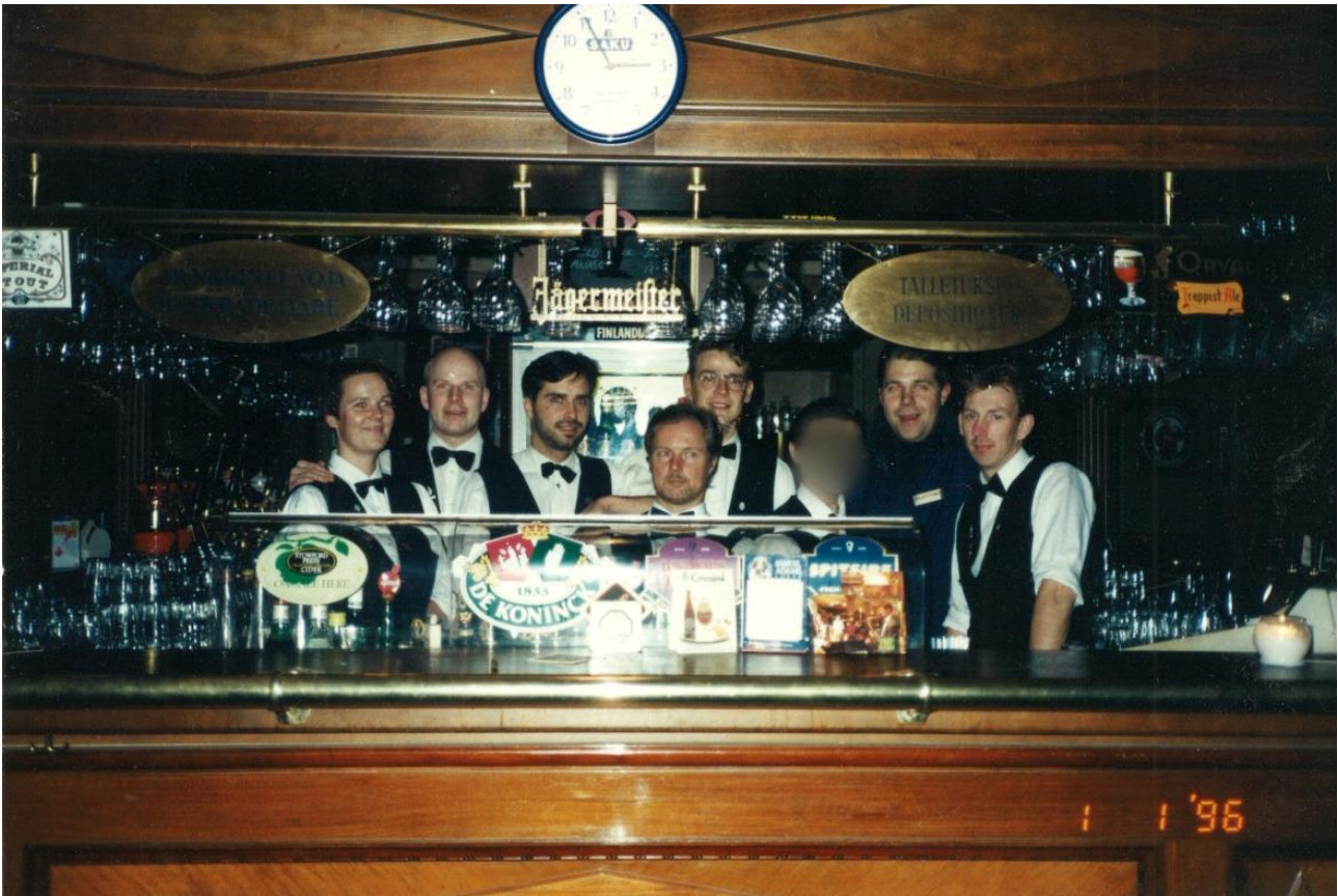
Kuva 7: Old Bankin henkilökuntaa baaritiskin takana. Alakulmassa näkyy ajankohta 1/1/96. Kuvassa olijoilta kysytty lupa julkaisuun, mutta kaikkia en viime hetkellä tavoittanut.

Henkilökuntaa kuvaillaan useammassa kirjoituksessa ammattitaitoiseksi ja asialliseksi.