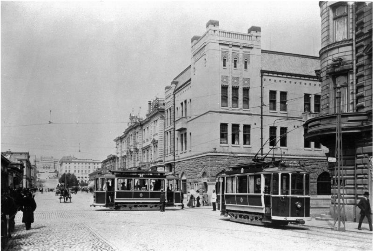
Kuva 3: Näkymä Aurakadun suuntaisesti noin vuonna 1910. Pankkirakennus keskellä oikealla. Kaduilla liikennettä raitiovaunujen, kävelijöiden ja hevoskärryjen muodossa.