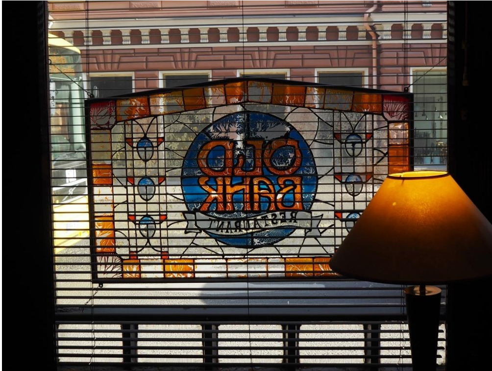
Kuva 13: Näkymä ravintola Old BAnkin ikkunasta Linnankadulle.

Muistelussa vaikuttava nostalgia ei kuitenkaan vähennä niiden arvoa tai tee niistä vähemmän epätosia. Kaikesta päätellen Old Bank on ollut hieno, arvostettu ravintola, jota sen asiakkaat kaipaavat ja monelle tärkeä osa kaupunkia.