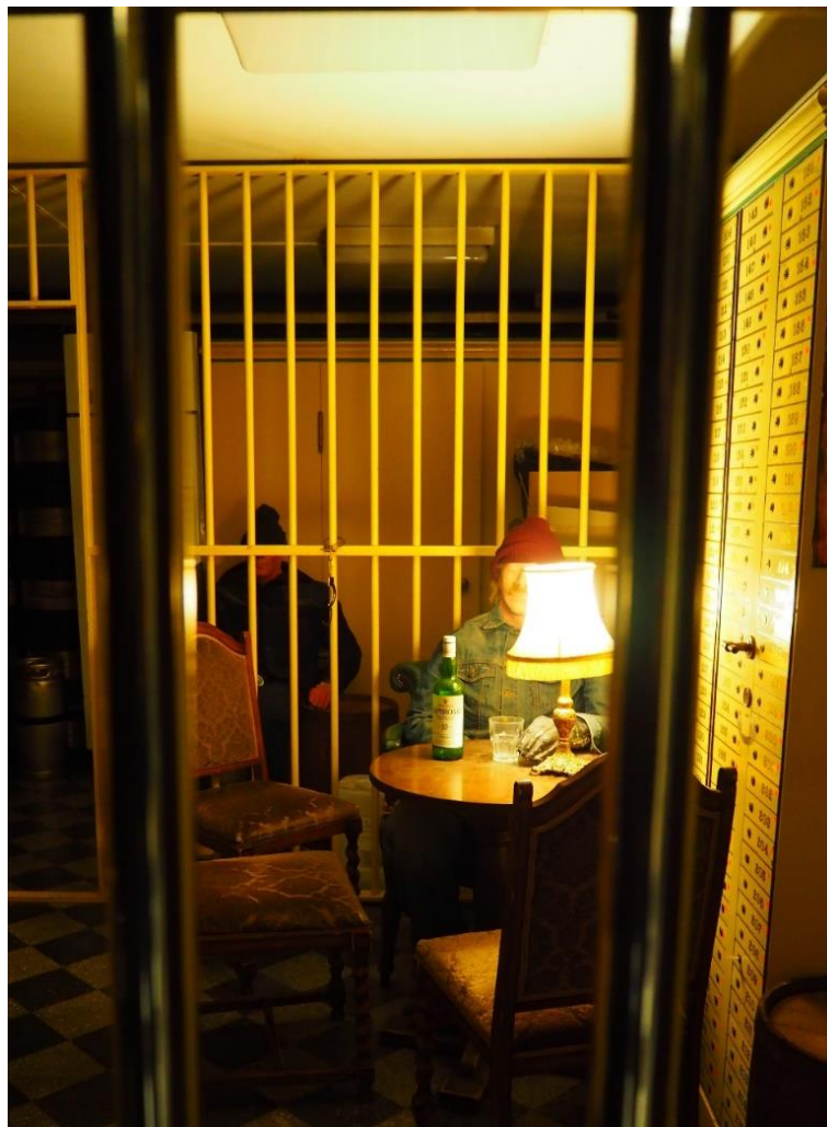
Kuva 5: Kuva Old Bankin kellarikerroksesta, jossa kaltereiden takana tyhjiä olut-tankkien varasto sekä sheriffi- ja pankkirosvo-nuket.

Eräs harvemmin asiakkaille välittynyt puoli oli tunnelma, joka valtasi tilan myöhään öisin tai aikaisin aamulla, asiakkaiden poistuttua. Keskustelimme haastattelun lomassa, kuinka öisin yksin rakennuksessa ja alakerrassa esimerkiksi tilitystä puuhaillessani jouduin usein syöksymään juoksujalkaa portaita yläkertaan sammutettuani kellarikerroksen valot. H2 kertoo, kuinka hänkin joutui toisinaan lähtemään tarkistamaan, mistä kuuluivat kaikenlaiset erikoiset äänet oletettavasti tyhjässä rakennuksessa. Myös sheriffin muotoon puettu nukke, joka istuskeli olutpullo edessään holvissa kaltereiden takana, muuttui etenkin pikkutunneilla aavemaiseksi. En ole selvästikään tuntemuksieni kanssa yksin, sillä kuuleman mukaan myös eräs siivooja joutui aikoinaan jättämään Bankin siivoamisen, sillä hänen mukaansa rakennuksessa kummitteli. (H2.)