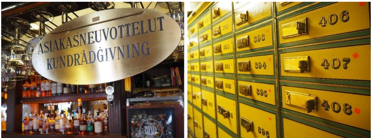
Kuva 4: Baaritiskillä oli vanhoja pankinaikaisia kylttejä, joissa luki esimerkiksi ”Asiakasneuvottelut” tai ”Pankkineuvoja”. Kassakaappeja ja tallelokeroja oli esillä asiakkaiden katseltavina.

muuttuessa ravintolakäyttöön. Pankki avattiin sen historiallista ilmettä kunnioittaen. Ravintola remontoitiin heti alun perin vanhaa miljöötä arvostaen ja sen ehdoilla rakentaen. Moni pieni yksityiskohta muistutti vanhoista ajoista: Tiskillä roikkui vanhoja pankinaikaisia kylttejä, kuten ”Ulkomaat”, ”Asiakasneuvottelut” ja ”Pankkineuvoja”, toisen perähuoneen yllä luki ”Johtokunta” ja WC-tiloihin kuljettiin portaita alakertaan ”Tallelokeroille”. Myös pankkiholveihin pääsi kurkistamaan. Ravintolan yläkertaan johtavan portaikon ikkunoissa olevat lasimaalaukset kertoivat entisaikojen elinkeinoista. (H2, K2.) Eikä Kovasiipi olisi perustanutkaan ravintolaa toisenlaiseen paikkaan, minkäänlaiseen ”laatikkohuoneistoon” – hän toivoi, että ravintolan tiloissa näkyisi ”aito, vanha henki” (K7). Avautuessaan Old Bank erottui kaupungin ravintoloista, sillä yhtä arvokkaaseen kiinteistöön ei ollut aikaisemmin perustettu ravintolaa, etenkin olutravintolaa. Myös perustaja oli eräänlainen legenda ravintola-alalla. (H3.) Toinen haastateltava kuvaa Pankin olleen avara ja iso verrattuna ”tavallisiin pubeihin” (H5).