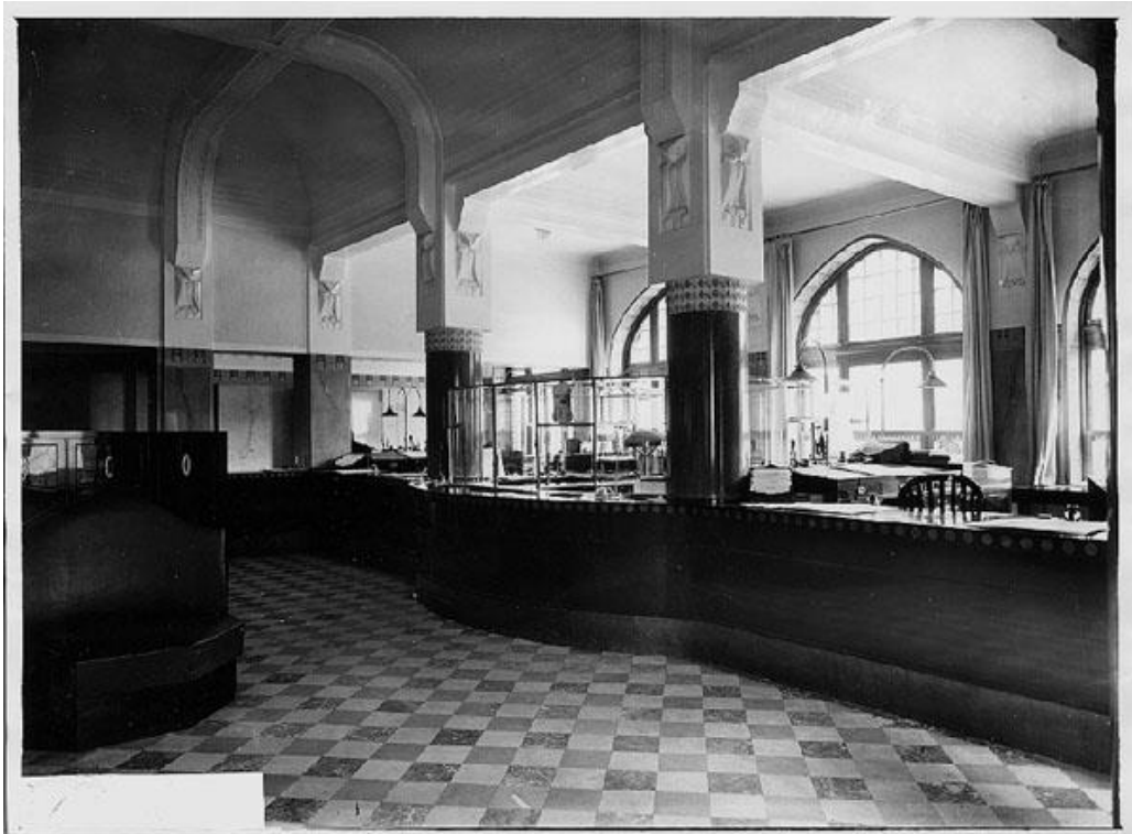
Kuva 1: Turun Osakepankin konttori 1900-luvun alussa.

Syyskuussa vuonna 1827 Turku koetteli kaupungin siihenastisen historian tuhoisin tulipalo, jonka seurauksena kaupunki oli suurelta osin rakennettava uudelleen. Uuden asemakaavan ripeään suunnitteluun osoitettiin silloisen intendenttikonttorin johtajana työskennellyt C. L. Engel, ja kuukauden kuluttua suunnitelma olikin jo valmis esitettäväksi. Engel edusti voimakkaasti uusklassista tyyli-suuntausta, ja suunnittelussa tärkeiksi tekijöiksi nousivat paloturvallisuus sekä esteettisyys. Engelin laatima ruutukaava on vielä tänäkin päivänä vahvasti nähtävissä Turun kaupunkikuvassa. Uuden kaavan myötä aikaisempi sokkeloinen keskiaikainen kaupunki muuttui empirekaupungiksi, jossa suunnittelua ja rakentamista leimasi puuempire ja puutaloidealismi. (Sundstén 1979, 221–222.)