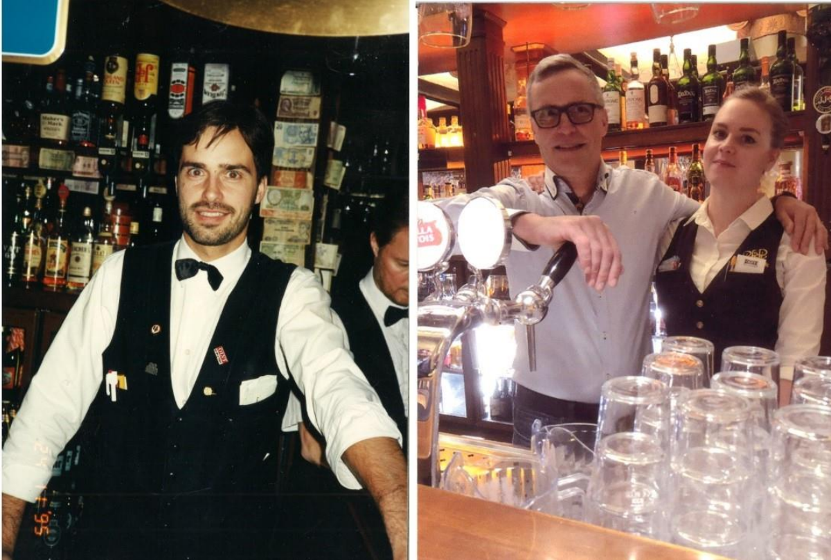
Kuva 9: Ensimmäisessä kuvassa isäni Old Bankin tiskin takana noin vuonna 1995. Toisessa me yhdessä saman tiskin takana ”Old Bankers”-iltana vuonna 2019, minä työasussa.

siksi, että tunsin itse samoin. Old Bankin loppuaikoina vuonna 2019 järjestettiin myös ”Old Bankers” ilta, ja tiskin taakse kutsuttiin muutamaksi tunniksi töihin ravintolan alkuaikojen työntekijöitä (H3). Ilta oli onnistunut ja herätti muistoja ja positiivisia tunteita monessa asiakkaassa sekä työntekijässä.