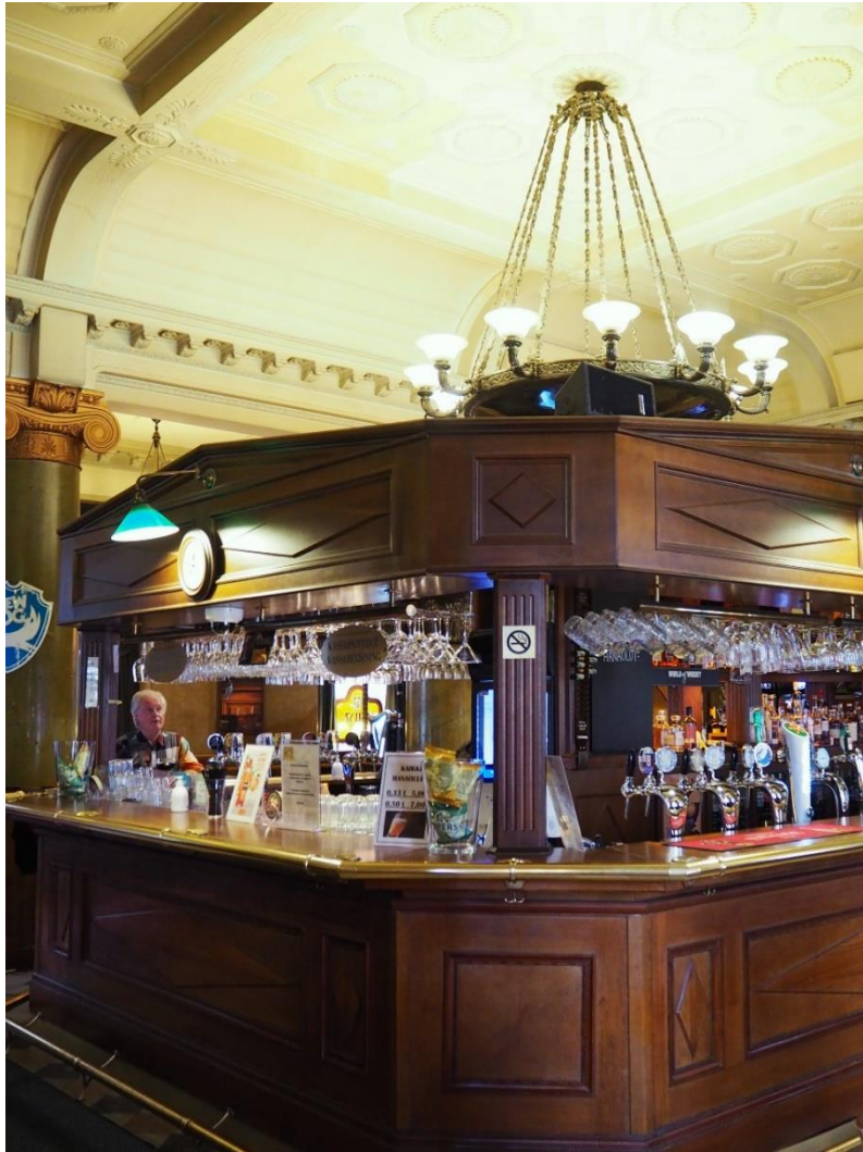
Kuva 10: Kuvassa baaritiski ja kattokruunu vuonna 2019. Kuvassa näkyy myös hieman kattorakenteiden ja pylväiden koristekuvioita.

molemmin puolin rivi olutkaappeja: Niiden yläpuolella hyllyillä laaja valikoima erilaisia viskejä (etenkin skotlantilaisia), jonkin verran vodkaa, konjakkeja, brandyja ja erilaisia liköörejä.