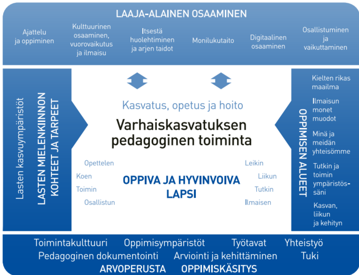
Kuvio 2. Varhaiskasvatuksen pedagogiikan toiminnan viitekehys (Opetushallitus 2022, 38)