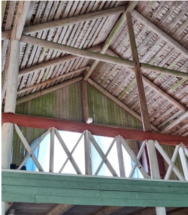
Kuva 7: Honkolan lavan orkesteriparvea ja kattorakenteita vuonna 2021.

Honkolan lavan sisärakenteiden erityispiirteisiin kuuluu korotettu parvi, joka on orkesteria varten. Myös orkesteriparvea kiertää samantyyppinen ristikkolaudoitus kuin lavan ympärystäkin. Parven alla on puffetikatos, josta pääsee myös poistumaan lavan taakse. Lavan takaosassa on pieni huopakatteella päällystetty varasto-osa. Lava on rakennettu pääasiassa luonnonmateriaaleista. Alkuperäinen pärekatto on edelleen tallella mutta se on myöhemmin päällystetty huopakatteella. Katon eteläpuoleiselle, mäenpuoleiselle sivulle on lisätty rännikouru, jota pitkin vesi ohjautuu kivijalan ohi mäkeä alas.