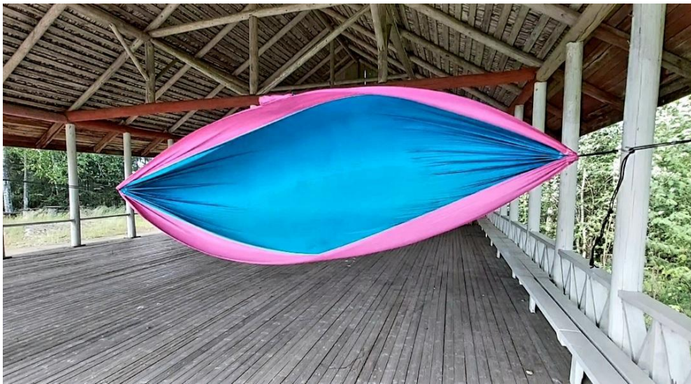
Kuva 16: Kuvakaappaus videosta. Tuulen tanssittama riippumatto.

Yksi Honkolan lavan keskeisiä elementtejä, joka on periaatteessa näkymätön, mutta jonka voi kuulla ja tuntea, on tuuli. Tuuli tulee näkyväksi myös vasta koskettaessaan jotakin materiaalista elementtiä. Yöpyessäni lavalla, tuuli tarttui aamulla tyhjään riippumattooni ja riepotteli sitä. Se näytti minusta tanssilta ja riippumaton kautta tuulikin tuli näkyväksi osaksi lavakokemusta.