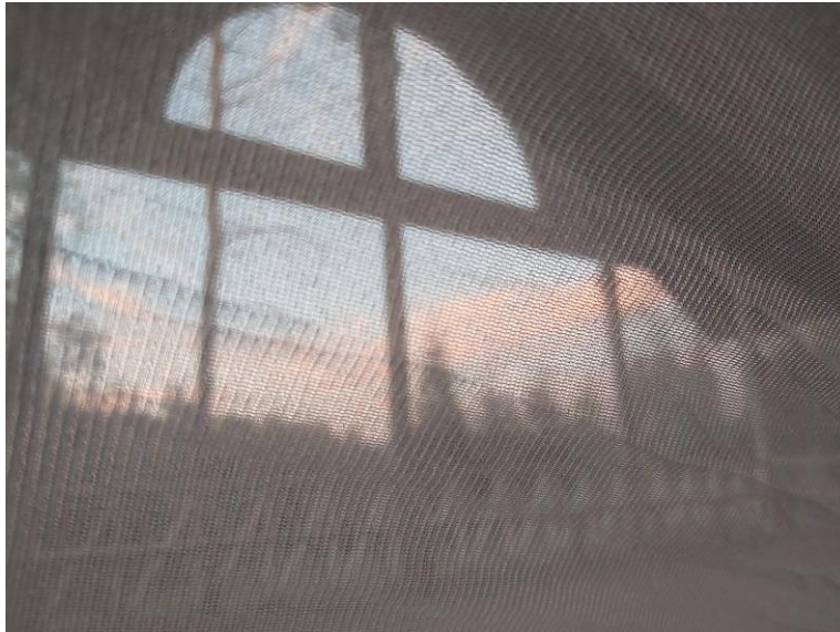
Kuva 12: Honkolan lavan itäpääty riippumatosta katsottuna 1.7. klo 3.42.

Yöpymiskerralla kaksi tapahtumaa nousee yllättäväksi: yöllinen herääminen ja aamulla valon lavalle heijastamat varjokuviot. Molemmat ovat odottamattomia sattumia, ja ehkä juuri siksi niistä tulee niin mieleenpainuvia.