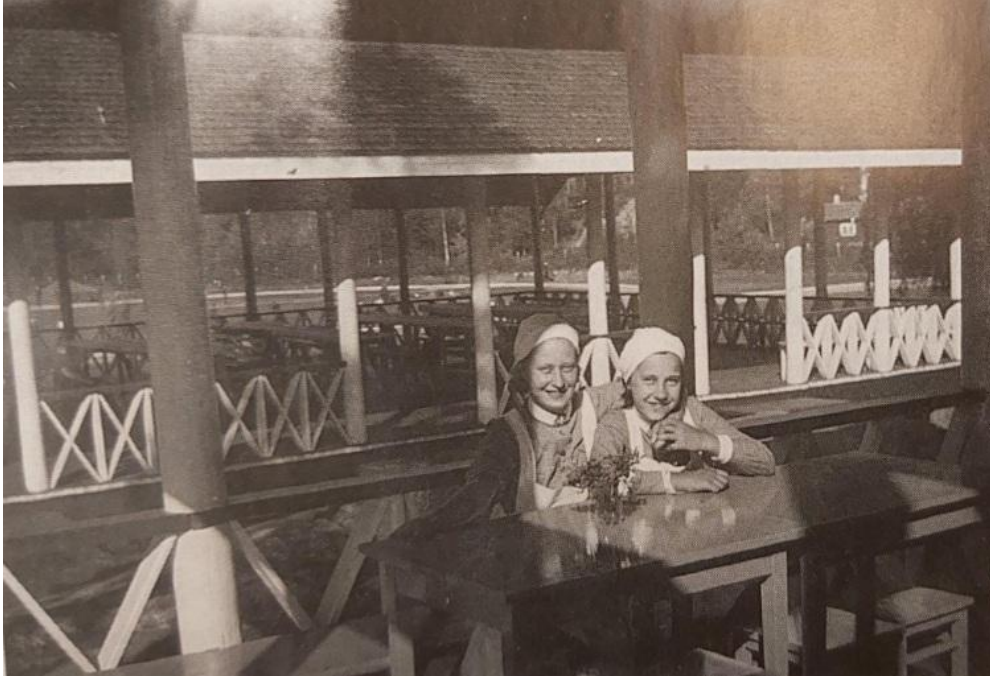
Kuva 5: Lottia Honkolan lavan ravintolarakennuksessa. Kuvausajankohta, kuvan ottaja tai henkilöiden nimet eivät ole tiedossa. Ravintolarakennus paloi 1962.

Honkolan lavan edustalla on edelleen lautarakenteinen lippukoppi, jonka iästä ei ole tarkkaa tietoa, mutta sellainen on ollut paikalla jo pitkään.