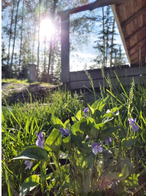
Kuva 9: Metsäorvokki lavan nurkalla.

tavallaan tunnistamisen kokemus, yhteys edelliseen kesään. Samanlainen tunnistamisen kokemus oli lavan päädyssä kasvavan metsäorvokin näkeminen ensimmäisellä havainnointikerralla 269 .