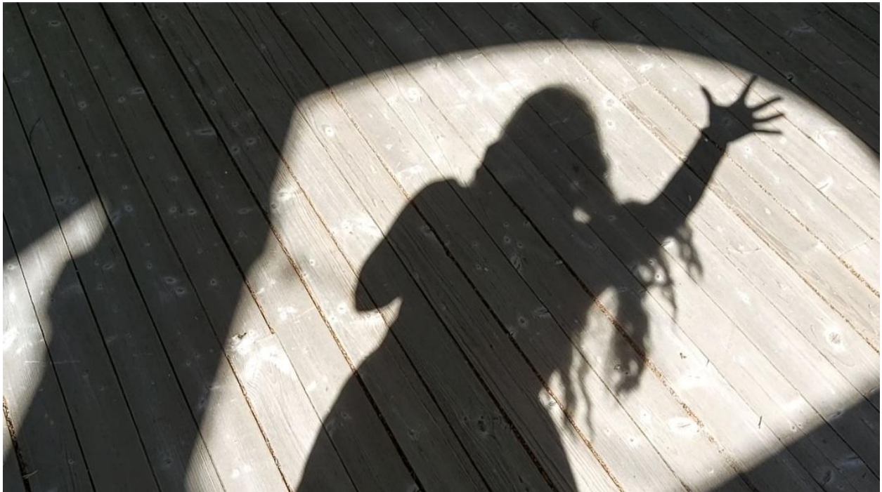
Kuva 17.

“Leikin hiuksilla tuulessa. Kuvasin varjokuvia ja videoin omaa varjoani. Tuntui kuin tanssiva varjo olisi kiinni minussa. Tanssitin varjoani. Tuli mieleen Peter Panin varjo.” 313