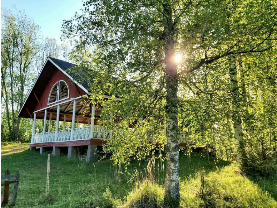
Kuva 8: Honkolan lava 4.6.2022

Kuvittelen itseni saapumassa Honkolan lavalle nurmikentän tietä pitkin polkupyörää taluttaen. Jonnekin tänne myös haastattelukumppanini on aikoinaan jättänyt pyöränsä.