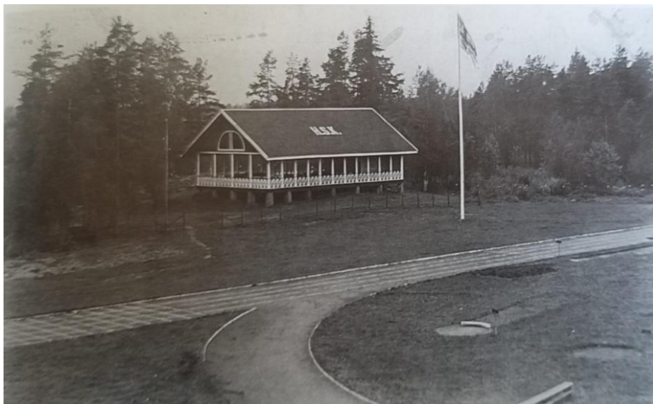
Kuva 4: Honkolan lavarakennus (Kuva: Salo-Mäkelä 1996, 45). Kuvan ajankohdasta tai ottajasta ei tietoa. Katon kirjaimet ovat lyhennelmä Honkolan Suojeluskunnasta.

Lavarakennus rakennettiin aikanaan, jotta alueella voitaisiin järjestää urheilukilpailujen lisäksi tansseja ja muita tapahtumia. 57 Lavan rakentamisen jälkeen rakennettiin vielä 1939 erillinen ravintolarakennus, joka oli ulkonäöltään samantyylinen kuin itse tanssilavarakennus, mutta se paloi 1962 58 . Ravintolarakennusta muistelee myös haastateltavani, joka oli kesällä 2022 käynyt lavalla ja kiinnittänyt huomiota ravintolarakennuksen puuttumiseen: