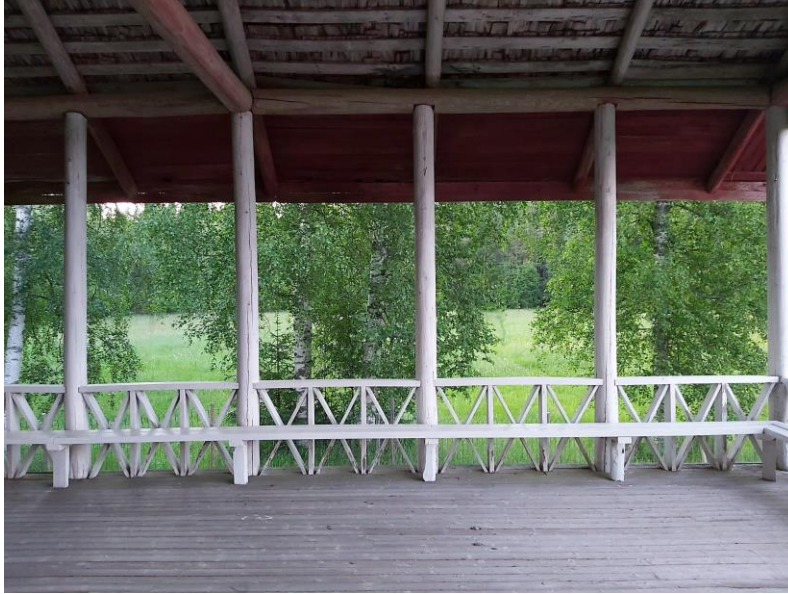
Kuva 10: Kentänpuoleista penkkiriviä.

“Tätä kirjoitin pohjoisreunan reunapenkillä istuen, selkä nurmikenttää päin. Kello on 22.52.” 271