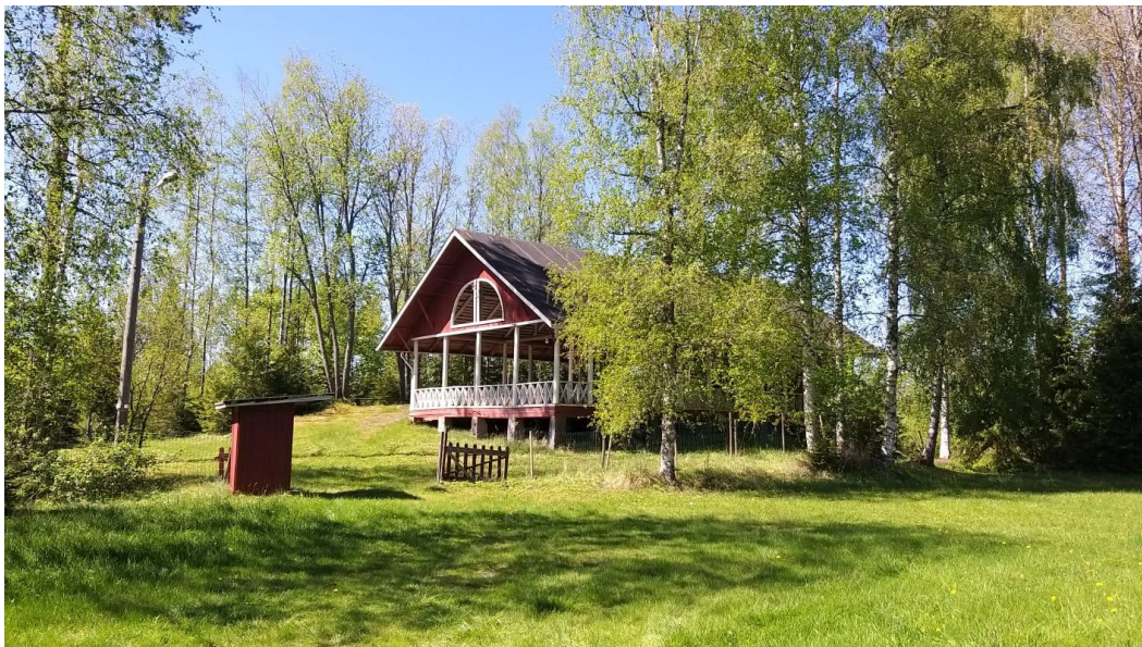
Kuva 6: Honkolan lava kuvattuna alkukesästä 2021. Lavan edustalla lippukoppi.