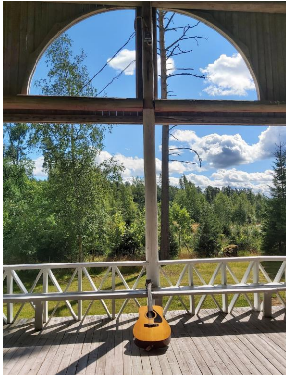
Kuva 14.

Kenties tämän aamuisen varjokuvan symboliikka saa minut näkemään lavan itäpäädyn uudella tavalla, symbolisena luonnon alttaritauluna.