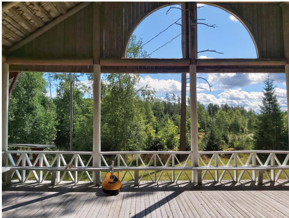
Kuva 15: Näkymä Honkolan lavan itäpäädystä.

“Klo 12.25 riippumatossa. Keinuttelin itseäni tässä riippumatossa (ilman hyttysverkkoa) ja sain ajatuksen. Tää Honkolan lava on kuin näyttämö - luonnon näyttämö. Joka sivuilta, erityisesti etupäädystä, se ohjaa ihmisiä katsomaan luontoon, tuoden luonnon näytille. Tää on ikään kuin kolmiulotteinen kehys, joka kehystää luonnon, mutta samalla ei, antaa sen olla raamien ulkopuolella. Ihminen on raamien sisällä ja saa ihastella vapaata luontoa.” 302