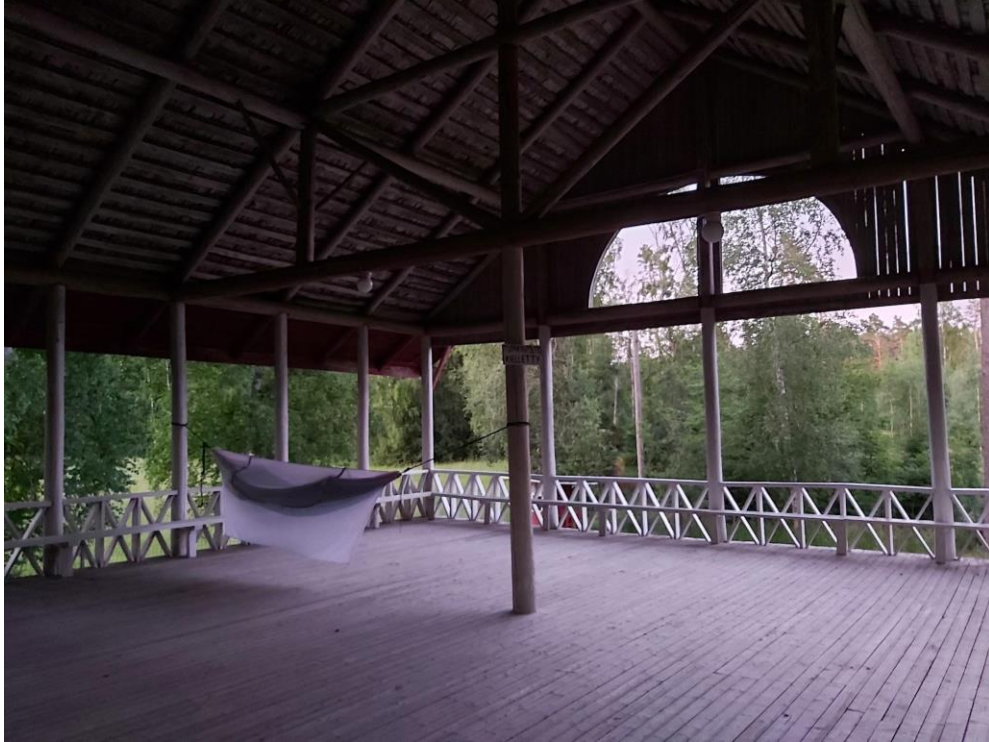
Kuva 11: Tutkimusleiri Honkolan lavalla 30.6.klo 23.30

Yöpymisestä minulla on kaikista eniten kenttämuistiinpanoja ja valokuva- sekä videoaineistoa. Lavalla pidempään vietetty aika näkyy muistiinpanoissa refleksiivisyytenä ja olen muistiinpanoissani pohtinut, kuinka lyhyt oleilu ohjaa suorittavampaan tarkkailuun 296 .