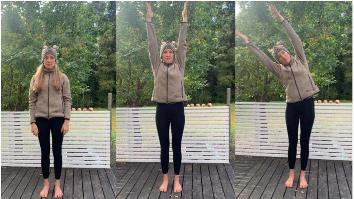
KUVA 1 Esimerkki liikkeitä liikesarjavidеosta

tehtiin jokaisessa ryhmässä samalla strukturoidulla tavalla sen toteutuessa. Aluksi lapsien kanssa tehtiin liikesarja seisoma-asennossa 1-2 kertaa, jonka jälkeen siirryttiin suoraan tekemään hengitysharjoitus istuma-asennossa. Hengitysharjoitus tehtiin 2 kertaa, kuten ohjevideolla näytettiin. Tämän jälkeen siirryttiin rentoutusharjoitukseen, jonka kaikki opettajat olivat itse suunnitelleet. Rentoutus oli toteutettu ryhmissä makuuasennossa erilaisia menetelmiä hyödyntäen. Näitä erilaisia rentoutusmenetelmiä oli ollut rauhallisen musiikin kuuntelu sekä erilaisten sensoristen integraatiomenetelmien kuten sutien, nystyräpallojen ja silittelyn hyödyntäminen. Harjoituskokonaisuus oli noin 20 minuutin mittainen.