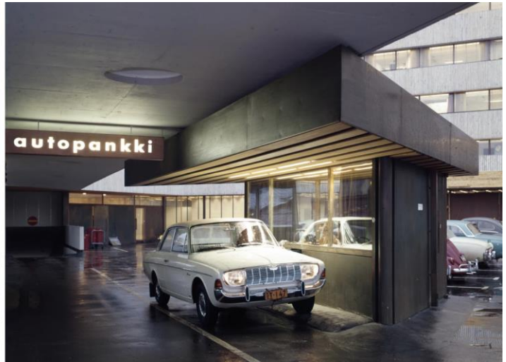
KUVA 7–8. KOP:N TALON SISÄÄNKÄYNTI JA AUTOPANKKI. KOP-KOLMIO, VUOSI TUNTEMATON.

Turun sanomat piti KOP-kolmion ulkoasua modernina ja kaupunkikuvaa kaunistavana. 208