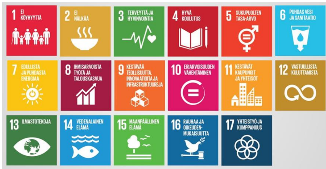
Kuva 1 Kestävän kehityksen tavoitteet Agenda 2030

Yksi kestävän liiketoiminnan malli on John Elkingtonin (1999) luoma ”Triple bottom line”-malli, joka jakaa yrityksen tehtävät perinteisesti yhden osa-alueen eli taloudellisen suoriutumisen sijasta kolmeen osa-alueeseen: taloudellinen kestävyys, sosiaalinen kestävyys sekä ympäristön kestävyys. Sosiaalinen kestävyys keskittyy yrityksen vaikutukseen työntekijöihin sekä laajemmin yhteiskuntaan. Siihen sisältyvät muun muassa reilut työolosuhteet, yhteisön tukeminen, oikeudenmukaisuus ja tasa-arvon edistäminen kaikilla tasoilla. Ympäristön kestävyys koskettaa yrityksen aiheuttamia ympäristövaikutuksia kuten energian käyttö, kierrätys sekä ympäristön suojeleminen. Taloudellinen kestävyys keskittyy yrityksen suorituskykyyn ja mahdollisuuteen kehittyä (Bansal, 2005). Kuvassa kaksi on havainnollistettu tätä kolmen osa-alueen yhteistoimintaa.