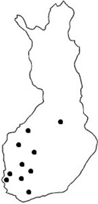
Kuva 4 Haastateltujen tilojen sijainti

Tuotantosuunnista ovat edustettuina sikatalous (lihasikala ja yhdistelmäsikala), lihakarjan kasvatus, maitotila sekä erikoiskasvien viljely. Yhdistävä tekijänä lähes kaikilla tiloilla on viljojen viljely sekä metsätalous. Neljä tilaa oli seuratussa luomutuotannossa. Taulukossa kaksi on esitetty tunnistekoodit, haastateltavan rooli, yhtiömuoto, tuotantosuunnat ja luomutilat.