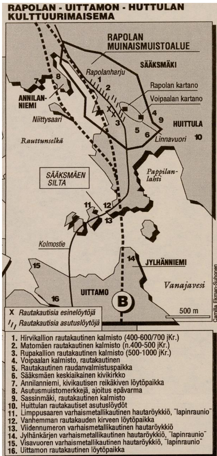
Kuva 2. Rapolan-Uittamon-Huittulan kulttuurimaisema. Uusi Suomi 28.1.1990. Kuvassa on suunnitellut moottoritie linjaukset.

Uusi Suomi -lehden julkaisussa 13.2.1990 on mielipidekirjoitus myös Niittysaaren linjausta vastaan. Kirjoituksessa korostetaan vesimaiseman merkitystä, jonka myös Niittysaaren läpi