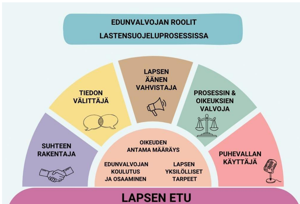
Kuvio 2 Edunvalvojan roolit lastensuojeluprosessissa