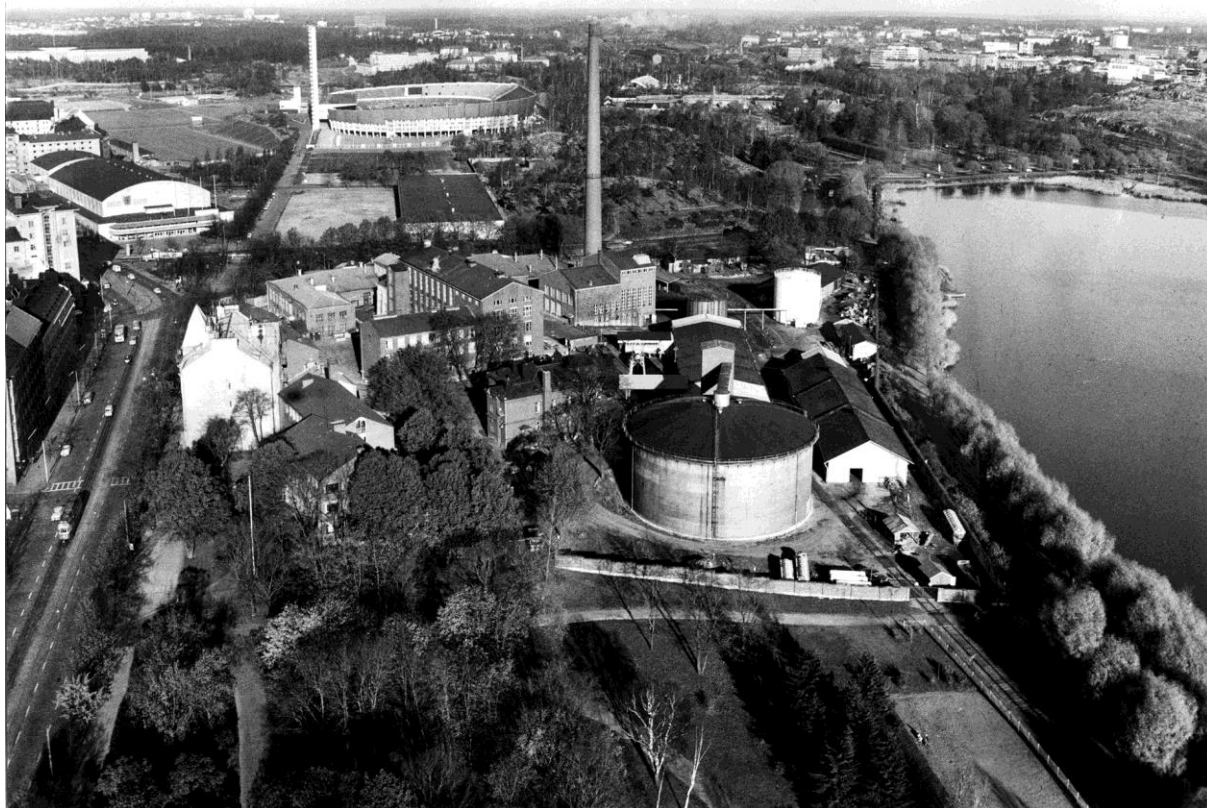
Kuva 1. Töölön sokeritehdas vuonna 1962. Kuvassa pistoraide näkyy oikeassa alakulmassa. Oikealla on Töölönlahti, vasemmalla Mannerheimintie ja taustalla Olympiastadion.

Neuvotteluissa kaupunki linjasi, ettei se tekisi päätöksiä ennen kuin keskustasuunnitelmat olisivat valmiina. 95