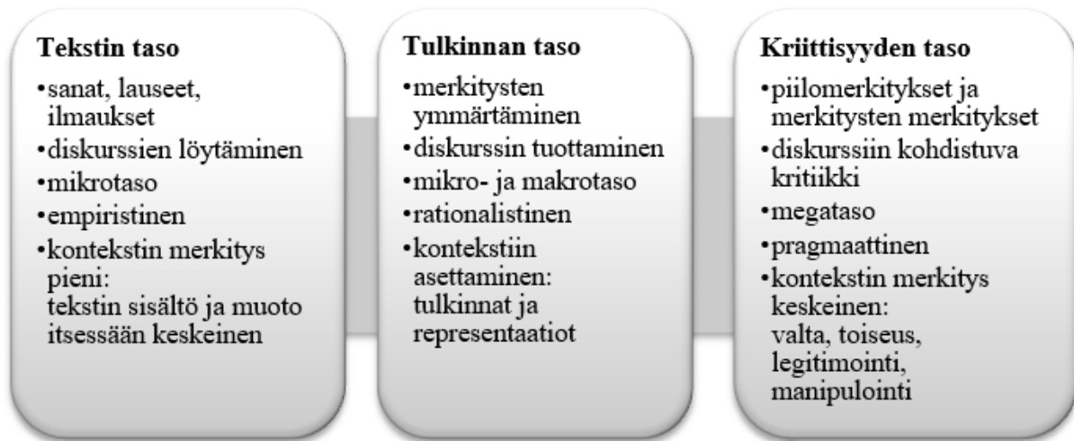
Kuvio 2. Diskurssianalyysin tasot (mukaillen Pynnönen, 2013, s. 32).

Mallin tasot muodostuvat tekstin, tulkinnan ja kriittisyyden tasosta ja diskurssianalyysi nähdään tasoilla etenemisen myötä syventyvänä prosessina. Ensimmäisellä, eli tekstin tasolla , olin liikkunutkin jo sisällönanalyysia tehdessä ja muodostanut sivistyksen eri ulottuvuuksia kuvaavat luokat. Olin siis saanut jo melko hyvän käsityksen siitä, mitä aineisto sisältää. Halusin kuitenkin palata diskurssianalyysin aluksi koko aineiston kattavaan tekstitiedostoon, koska halusin välttyä päätyvästä tarkastelemaan kontekstista irrotettuja tekstin osia. Luin aineistoa siis yhä uudelleen ja samalla myös poistin tutkimuksen kannalta epäoleellisia tekstin osia pois, jotta aineiston läpikäyminen tehostuisi.