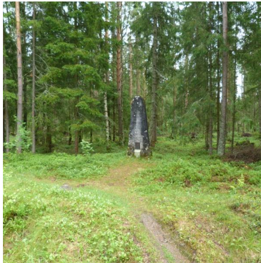
Kuva 13. Kuninkaankivi.

halki paikalle, jossa hän söi tunnetun leipänsä. Kuninkaankivessä lukee kuninkaan nimi ja saattaa olla maininta Peukalo-Liisasta. Nimittäin Peukalo-Liisa teki kuninkaalle leivän ja levitti peukalolla voita leivälle.