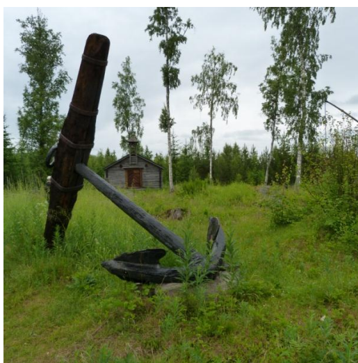
Kuva 2. Cronoholmenin laivanveistämö.

Paikkakertomus: Veistämöllä rakennettiin suuria rahtialuksia lähinnä Ruotsin tarpeisiin (1673–1704). Paikalla on rakennettu yli 60 alusta ja enimmillään veistämöllä työskenteli yli 200 ihmistä. Toiminta loppui maan kohoamisen vaikeutettua vesillelaskua. Jouxholmen on museoitu ja alue on suosittu retkikohde.