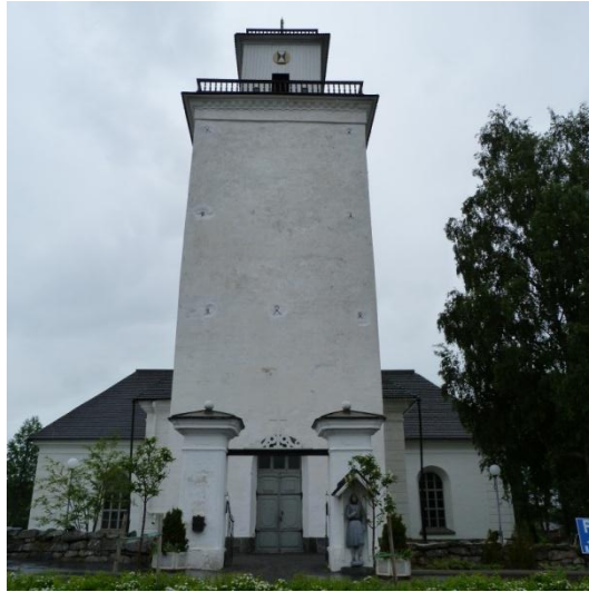
Kuva 4. Kaarlelan kirkko.

- Kruunupyyntie, Elisabetintie (koilliseen), Saarimäentie, Ventuksentie (luoteeseen), Eteläväylä (länteen), Vaasantie (pohjoiseen), Rautatienkatu, Kustaa Aadolfinkatu, Tehtaankatu (länteen), Vesitorninkatu, Torikatu (itään)