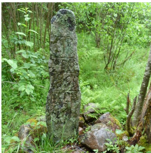
Kuva 7. Murhapaalu.