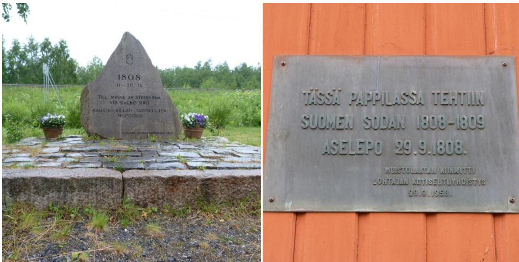
Kuva 5. Kaukon sillan taistelun muistomerkki ja aselepon muistolaatta Lohtajan pappilan seinällä.

Paikkakertomus: Perhojoella Kaukon sillan tuntumassa käytiin asema- ja tykistösoota kurjassa syksyisessä säässä vuonna 1808. Lähialueen asukkaat pakenivat Kotkamaalle. Lopulta vihollisuudet lopetettiin ja aselepo solmittiin Lohtajan pappilassa 29.9.1808. Kaukon sillan taistelun muistoksi on pystytetty kivi. Samoin aselepon kirjoittamisesta kertova muistolaatta löytyy pappilan seinältä.