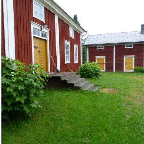
Kuva 3. Torgaren museoalue.

Paikkakertomus: Torgaren pappila ympäristöineen muodostaa ainutlaatuisen museokokonaisuuden. Pappilan päärakennus on vuodelta 1796. Seurakunnan kirkkoherrat ovat asuneet paikalla 350 vuoden ajan. Alueella sijaitsee myös koulumuseo, maatalousmuseo, sotilasmuseo ja korsi, meijerimuseo ja suutarimuseo. Alueelta alkaa luontopolku.