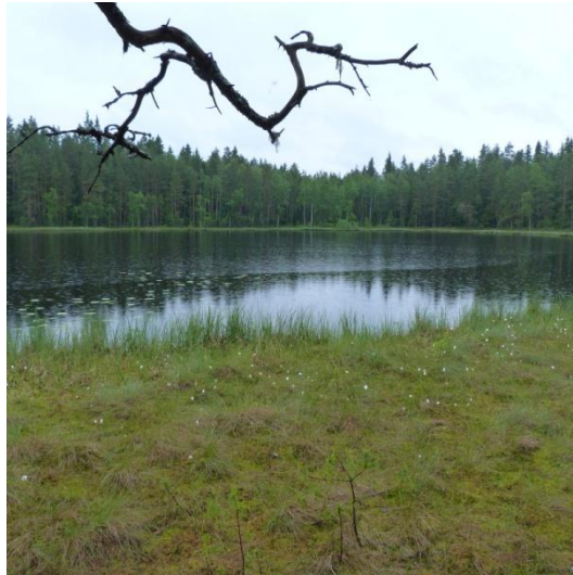
Kuva 6. Kasakkajärvi.

Paikkakertomus: Kasakkajärvi sijaitsee Ruotsalontien varrella Ruotsalon kylältä etelään päin. Tarinan mukaan ruotsalolaiset miehet tappoivat järvellä kasakoita. Kertomuksen perusteella ei tunneta tarkkaa ajankohtaa. Luultavasti tarina liittyy isovihan aikaisiin venäläisvainoihin.