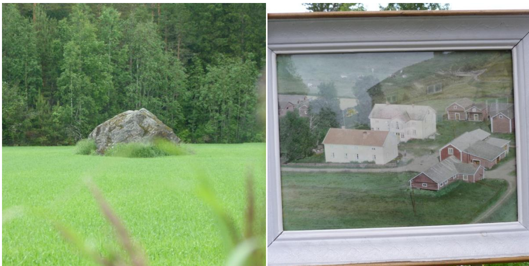
Kuva 11. Tytön ja kasakan tapot Kinaren taloissa.

Paikkakertomus: Suomen sodan aikana, syksyllä 1808 kasakka tappoi nuoren tytön Kinaren talojen läheisyydessä sijaitsevan ison kiven luona. Tytön sukulaismies kosti tapon keväällä 1809: kasakat tulivat jokivartta Himangan suunnasta Kinareelle. Kun yksi kasakka tuli kahden vierekkäin sijainneen aitan välistä talon pihalle, talon isäntä kalautti venäläisen karahkalla kuoliaaksi. Kasakka haudattiin aluksi talon kivijalan juureen. Myöhemmin, kun vanha suntio innostui kaivamaan luurangon esille, kasakan jäänteet löysivät lopullisen lepopaikkansa talon vieressä kulkevan Kinarenhenojan törmästä. Kasakan tappopaikka ja hauta sijaitsevat yksityisellä pihamaalla. Tarinassa esiintyvistä aitoista toinen on siirretty naapurin pihalle ja toinen Kokkolan Halkokarille saakka, Halkokarin ABC:n läheisyyteen.