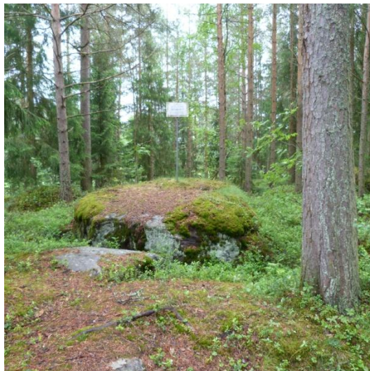
Kuva 10. Lohtajan mestauspaikka.

Paikkakertomus: Lähellä hautausmaata on perimätiedon mukaan mestauskivi. Kerrotaan, että kiven päällä on mestattu kuolemaantuomittuja. Viimeksi paikkaa lienee käytetty vuonna 1796, kun piialta katkaistiin kaula lapsenmurhan takia. Lohtajan kirkon edessä on piiskauspaikka, jossa rikollisia rangaistiin pieksemällä. Lohtajan kirkolta on saatavissa postilaatikosta opasteksti hautausmaakävelyä varten.