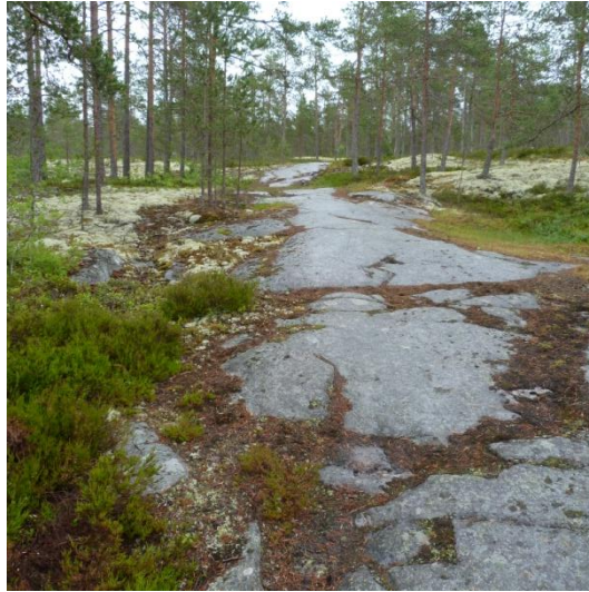
Kuva 9. Kirkkokalliot.