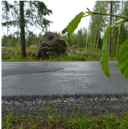
Kuva 8. Kasakkakivi.

Paikkakertomus: Kertomus perustuu esikuntakapteeni Olof Meleniuksen muistiinpanoihin. Kasakkakiven takaa kerrotaan perimätiedon mukaan Erkki Erkinpoika Anttilan ampuneen Karhin taloja ryöstelleen kasakan kesällä 1808. Tarinan mukaan neljä kasakkaa tuli Anttilan taloon Karhin kylään ryöstöretkelle ja talon isäntä ampui yhden ryöstäjästä kasakkakiven takaa hyljepyssyllä. Asian tiimoilta tunnetaan paikallisia, kasakkakiveen liittyviä kummituskertomuksia.