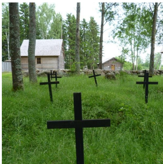
Kuva 1. Korpholmenin hautausmaa, kirkko ja museo.

- Hästöntie, Valtatie 8 (pohjoiseen), Brätöntie, Kannörintie, Jouxnabbantie