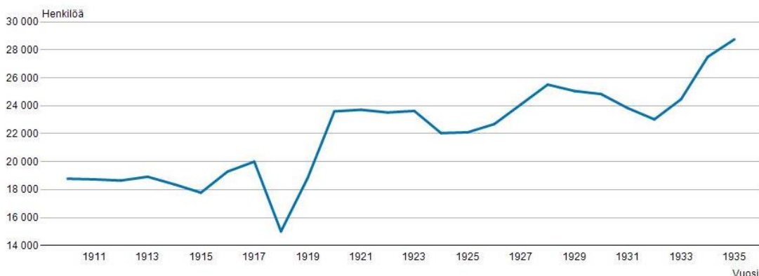
Kuvio 1: Suomessa solmitut avioliitot vuosina 1910–1935 81

ta poiketen myös 1930-luvun alkuun, sillä vuosikymmenten vaihteen uudistukset näkyvät tilastoissa silloin.