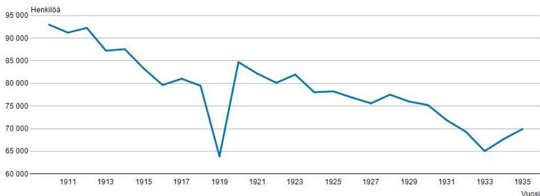
Kuvio 3: Suomessa elävänä syntyneet 1910–1935 86

mukaisuutta ei tarkistettu vaan perusteeksi omavaltaiseen hylkäämiseen riitti, että toinen puoliso jätti saapumatta oikeuden käsittelyyn ja oikeudenkäyntipaikasta oli tehty virallinen sopimus. 85