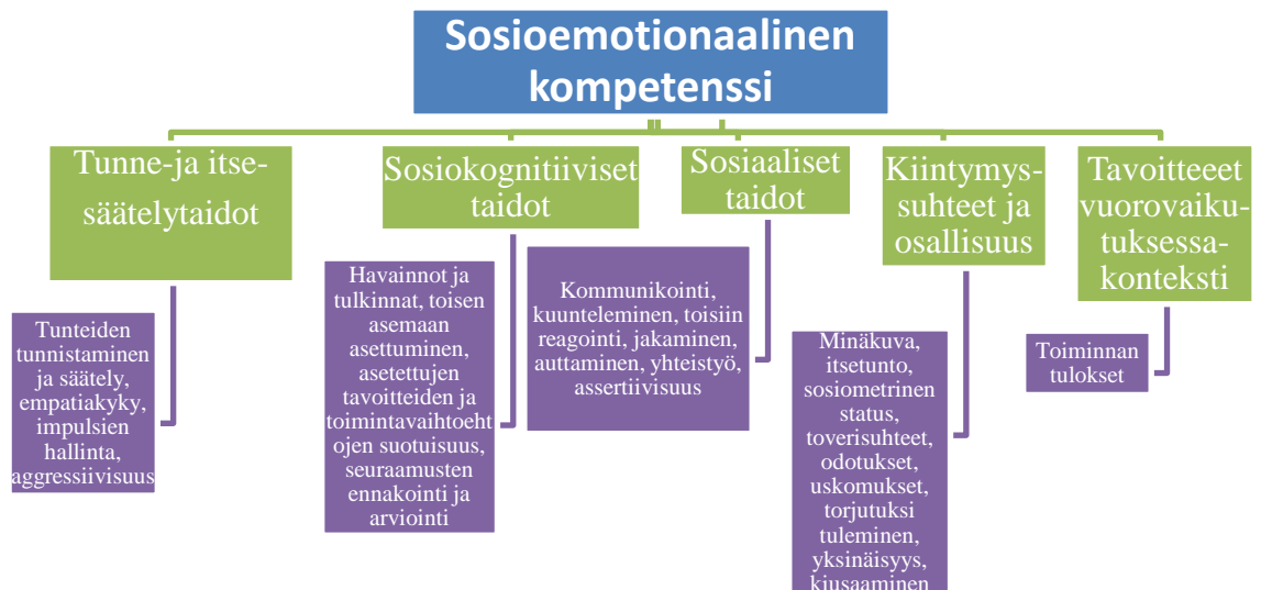
KUVIO 1. Sosioemotionaalisen kompetenssin malli (Hintikka 2018, 15.)

muodostuvat esimerkiksi toverisuhteista ja hyväksytyksi tulemisen kokemuksista. Onnistunut vuorovaikutus ryhmässä syntyy niin yksilön kuin ryhmänkin sosiaalisista vuorovaikutustaidoista. Kiintymyssuhteet ja osallisuus sekä onnistunut vuorovaikutus rakentavat sosioemotionaalista kompetenssia (kuvio 1). (Eisenberg ym. 2011, 473–474; Hintikka 2018, 15; Rose-Krasnor & Denham 2011, 163–172.) Vahvalle sosioemotionaalille kompetenssille tunnusomaista on myös se, että henkilö tunnistaa eri tilanteisiin liittyvät käytösnormit ja osaa myös toimia niiden mukaisesti (Hintikka 2018, 16).