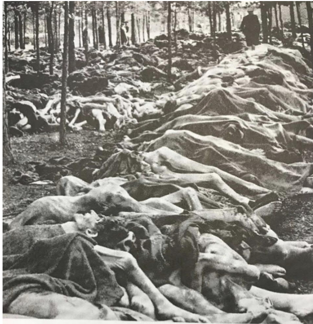
Ison-Britannian armeijan 15.4.1945 vapauttamasta Bergen-Belsenin keskitysleiristä muodostui heti sodan jälkeen natsimurhien symboli. Kuva metsään jätetyistä ruumiskasoista sai paljon julkisuutta; Suomessa Sosiaalidemokraatin etusivulla (5.5.1945).

metsästä löytyi kasoittain ruumiita. Ruumiista näkee selkeästi, kuinka huonoissa olosuhteissa ihmisiä on leireillä pidetty.