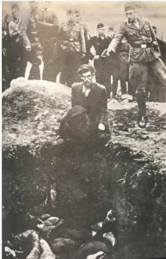
OIKEALLA: Valokuvan on ottanut tuntematon Einsatzgruppen jäsen ukrainalaisessa Vinnitsan kaupungissa, missä saksalaiset murhasivat 28 000 juutalaista syyskuussa 1941. Valokuvan taakse on kirjoitettu »Vinnitsan viimeinen juutalainen».

Holokaustin historia on pelkkää tuskaa ja kärsimystä, eikä sen päässä liene valoa tai vapautusta. Holokausti ei synnyttänyt Israelia eikä se päättynyt leirien vapauttamiseen. Valtaosa holokaustista selvinneistä ovat eläneet ja elävät sen synnyttämän painajaisen kanssa lopun ikäänsä. Jotkut ovat tulleet sen kanssa toimeen, toiset se on tuhonnut Auschwitziin kokoontuneiden poliitikkojen lausunnot (ei koskaan enää) käyttävät holokaustissa kuolleiden muistoa julmasti hyväksi oman poliittisen pääomansa lisäämiseksi. Useimpien historioitsijoiden, toisin kuin poliitikkojen, holokaustitulkintoilla ei ole humanisuutta ja yhteisöllisyyttä korostavaa sanomaa, koska sellaista ei holokaustin historiasta löydy. Väittäisin, että Vinnitsan viimeinen juutalainen, joka istuu joukkohaudan reunalla palttoo sylissään ja odottaa teloittajansa vetävän liipaisimesta, olisi kanssani samaa mieltä. Mutta hän ei puhu.