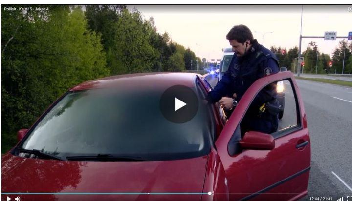
Kuva 2. Ajoneuvon pysäyttäminen. Kausi 5, jaksot 4 Oulu.

Poliisit -sarjassa usein toistuva tapahtuma on ajoneuvon pysäyttäminen. Sarjan esittämä hyvin tyyppillinen tehtävä on jollain tavalla oudosti liikkuvan ajoneuvon pysäyttäminen. Tässä kohtauksessa