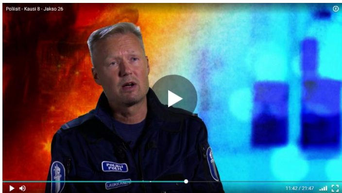
Kuva 1. Tyypillinen puolilähikuva Poliisit -sarjasta, jossa poliisi kertoo jostakin työtehtävän tapahtumista. Kausi 8, jakso 26 Forssa.

Poliisit -sarjassa kuullaan poliisien välistä puhetta sekä poliisien ja asiakkaiden välistä puhetta. Sarjassa poliisit itse toimivat myös kertojina, selostaen ruudussa näkyviä tapahtumia. Nämä kertojaosuudet on kuvattu studiossa niin, että poliisit selostavat ja kertaavat tapahtumia, jotka ruudussa nähdään tai on juuri nähty. He istuvat hieman vinottain taustatoimittajaan nähden, joka ei näy kuvassa. Näissä kertojaosuuksissa poliisit on kuvattu puolilähikuvassa. Kuvissa vuorottelevat poliisit kertojina ja oikeat tapahtumat kaupungeissa.