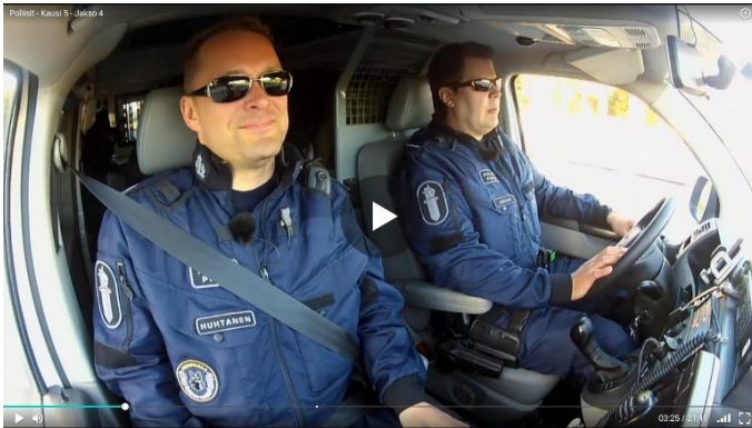
Kuva 1. Poliisit autossa matkalla tehtävälle. Kausi 5, jaksot 4, Oulu.

Whiteheadin mukaan ruumiillisuus ja tila liittyvät erottamattomasti yhteen: miten tilassa liikutaan, istutaan, seistään, kävellään, miten osallistutaan fyysisiin aktiviteetteihin. Poliisit -sarjassa istutaan paljon autossa.