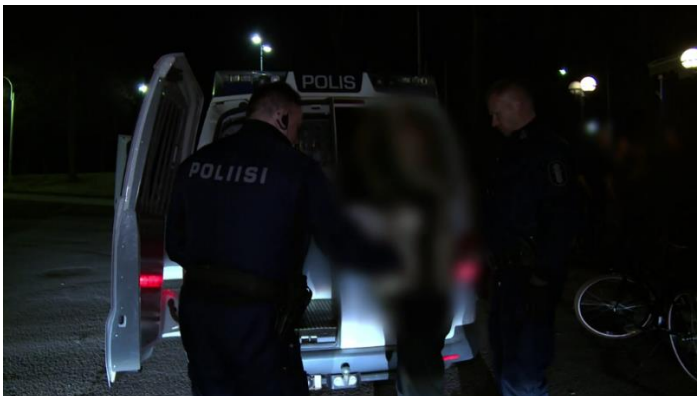
Kuvat 4 ja 5 häiriökäyttäytyminen. Kausi 8, jakso 26 Forssa.

Neljäs ja viides kuva kuvaavat häiriökäyttäytymistä. Poliisit -sarjassa poliisi kutsutaan usein baareissa ja yökerhoissa tapahtuvien häiriökäyttäytymisien vuoksi paikalle. Sarjassa näissä tilanteissa tyypillisesti jututetaan useampaa henkilöä tilan edustalla ja selvitetään mitä on tapahtunut. Tavallisesti jokin asianosaisista lähtee putkaan.