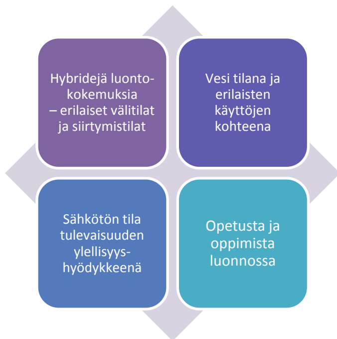
Kuva 3. Esimerkkejä liiketoimintamahdollisuuksien osa-alueista.

Teknologian avulla tuotetaan hybridejä luontokokemuksia ja muokataan erilaisiin siirtymä- ja välitiloihin luontoistettuja paikkoja. Suomalainen luonto tarjoaa mahdollisuuksia tuottaa uusille käyttäjäryhmille, kuten sähkömagneettista säteilyä välttäville, uudentyyppejä palveluja. Veden hyvinvointivaikutuksia hyödyntävien palvelujen kysyntä on kasvanut merkittävästi ja se tuo mukanaan myös turisteja. Luontoon liittyvä oppiminen kiinnostaa niin aikuisia kuin lapsia.