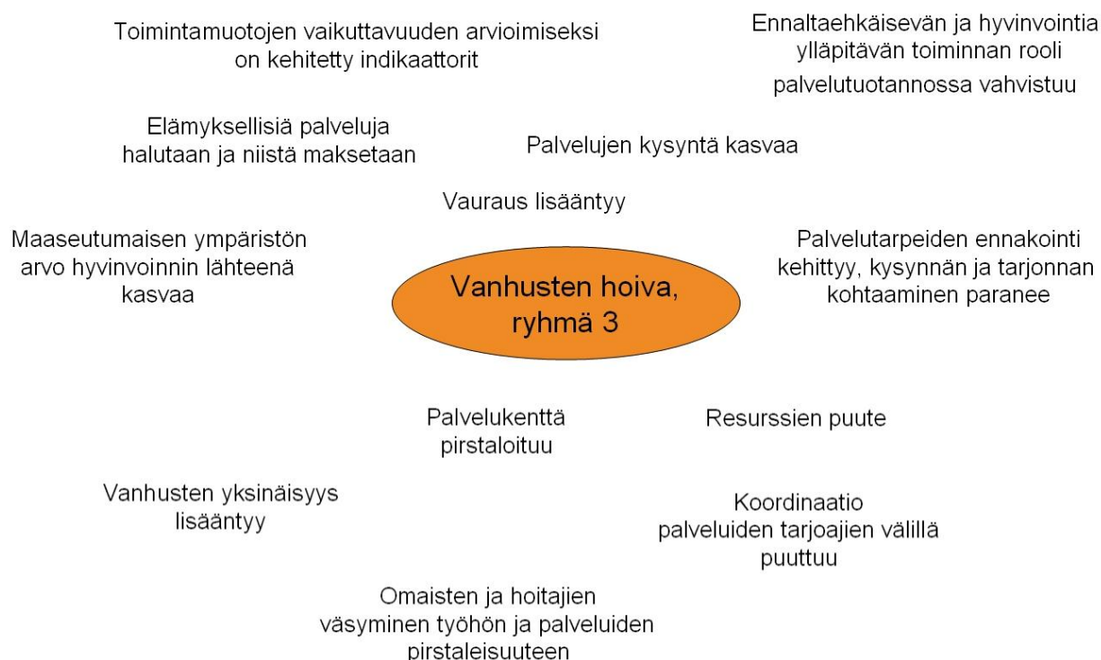
Kaavio 3. Poiminta keskusteluissa esille nousseista tulevaisuusteemoista.

Ennaltaehkäisevän ja hyvinvointia ylläpitävän toiminnan rooli palvelutuotannossa vahvistuu ja sille aletaan antaa enemmän painoarvoa vanhusten hoivapalveluja ohjaavissa hyvinvointipoliittisissa linjauksissa. Myönteistä kehitystä auttaa se, että erilaisten toimintakykyä ja hyvinvointia ylläpitävien toimintamuotojen vaikuttavuuden arvioimiseksi saadaan kehitettyä valtakunnalliset indikaattorit. 24 Ne osoittavat selkeästi ennaltaehkäisevien toimintamuotojen tarjoavan yllättävän lyhyellä aikavälillä säästöjä vähentyneinä sairras- ja lääkekuluina.