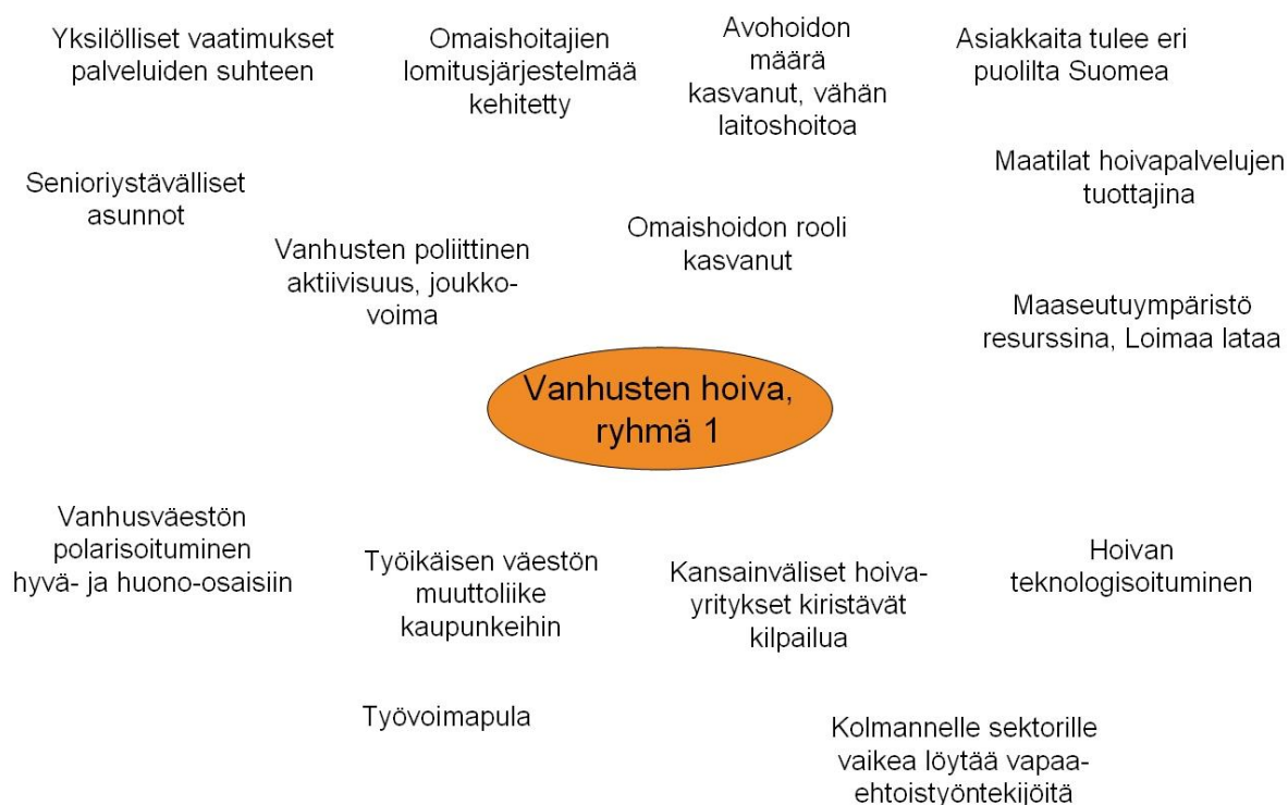
Kaavio 1. Poiminta keskusteluissa esille nousseista tulevaisuusteemoista.

Positiivisia näkemyksiä uhkaavat näkymät, joissa hoivan painotus on inhimillisen sijasta entistä teknologisempi. Hoiva-alan yritysten yhdeksi vahvaksi toimenkuvaksi on tulevaisuudessa kenties muodostunut valvonta ja yleinen turvallisuudesta huolehtiminen. Alalle on keksitty runsaasti uusia teknisiä apuvälineitä ja valvontateknologiaa. Turvallisuuteen investoidaan ja asiakkaiden hyvinvointia voidaan valvoa – mutta lisääntykö asukkaiden turvallisuuden tunne lopultakaan uusien teknologisten ratkaisujen myötä? Jos vähäiset hoivaresurssit laitetaan laiteinvestointeihin, niin millä korvataan vanhusten elämästä puuttuvat ihmiskontaktit? Terveystenhoito kuormittuu inhimillistä kontaktia kaipaavien potilaiden haiketuessa lääkäreiden vastaanotoille ilman varsinaista (fyysistä) terveydellistä syytä.