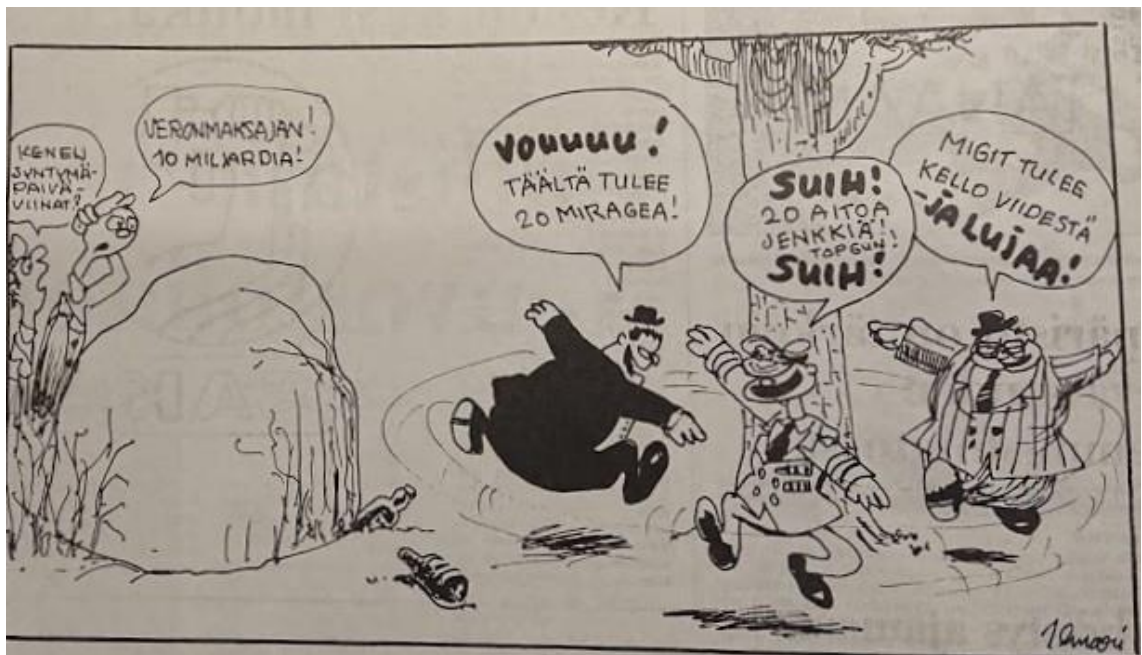
Pilapiirros Kansan Uutisissa 6.3.1990.