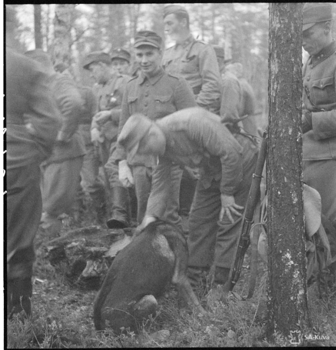
Kuva 1. Savukoski 147 3.9.1943.

vaikka Sotakoiraoppaan ohjeiden mukaan sotakoira sai ruokkia ainoastaan sen ohjaaja kurin ja ystävyysyden ylläpitämisen sekä koiran terveyden vuoksi. 146