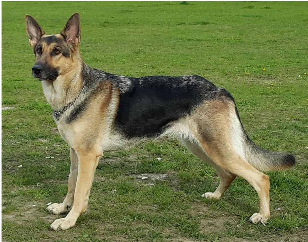
Liite 2. Palveluskoirarotuja.

Käyttölinjainen saksanpaimenkoira.