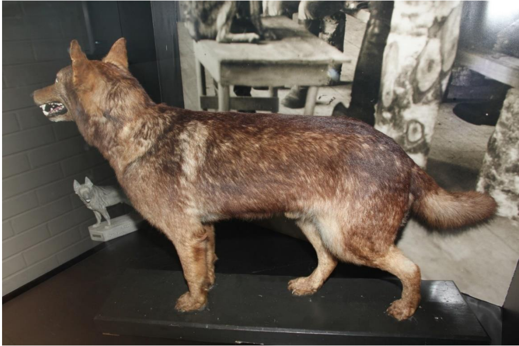
Liite 1. Täytetty rajakoira Caesar Rajamuseossa Imatralla.