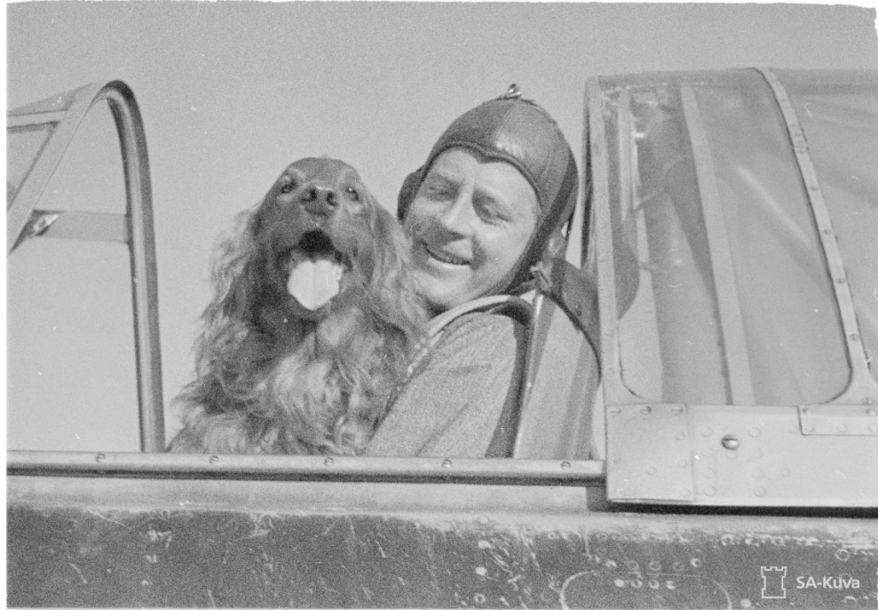
Kuva 5. Hirvas 1.6.1942. 186