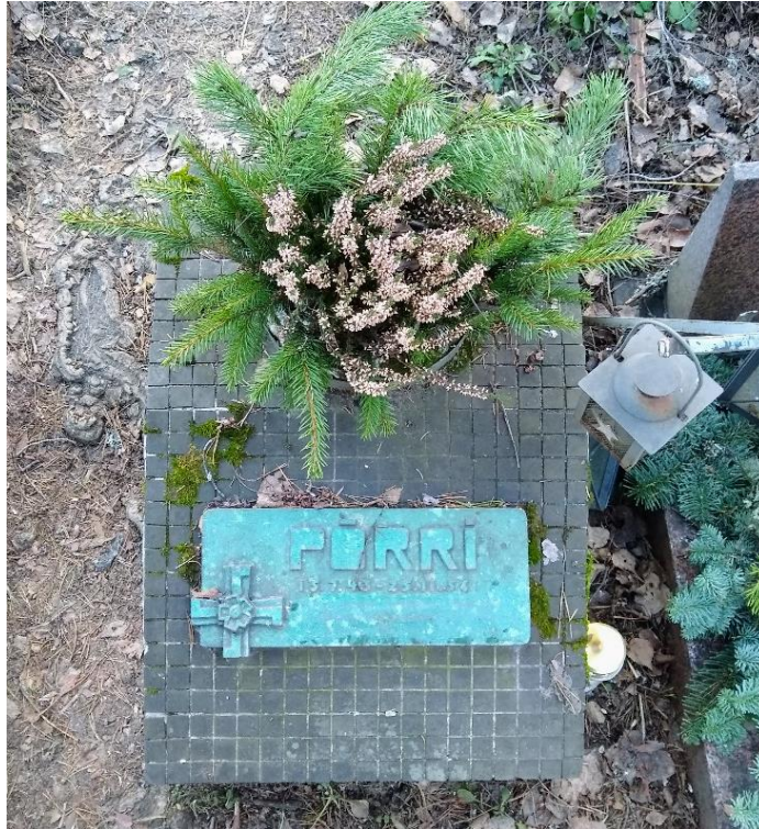
Kuva 11. Sotakoira Pörrin hauta eläinten hautausmaalla Helsingissä 23.1.2020. Tekijän ottama kuva.