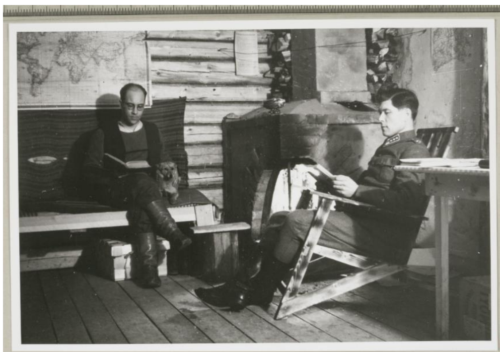
Kuva 6. 28.3.1944.