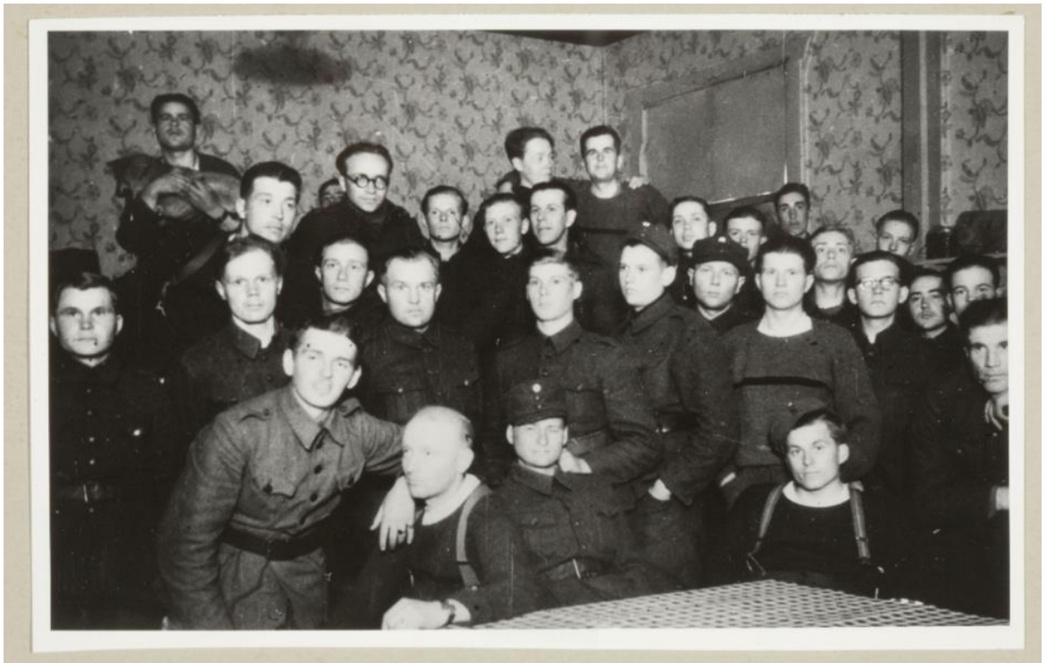
Kuva 8. 20.5.1943.