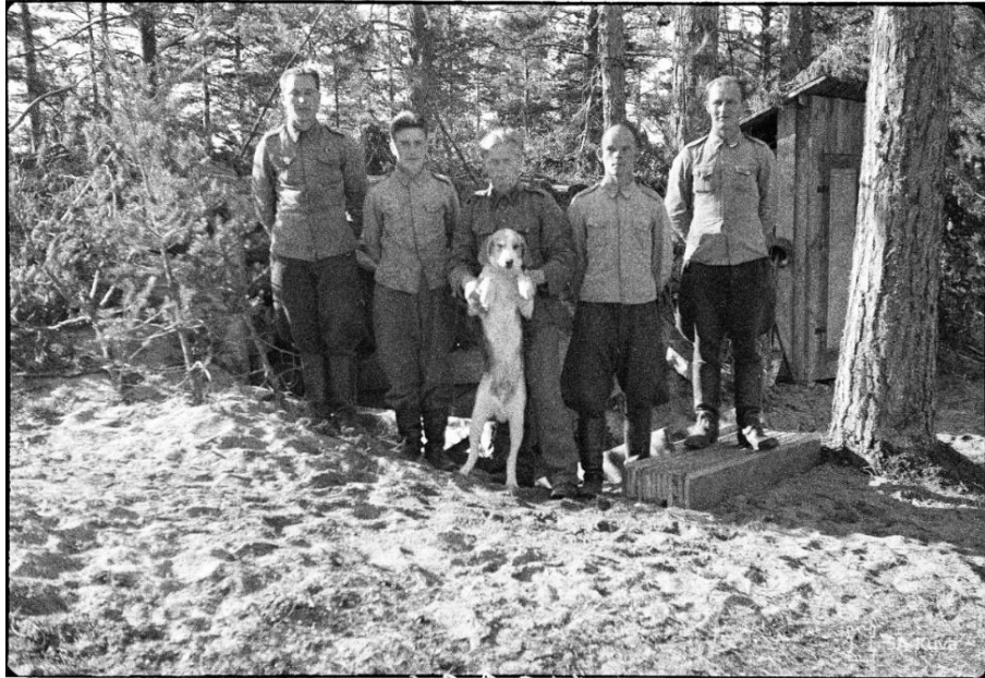
Kuva 2. Konevitsan saari Laatokassa, 20.9.1942.

omistaja olisi ollut koiran ohjaaja. Ehkä siksi aineistossani ei ole tapauksia, joissa koiran omistaja ohjaisi koira rintamalla. Lisäksi koiralle oli todennäköisesti ollut luontevaa ottaa oma paikkansa osana sotilaiden ryhmää, sillä ne ovat laumaeläimiä ja oppivat nopeasti, miten tulla integroiduksi osaksi ihmisjoukkoa. 172