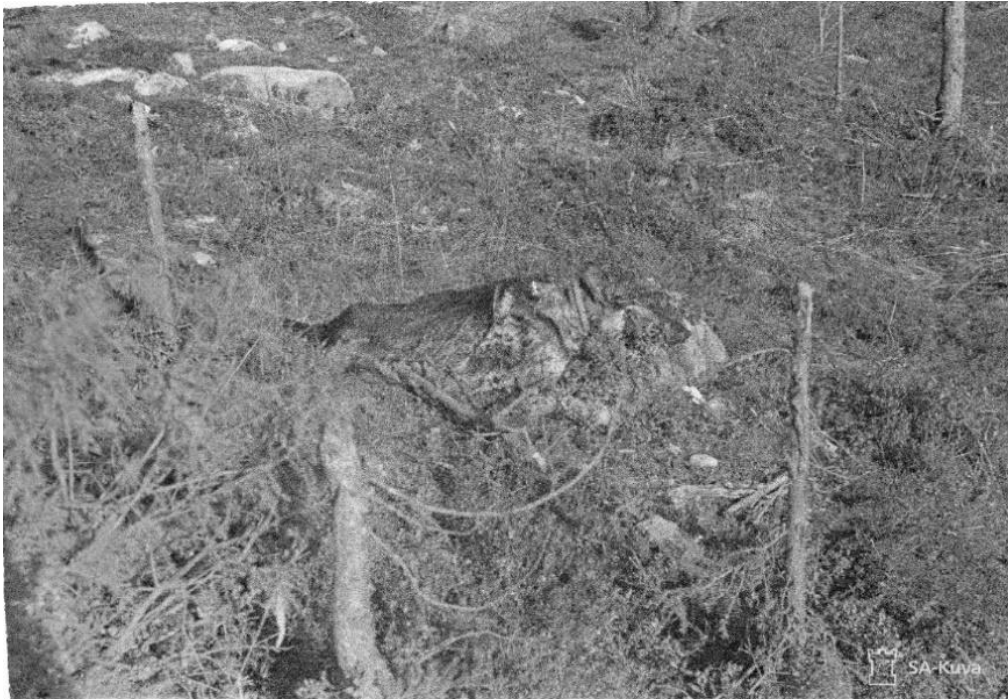
Kuva 10. Alakurtti 9.9.1941.