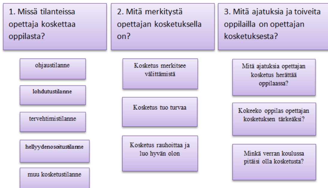
Kuvio 2. Tutkimuskysymykset ja sisällönanalyysin pohjalta muotoutuneet teemoitetut ryhmät.

Kävimme aineiston läpi useaan otteeseen ja etsimme haastatteluista tutkimuksemme kannalta sisällöllisesti merkittäviä vastauksia. Olemme koonneet aineistosta nousseet teemat seuraavaan kuvioon (kuvio 2).