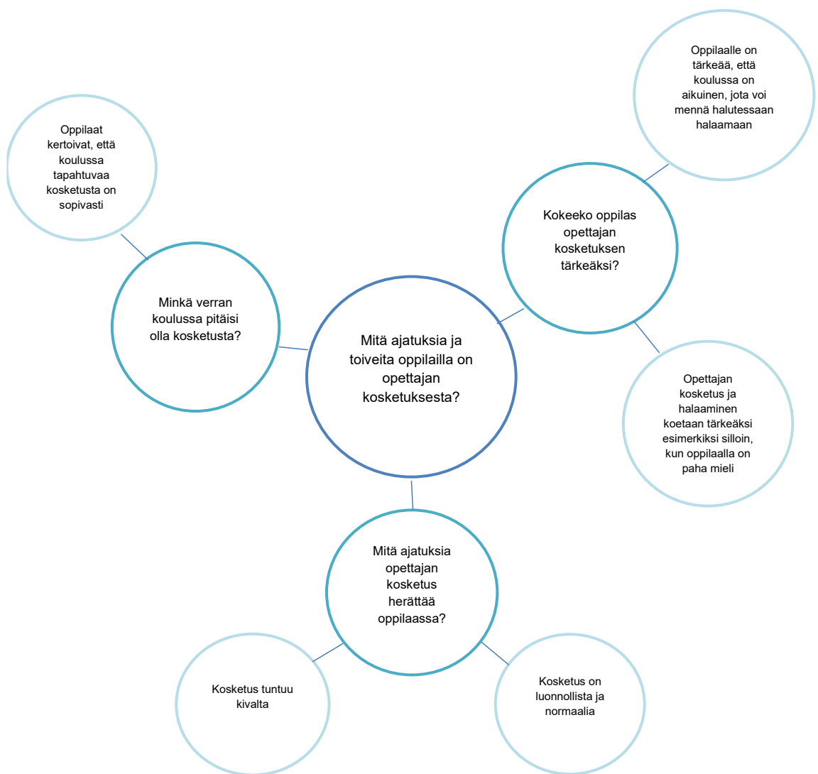
Kuvio 6. Oppilaiden ajatuksia ja toiveita opettajan kosketuksesta.

O7: No ei yleensä...Mun mielestä on ihan mukavaa saada hali ja jotain muuta vastaavaa—