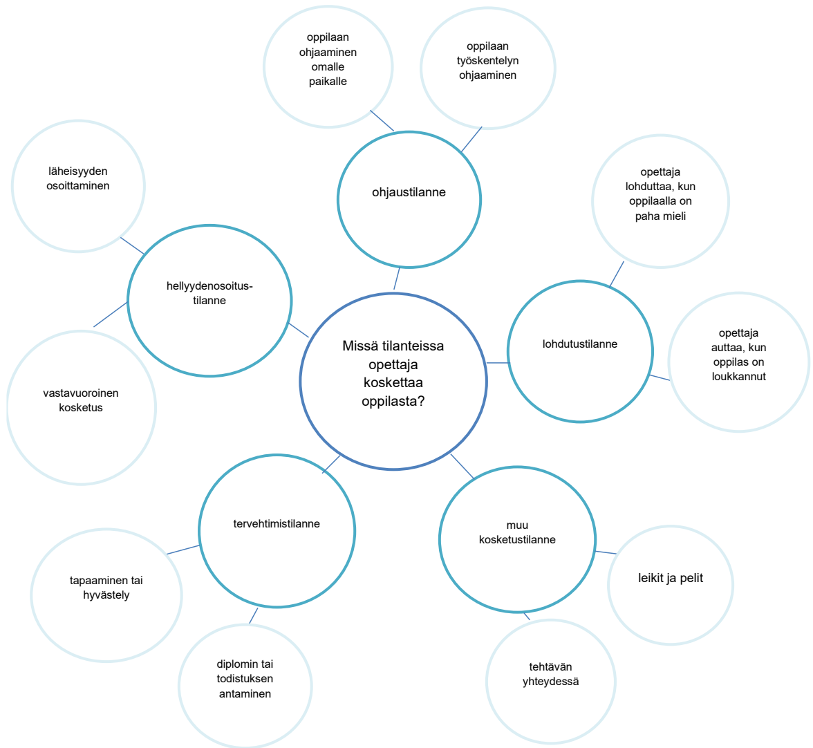
Kuvio 4. Koulussa tapahtuvat opettajan kosketustilanteet.