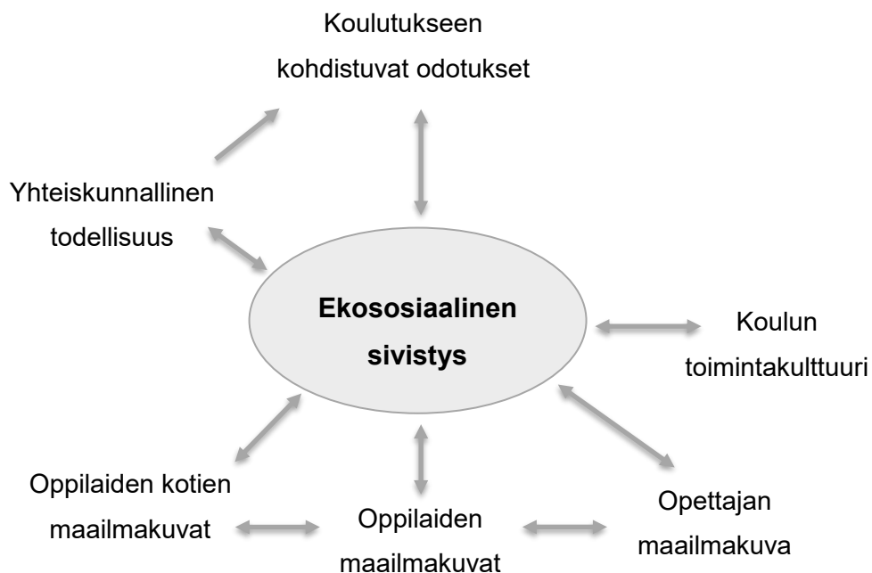
Kuvio 2. Ekososiaaliseen sivistykseen kasvun jännitteet koulutuksessa

(Alkuperäinen Laininen 2018, 31; muokattu kuvio tekijän.)