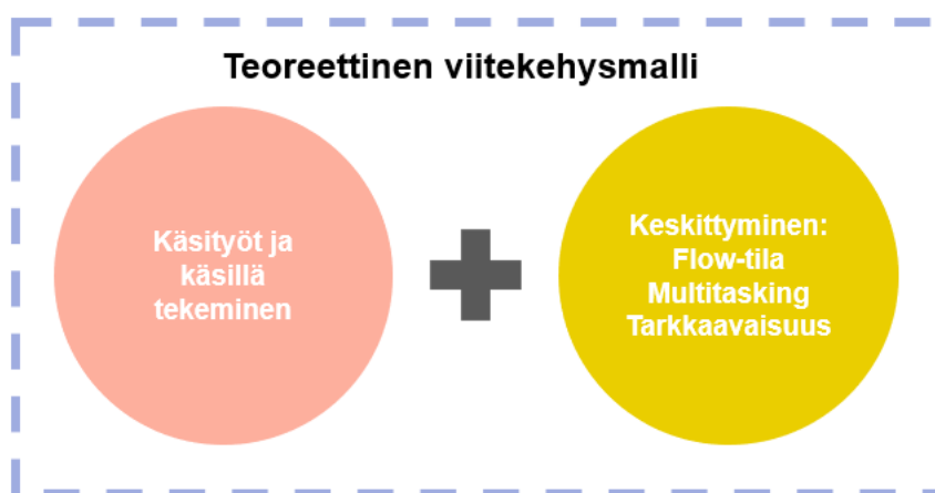
Kuvio 1 Teoreettinen viitekehysmalli

Edellisessä luvussa 2 käsiteltiin tutkielman keskeisimpiä käsitteitä. Seuraavaksi esitellään tutkielman teoreettinen viitekehysmalli, jonka muodostavat tutkielman keskeiset käsitteet. Tutkimukseni teoreettinen viitekehysmalli rakentuu seuraavista käsitteistä ja ilmiöistä (Kuvio 1): käsityöt ja käsillä tekeminen sekä keskittyminen (flow-tila, multitasking, tarkkaavaisuus).