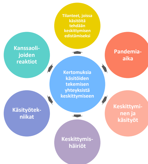
Kuvio 3 Toistuvista teemoista johdetut tulokset

Tutkimuksen aineistosta esiin nousseita teemoja oli kaiken kaikkiaan kuusi kappaletta: tilanteet, joissa käsitöitä tehdään keskittymisen edistämiseksi, pandemia-aika, keskittyminen ja käsityöt, keskittymishäiriöt, käsityötekniikat ja kanssaliijoiden reaktiot. Nämä teemat on koottu seuraavaan kuvioon 3.