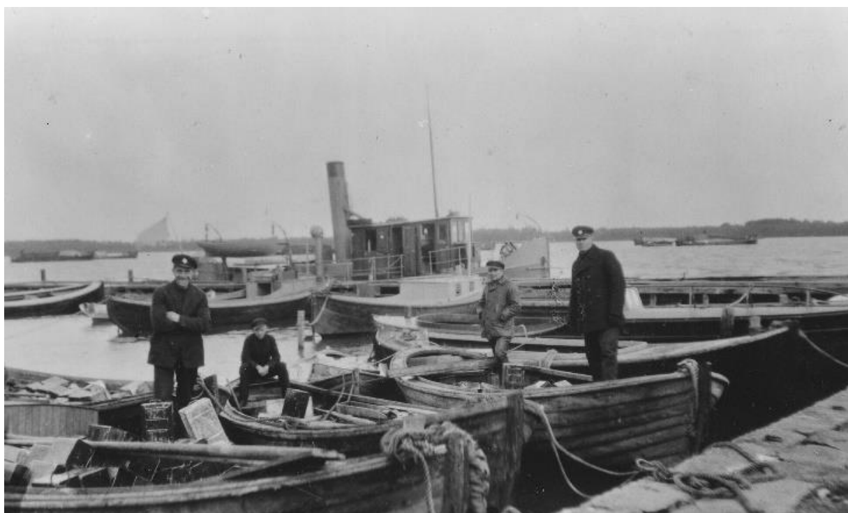
Kuva 8: Kuvassa on vuonna 1929 salakuljettajilta takavarikoituja veneitä, jotka Mäntyluodon tullivartijat ovat saaneet kiinni.

Salakuljetuksesta sai sakkoja tai vankeustuomion. Salakuljettajat menettivät kiinni jäädessään veneensä valtiolle. Veneen menettäminen saattoi olla kovakin paikka, mikäli pääelanto vaati veneen käyttöä. 104 Kuvassa 9 on vuonna 1929 salakuljettajilta takavarikoituja veneitä. Mäntyluodon tullivartijat ovat saaneet kiinni useita pirtun salakuljetusveneitä. Jokaisesta veneestä löytyi noin 200 kpl 10 litraista kanisteria täynnä pirtua. Veneet takavarikoitiin ja kuljetettiin ensin Reposaaressa kauppatatamaan, jossa kyseinen kuva on otettu. Kuvauksen jälkeen veneet hinattiin Mäntyluodon satamaan, johon oli tilattu junavaunu. Pirtut siirtyivät vaunun kautta valtion varastoon. Veneet siirtyivät myös valtion omistukseen, josta ne huutokaupattiin. Ostaja oli usein veneen entinen omistaja, mikäli varat riittivät. Veneitä huusivat trokarit eli veneet olivat eräänlaisessa jatkuvassa kiertäessä. Kuvassa vasemmalla hymyilee leveästi tullivartija ja taka-alalla näkyy tullilaiva Pori. 105