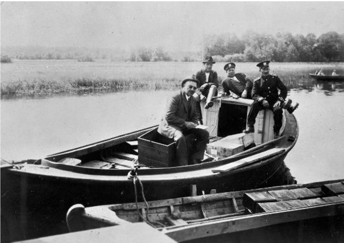
Kuva 10: Kuvassa on Pirtumoottorivene Ahlaisissa 107 . Pirtumoottorivene on todennäköisesti edessä oleva pienempi vene, joka on köydellä kiinni toiseen veneeseen ja mahdollisesti hinattu rantaan. Veneessä näkyy pirtukanistereita. Isompi vene saattaisi olla tullin vene. Takana olevat miehet ovat rennon tyytyväisinä. He