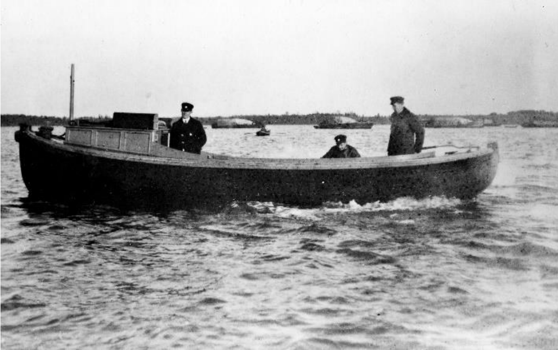
Kuva 9: Tullilaitos vastasi kieltolain valvonnasta merellä. Kuvassa on Mäntyluodon tullivartijoiden moottorivene ja vartio vuonna 1929 106 . Mäntyluodon satama oli vilkas liikenteinen kauppapaikka ja tarkastettavia veneitä oli paljon.