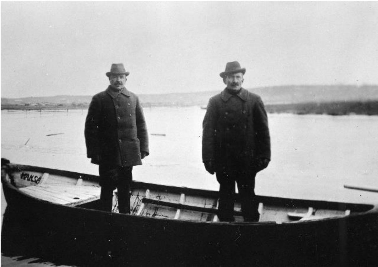
Kuva 7: Kuvan miehet ovat lähdössä Ahlaisissa pirtujahtiin 100 . Pirtutrokareiden kiinnisaanti oli monella tapaa vaivalloista. Trokarit liikkuvat useimmiten pimeällä, öisin ja merellä, joka oli laaja ja vaikeasti vartioitava alue. Osa järjestäytyneistä rikollisista oli aseistettuja ja jopa epätoivoisia. Ammattitrokareiden veneet olivat nopeita ja välineistö aina hieman edellä tullia ja poliisia. Trokareita saattoi olla öisin suuria määriä ulkolaisten alusten luona.

1920-luvun lopussa alkoi muutaman vuoden kestävä pirtusota, jossa salakuljettajat kilpailivat kasvaneista pirtumarkkinoista 101 . Kilpailu kehitti salakuljettajien taktiikoita. Poliisit ja tulli alkoivat tutkia veneitä pohjiaan myöten salakuljettajien kiinnisaamiseksi. Tällöin ammattitrokarit alkoivat käyttää pirtutorpedoita . Torpedo koostui metallikehikosta ja pyramidinmallisesta vedenhalkojasta. Pirtukanisterit lastattiin kehikkoon ja torpedoa vedettiin vedenhalkojaan kiinnitetystä vaijerista veneen perässä veden alla. Aluksi, kun uusi salakuljetusväline ei ollut vielä tullimiesten tiedossa, voitiin tarkastuksissa esitellä tyhjää venettä. Veneiden tarkastusta tehostettiin entisestään, jolloin salakuljettajat alkoivat hylätä torpedoita mereen. Salakuljettajat palasivat myöhemmin nostamaan pudotettuja torpedoja merestä, mikäli sen sijainti oli tarkasti mielessä. Useimmiten pudotettu lasti menetettiin. Tämän välttämiseksi torpedoihin alettiin kiinnittää koho ja suola- tai sokeripussi. Pohjassa maanneen torpedon sijainti saatiin selville, kun koho nousi pintaan painona toimineen