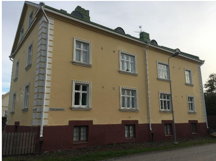
Kuva 4 ja Kuva 5: Kuvassa 4 on Jaakko Laaksovirran suunnittelema Antinkatu 33 ja 35, joka valmistui vuonna 1939. Kuvassa 5 on Reposaaressa Pursimiehenkadulla sijaitseva kolmikerroksinen kivitaloa. Kuva 4 finna.fi ja kuva 5 Milla Hautaoja.