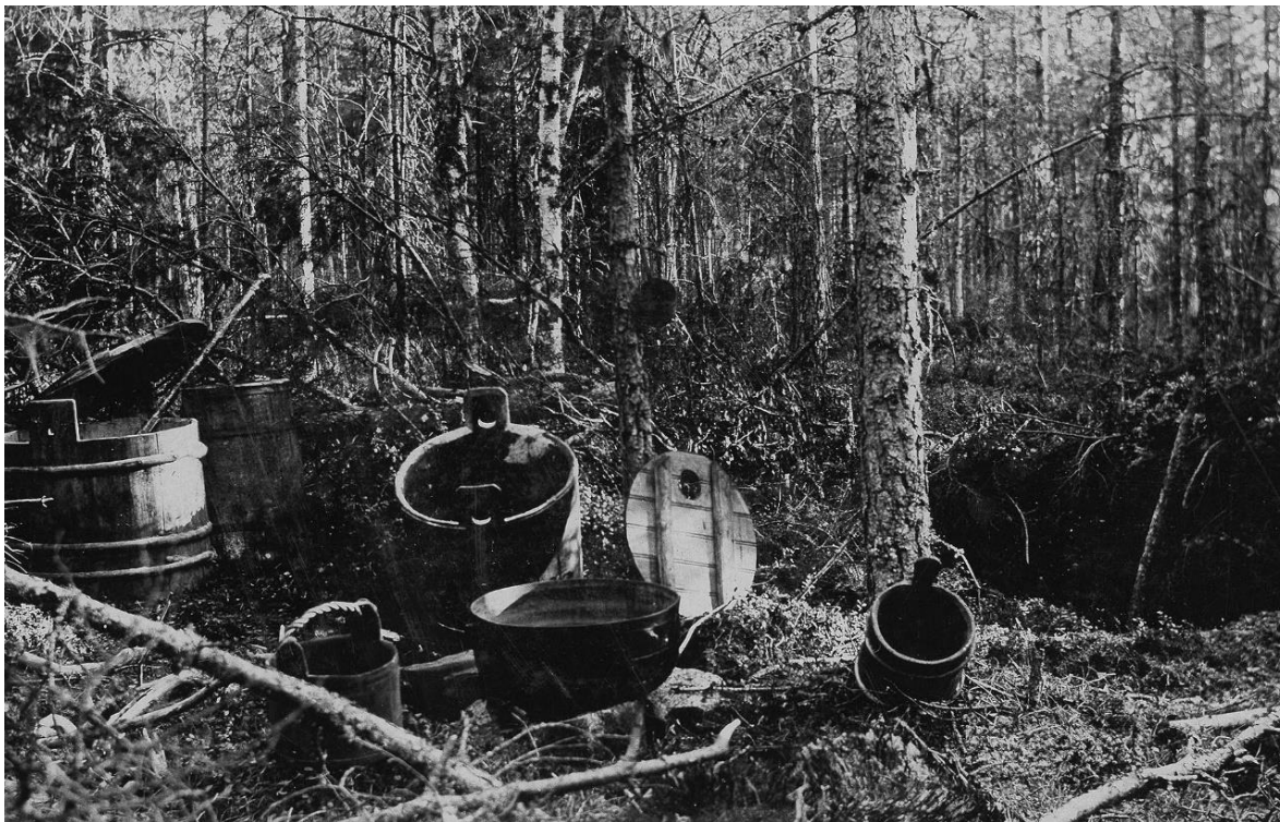
Kuva 6: Kuvassa on salapolttimo kieltolain aikana Kokemäellä 72 . Kuvassa näkyy puutynnyreitä, joissa on valmistettua mäskiä ja annettu seoksen käydä. Kuvassa keskellä on pata, jossa pontikka on keitetty.

Poliisit toivat kuulusteltavaksi Porin etsivään osastoon porilaisen 37-vuotiaan peltisepän. Mies löydettiin kaupustelemasta kahta viinapannun piippua Antinkadulla talossa numero 10 sijaitsevassa Enlund & Ström väkihuoneessa. Mies työskenteli Porissa Vähälinnankadulla sijainneessa Tähtisen peltisepäniikkeessä. Hän kertoi peltisepäniikkeeseen saapuneen asiakkaan, joka oli tilannut kaksi viinapannun piippua luvaten maksaa niistä 50 markkaa. Peltiseppä valmisti piiput liikkeessä, mutta asiakas ei ollut hakenut niitä. Niinpä mies oli päättänyt mennä myymään piippuja 10 markalla markkinaväelle väkihuoneelle mutta kukaan ei ollut halukas ostamaan niitä. 73 Enlund & Ström oli matala, kivinen liikerakennus pohjoiskauppatorilla, jossa oli pieniä liiketiloja 74 . Väkihuone-nimelle ei löytynyt mainintoja. Sillä saatettiin viitata liikerakennuksen jonkinlaiseen yleiseen tilaan. Paikalla oli markkinakansaa, joten tilassa on voinut olla jokin markkinatapahtuma. Viinan keitto vaati aina myös keittokaluston hankinnan ja myös keittokaluston valmistus oli rikos. Porissa työskenteli kieltolain aikana myös paljon eri alojen käsityöläisiä, kuten tynnyrintekijöitä 75 .