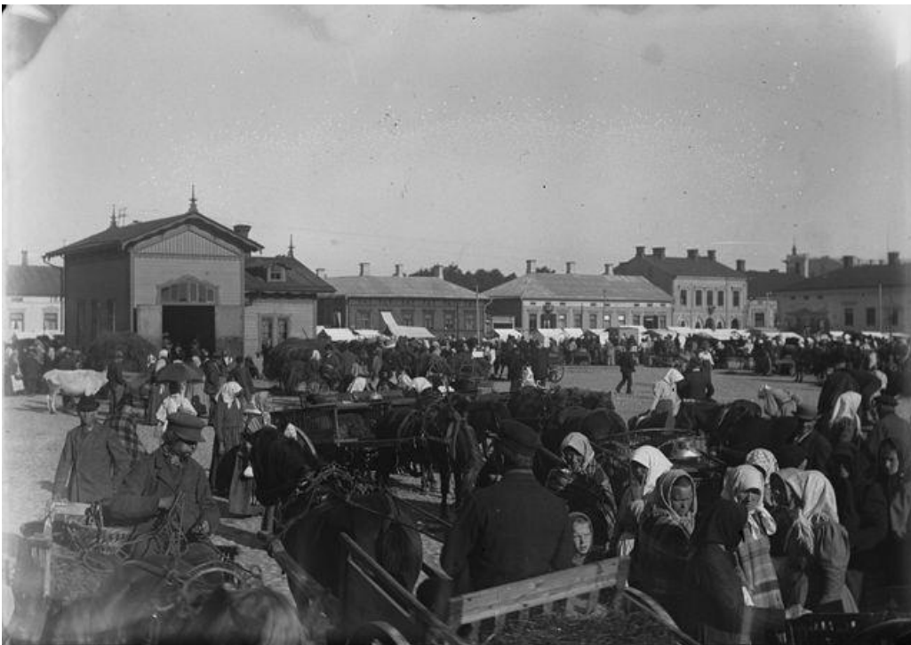
Kuva 15: Kuvassa on Porin kauppatorin vilskettä ja taustalla torikaupan keskus Vaakahuone, joka oli keskeinen kauppapaikka torilla vuosina 1895-1954 157.

Porin kauppatorilla sijannut Vaakahuone oli keskeinen kauppapaikka torilla vuosina 1895-1954 154 . Hirsirakenteinen Vaakahuone toimi torikaupan keskuksena. Se rakennettiin vuonna 1895 Eteläkauppatori 4:n edustalle. Tällöin Porin torilla aloitettiin myös myynnissä olevan maidon ja lihan tarkastus, jonka suoritti kaupungin eläinlääkäri. Vaakahuoneella punnittiin myös myytävät heinät rakennuksen keskellä sijaitsevassa lattiavaa'assa. Tästä syystä huone oli läpikuljettava. Vaakahuoneen rinnalla oli maksullinen käymälä, jota kutsuttiin panssarikahvilaksi. 155 Sen imago oli huono niin rapistuneen kuntosaa, maineensa kuin myös hajunsa vuoksi. Vaakahuone houkutteli puoleensa merkittävän paljon pikkurikollisia. Tiedetään vaakahuoneen nurkilta löytyneen iltaisin myös maksullista rakkautta. Rakennuksen nurkilla kävi kauppa yötä päivää. 156 Lehdistä löytyy kirjoituksia siitä, miten vaakahuone toimi pimeän viinan myyntipaikkana. Porin kauppatori toimi myös viinanmyyntipaikkana ja torikauppiat osoittautuivat monissa poliisin kirjaamissa tapauksissa viinan myyjiksi. Kuvassa 15 on Vaakahuone torikaupan keskuksena.