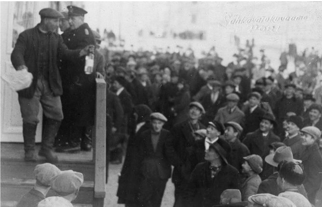
Kuva 3: Kuvassa Alkoholiliike Lipsanen Oy:n ovesta poistuu ensimmäinen asiakas. 51 Alkoholiliikkeen ympärillä olevat ihmiset näyttävät iloisilta ja nauravat. Tunnelma vaikuttaa leppoisalta. Liikkeestä poistuva asiakas näyttää ostamaansa viinapulloa yleisölle.