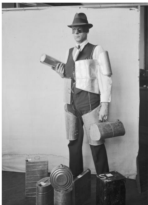
Kuva 13: Kuvassa on tohtori C.A. Nordman vuonna 1925. Nordman esittelee spriikanistereiden käyttöä salakuljetuksessa ja havainnollistaa muun muassa reisi- ja käsivarsikanistereiden käyttöä 123 . Salakuljettajat saattoivat ommella myös vaatteisiinsa salataskuja pirtuflaskojen kuljetusta varten 124 .

Näissä kahdessa edellä esittelemässäni tapauksessa voidaan päätellä henkilöiden ammattinimikkeiden perusteella heidän kuuluvan joko varakkaampaan tai köyhempään väestöön. Ensimmäisessä tapauksessa työmies myy viinaa Hotellin ovenvartijalle, kun taas toisessa talonomistajan tytär myy keittäjälle. Eri yhteiskuntaluokat, sukupuolet ja ikäryhmät olivat edustettuina laittoman viinan välittämisessä. Köyhille viinan myynti oli mahdollisuus parempaan toimentuloon. Mäntyluodon sataman lähellä asuville ihmisille tai satamassa työskenteleville tämä oli jopa luontevaa. Molemmissa tapauksissa viinan hankkija tekee kertomuksensa mukaan satunnaisen palveluksen vieraalle ihmiselle, joka on viinaa vailla.