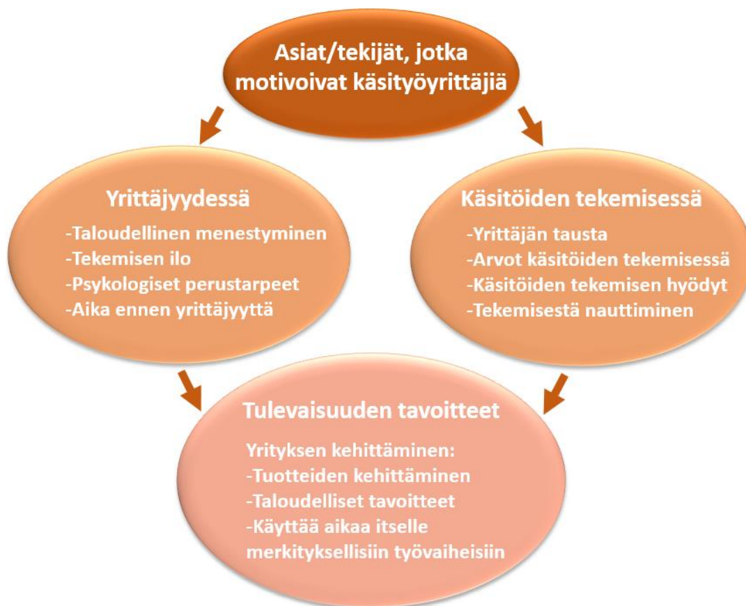
Kuvio 3 Tutkimustulokset

Kuviossa 3 esitellään tutkimustulosten yhteenveto. Tutkimuksen tehtävänä oli selvittää asioita ja tekijöitä, jotka motivoivat käsityöyrittäjiä yrittäjyydessä ja käsitöiden tekemisessä. Lisäksi selvitettiin, millaisia tavoitteita yrittäjät olivat asettaneet tulevaisuudelle.