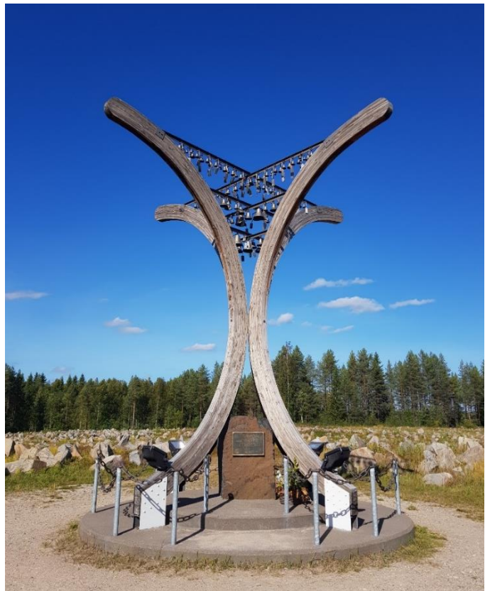
Kuva 2. Talvisodan monumentti sijaitsee Raatteentiellä.

Nykyisten rajaviivojen lisäksi entiset rajat ja rajamuistomerkit ovat tärkeitä nähtävyyksiä. Kainuun pohjoisessa kunnassa, Suomussalmella, Raatteentiellä sijaitsee Talvisodan monumentti, joka on rakennettu Suomussalmen taisteluissa vuosina 1939–1940 kaatuneiden sotilaiden muistolle (Talvisodan monumentti 2019). Monumentti on kenttä, jota reunustaa tykistön runtelema metsä ja sen keskellä on muistomerkki, Avara syli, jossa on 105 vaskikelloa (kuva 2). Luku 105 kuvastaa talvisodan päiviä. Monumentti on levittäytynyt kolmen hehtaarin alueelle ja siihen kuuluu noin 17 000 kivenlohkareta. Kivillä visualisoidaan uhrien määrää, joka on jouduttu arvioimaan, sillä puna-armeijan kaatuneiden tarkkaa määrää ei tiedetä.