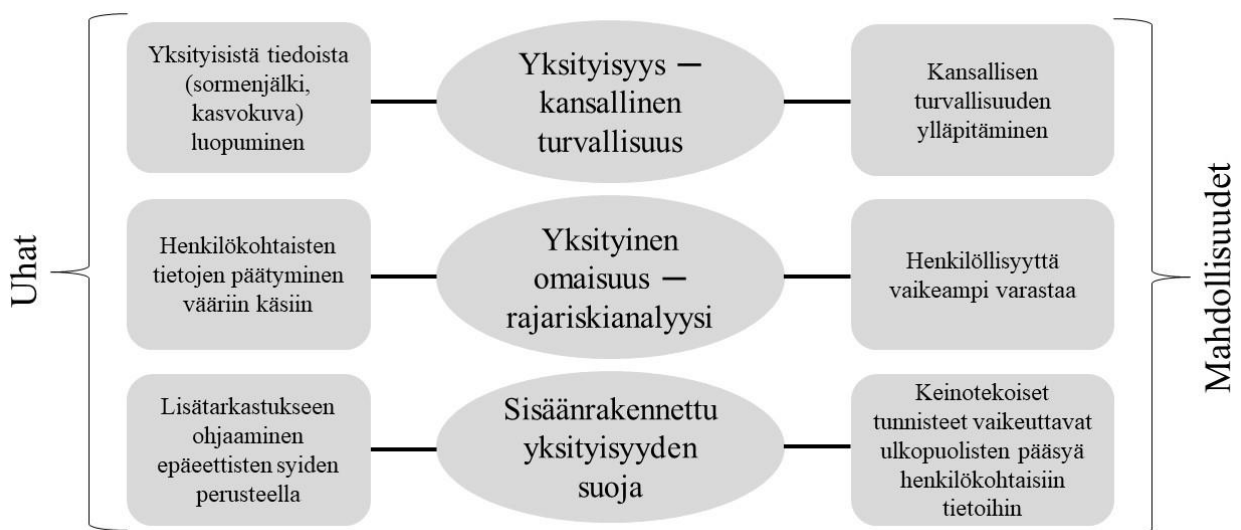
Kuva 4. Yksityisyyden ja teknologian välinen suhde sisältää sekä uhkia että mahdollisuuksia.

Abomharan ym. (2019: 260) mukaan yksityisyyttä voidaan tarkastella kolmesta näkökulmasta, jotka ovat yksityisyyden ja kansallisen turvallisuuden ristiriita, yksityisen omaisuuden ja rajariskianalyysin ristiriita sekä sisäänrakennettu yksityisyyden suoja (kuva 4).