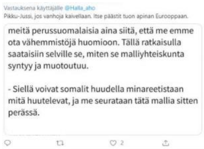
Kuva 4. Yksi esimerkki vastauksesta Jussi Halla-Aholle.

miten viesti voi muuttua alkuperäisestä lähteestä käsittelemään jotain aivan muuta, kuten Halla-Ahon twiitin kommentteista on nähtävissä: