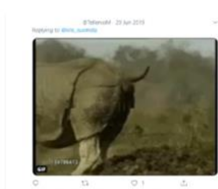
Kuva 5. Vasemmalla alkuperäinen twiitti ja oikealla käyttäjän vastaus.