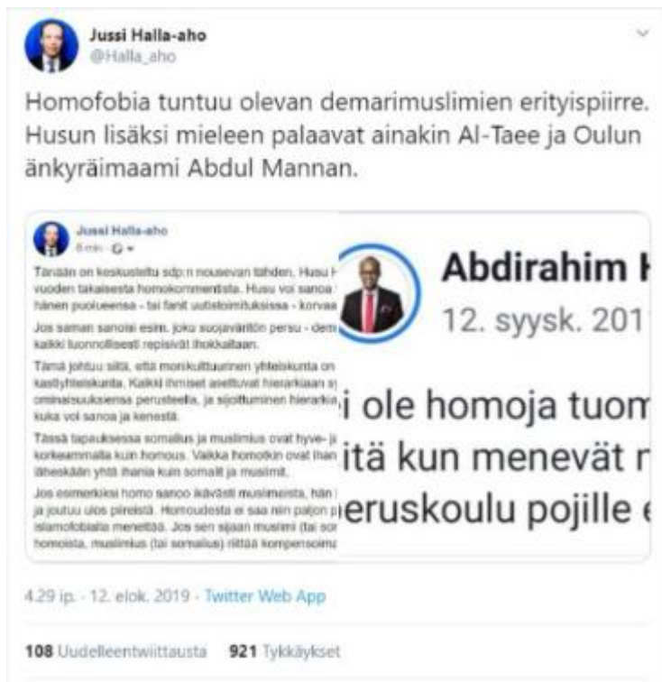
Kuva 2. Jussi Halla-Ahon twiitti elokuulta 2019

Halla-Ahon twiittiä värikkäästi kommentoineet henkilöt kirjoittivat Mies 1:n mukaan negatiivisia viestejä, koska ne kuvaavatt alkuperäisen viestin persoonaa. Sarja mainitsee, kuinka joukossa tyhmyys tiivistyy, ja ryhmässä mielipiteet kärjistyvät entistä enemmän (Sarja 2007, 206). Tietyt julkisuuden henkilöt ja heidän julkisuudessa esittämänsä kommentit voivat toimia sanansaattajina, joiden mallin mukaisesti seuraajat voivat toimia. Mies 1 näkee Halla-Ahon twiitin kommentit alkuperäisen viestin tapailuna, minkä voi nähdä kuvasta 4, kuinka yksi kommentoija on halunnut toimia hieman radikaalimmin kuin Halla-Aho itse nostamalla esiin tämän aikaisemmat twiitit ja tällä tavoin yrittämällä kärjistä omaa mielipidettään vielä enemmän. Jotta ymmärtäisi ja voisi tulkita mediaa esimerkiksi yleisten käytäntöjen, suunnittelun ominaisuuksien ja retoristen välineiden avulla, tulisi syntyä kyky luoda ja kommunikoida mediaa (Buckingham 2007, 44). Kuvassa 4 tapahtuva Halla-Ahon yläpuolelle nousun yritys, kärjistyminen, on tapa tehdä viesti toisen henkilön alaisuudessa. Mies 1 näkee Halla-Ahon aloituksen negatiivisena, jolloin vaikutus näkyy välittömästi muissa kommenteissa, kuten kuva 4 osoittaa. Sarja mainitsee, kuinka ihmisillä on tarve saada suosiota mielipiteilleen ja kuinka toimimalla radikaalimmin saisimme suurempaa suosiota (Sarja 2007, 206).