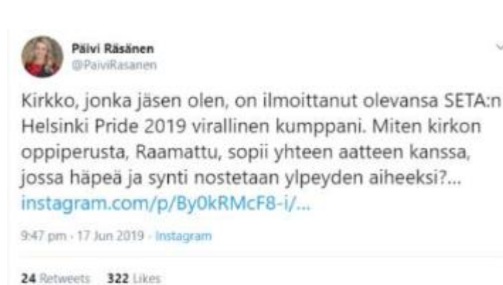
Kuva 3. Päivi Räsäsen twiitti kesäkuulta 2019.

Mies 1 kiinnitti huomiota ennakkomateriaaleissa siihen, miten hän piti Päivi Räsäsen twiittiin liittyneistä kommentteista, etenkin verrattuna Halla-Ahon twiittiin. Erityishuomiota herättää Halla-Ahon twiitti, koska hän nostaa siinä esille homofobian demarimuslimien joukossa. Halla-Aho on itse toiminut homofobisesti sosiaalisessa mediassa, joten hänen twiittinsä on itsessään mielenkiintoinen. Huomiota herättää myös se, että Halla-Ahon twiitin kommentit ovat itsessään homofobisia ja rasistisia kirjoituksia, jotka eivät ainakaan anna Perussuomalaisista ”positiivista” kuvaa muille kuin heidän kannattajilleen.