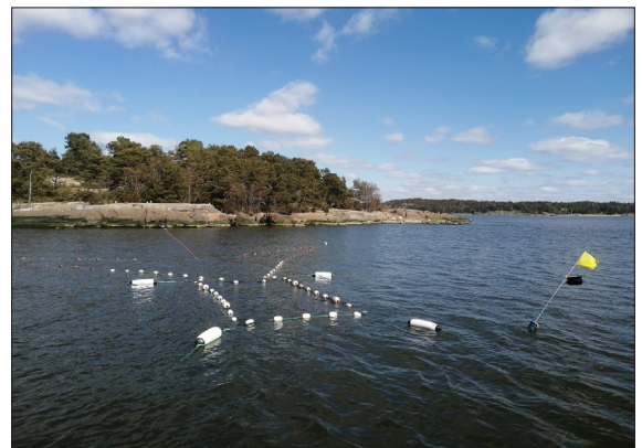
Jotain kuitenkin saadaan tehtyäkin. Viime vuonna hankkimamme silakkarysä laskettiin jälleen Airistolle aurinkoisessa säässä 19.4.