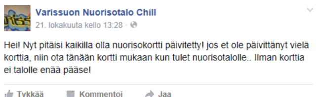
Kuva 5. Nuorisokortti on Turussa edellytys nuorisotaloilla käymiselle (21.10.2015). 41

Kesällä ja syksyllä 2015 keskustelin nuoriso-ohjaajien kanssa nuorisokortin vastaanotosta nuorten keskuudessa ja tuntuma oli, että nuorisokortti on otettu vastaan Turussa hyvin. Myös saamieni kyselyvastausten mukaan nuorten käymättömyys johtui muista seikoista (ks. yllä). En kuitenkaan kysynyt juuri tätä asiaa erikseen. Vaatimus jäsenkortin hankkimisesta voi olla kynnyksikysymys sellaiselle nuorelle, joka ei halua liittyä jäseneksi tai antaa tietojaan. Nuorten yleinen suhtautuminen jäsenyyksiin on vuonna 2013 ilmestyneen vapaa-aikatutkimuksen 27 mukaan kielteistä: 10–29-vuotiaista jopa 72 prosenttia oli sitä mieltä, että ”toimintaan on mukava osallistua, jos ei tarvitse liittyä jäseneksi