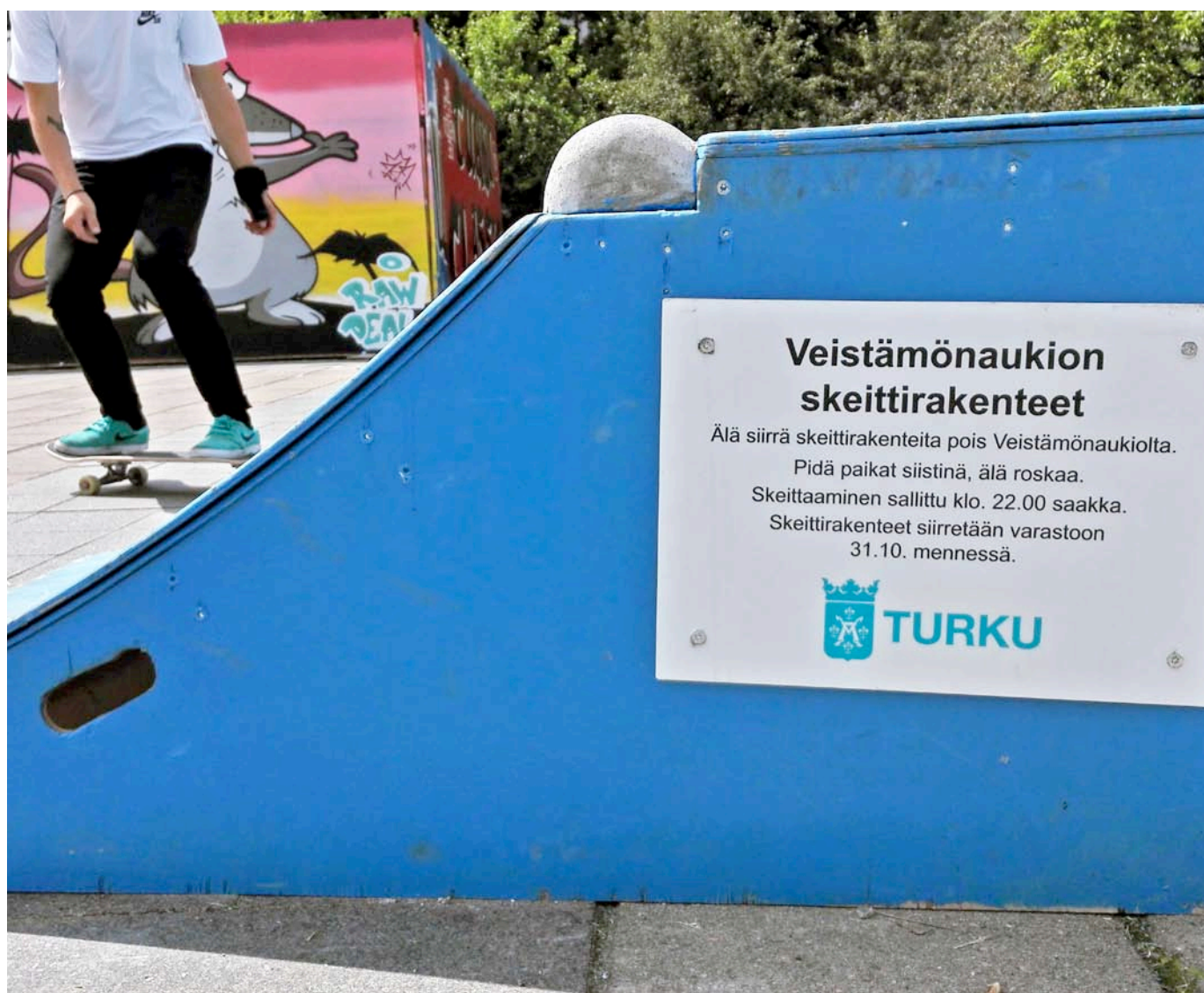
Kuva 1. Veistämönaukiolla oli kaupungin skeittirampeja ja graffitiseinä.

teekin syvennyksessä he osallistuvat ”neuvotteluun” tiukoista ja väljistä tiloista, ja voivat mahdollisesti muuttaa näiden tilojen luonnetta. 4 Vaikka nuorten tavat käyttää kaupunkia voivat karkottaa muita tilan käyttäjiä, nuorten luovat tavat käyttää tiloja myös avaavat uusia näkökulmia siihen, mitä kaupungissa saa tehdä. Sirpa Tanin mukaan etenkin tiloista, joissa yksityisen ja julkisen rajat hämärtyvät, on mahdollista nuorten toiminnan myötä syntyä väljiä tiloja silloin, kun erilaisia käyttöjä siedetään tai tuetaan. 4,13 Tiloja haastavat käyttäjät ja käyttötavat voivat luoda uusia standardeja sille, millainen toiminta kaupunkitilassa on hyväksyttävää. 7 Uskoakseni nuoret voivat totunnaisia sääntöjä ja normeja kyseenalaistamalla luoda myös uusia standardeja sille, millaiset olemisen tavat hyväksytään osaksi kaupunkikuvaa ja -elämää.