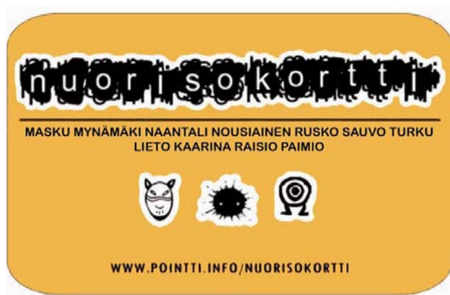
Kuva 3. Tampereen kaupungin klubikortti nuorille vuonna 2013–2014 ja Turun seudun nuorisokortti 2016. 37,40