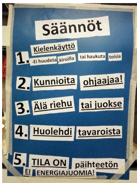
Kuva 6. Varissuon nuorisotilan säännöt päivitettiin talopalaverissa lokakuussa 2015.

Turussa muun muassa Vimman nuorisotila ja Hansa-ostoskeskuksessa tehdyt tuoreet kokeilut kaikille nuorille avoimista pop up -tiloista sekä syksyllä Hesburgerin vanhoihin tiloihin avattu pysyvä nuorten tila ovat hyvä esimerkki päivävästaisesta ajattelusta – nuorisotila on sijoitettu ydinkeskustaan aivan keskeisten toimintojen äärelle sinne, missä nuoret muutenkin viettävät aikaansa. Käyttäjämäärät olivat suuret ostoskeskukseen kesällä 2016 sijoitetussa pop up -tilassa, ja tilasta tehtiin pysyvä nuorten toiveesta. 42,43 Toisaalta suuri osa nuorisotiloista Turussa sijaitsee oikeutetusti nimenomaan asuinalueilla, joille ne on tehty tukemaan paikallisten nuorten vapaa-ajanviettomahdollisuuksia lähellä omaa koulua ja kotia.