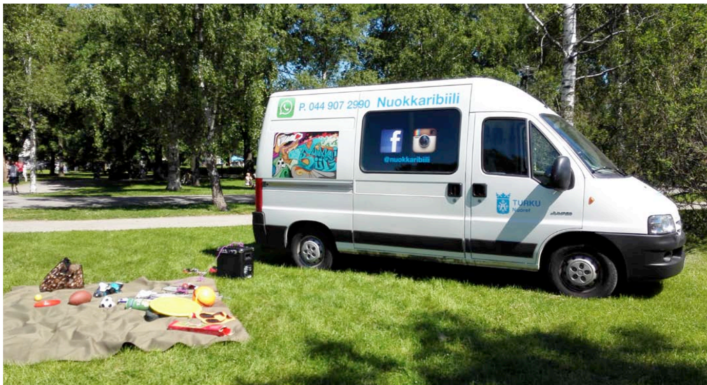
Kuva 2. Nuokkaribiili Kupittaaan puistossa.