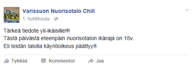
Kuva 4. Varissuon nuorisotalon Facebook-sivulla ilmoitettiin tiukentuneista ikärajoista (21.10.2015). 41