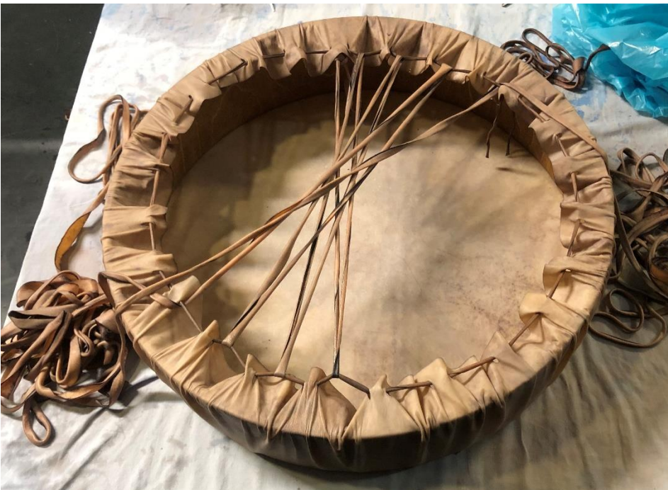
Kuva 2. Rumpu syntyy: kalvo voidaan kiinnittää puiseen kehään esimerkiksi vuodasta leikatulla nahkanyörillä punomalla. Vuodan ollessa märkä kalvo saadaan pingotettua tiukasti kehikon päälle, johon se kiristyy kuivuuessaan.

Puhdistautumisrituaalissa kurssin vetäjä kiersi kaikki osallistujat salvian savulla suitsuttaen, ja hiljennyimme hetkeksi asettamaan intentioita ja toiveita kurssille sekä tuleville rummuillemme.