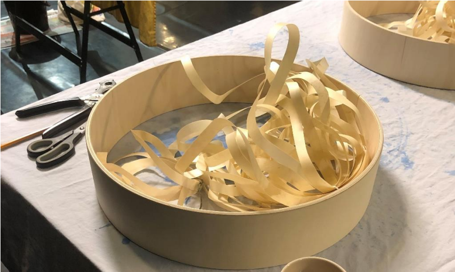
Kuva 1. Rakennusprosessi käynnistyy. Kuvassa rummun puinen kehä ja nahasta leikattuja suikaleita.

Kun tarkastelen omaa kokemustani rummunrakennuskurssilta, olosuhteet ja tunnelma jossa rummut rakennettiin oli erityinen: ei ollut kyse mistä tahansa käsityöhetkestä, vaan osallistujien piti esimerkiksi ottaa osaa puhdistautumisrituaaliin ennen rakentamisen aloittamista.