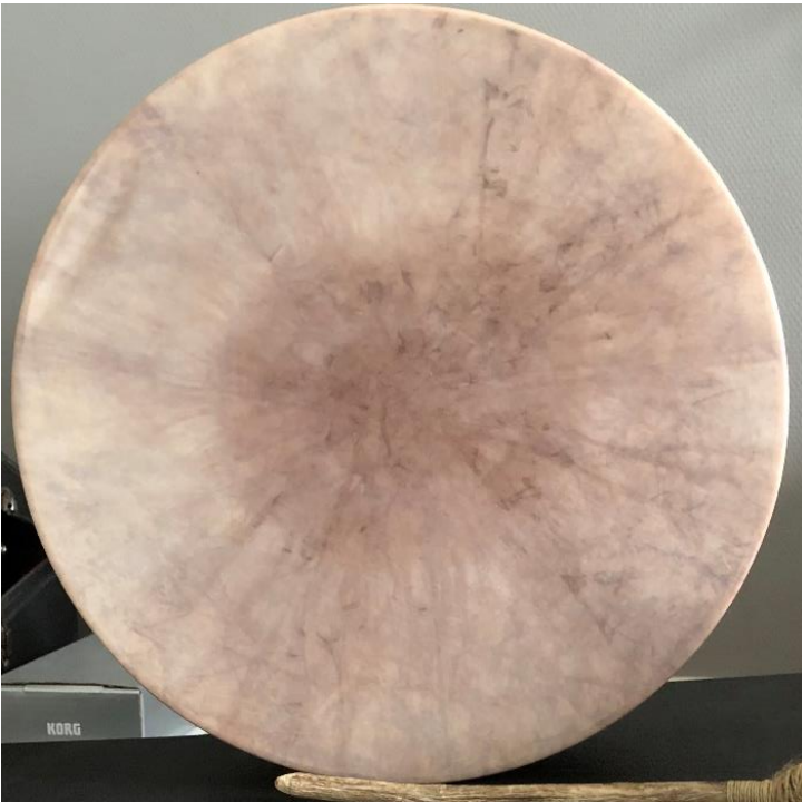
Kuva 4. Rummunrakennuskurssilla rakennettu rumpu edestä kuvattuna.

Toinen aineistosta esiin noussut tapa koristella rumpukalvo on maalaamalla siihen kuvioita. Kuviot eivät tuo mieleen vanhoja shamaanirumpuja, vaan ne ovat aivan eri tyyliisiä. Myös kuvioiden tulkinta eroaa vanhojen rumpujen kuvioiden tarkastelusta: kuten Risto Pulkkinen (2018, 61) toteaa, yhtäkään käyttäjien itsensä antamaa luotettavaa kuvausta vanhoista rumpusymboleista ei ole säilynyt. Tulkinta on siis jäänyt aina ulkokohtaiseksi (Pulkkinen 2018, 60). Tässä tapauksessa minun ei ole tarvinnut esittää omia ulkokohtaisia tulkintoja, koska olen voinut kysyä merkityksistä käyttäjiltä itseltään.