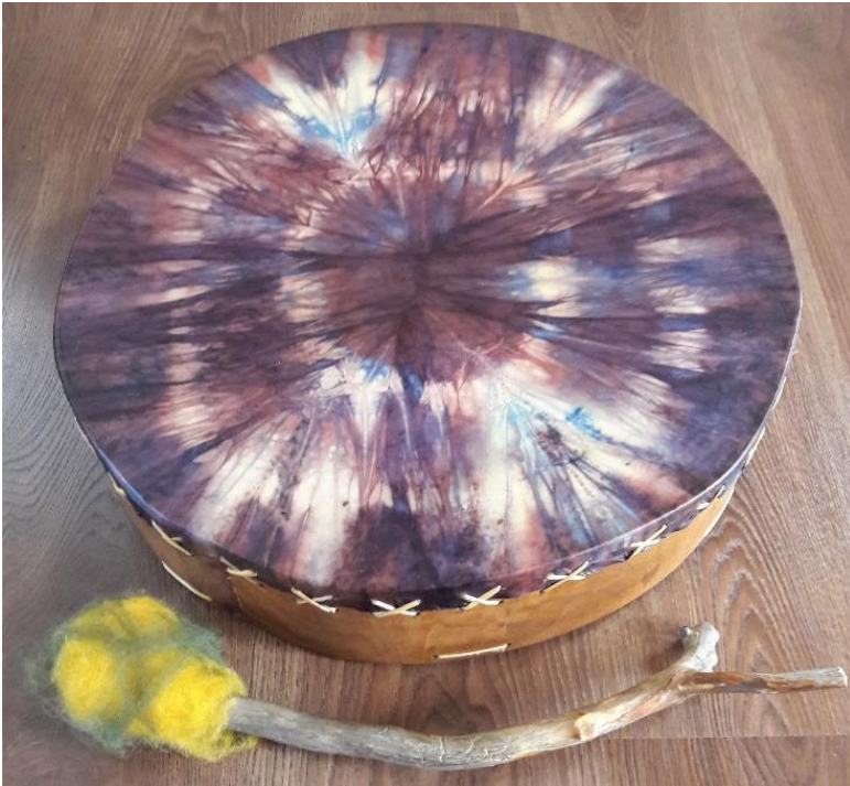
Kuva 3. Solmuvärjätty rumpu.

” --mut sit tääl on jotain tällasia eläinhahmoja mitä mä en välttämättä kokis mitenkään hirveen läheisiks tai tärkeiks mutta silti näin ne tässä. Siinäki eri ihmiset on nähny erilaisia asioita” H3, lit. s. 5.