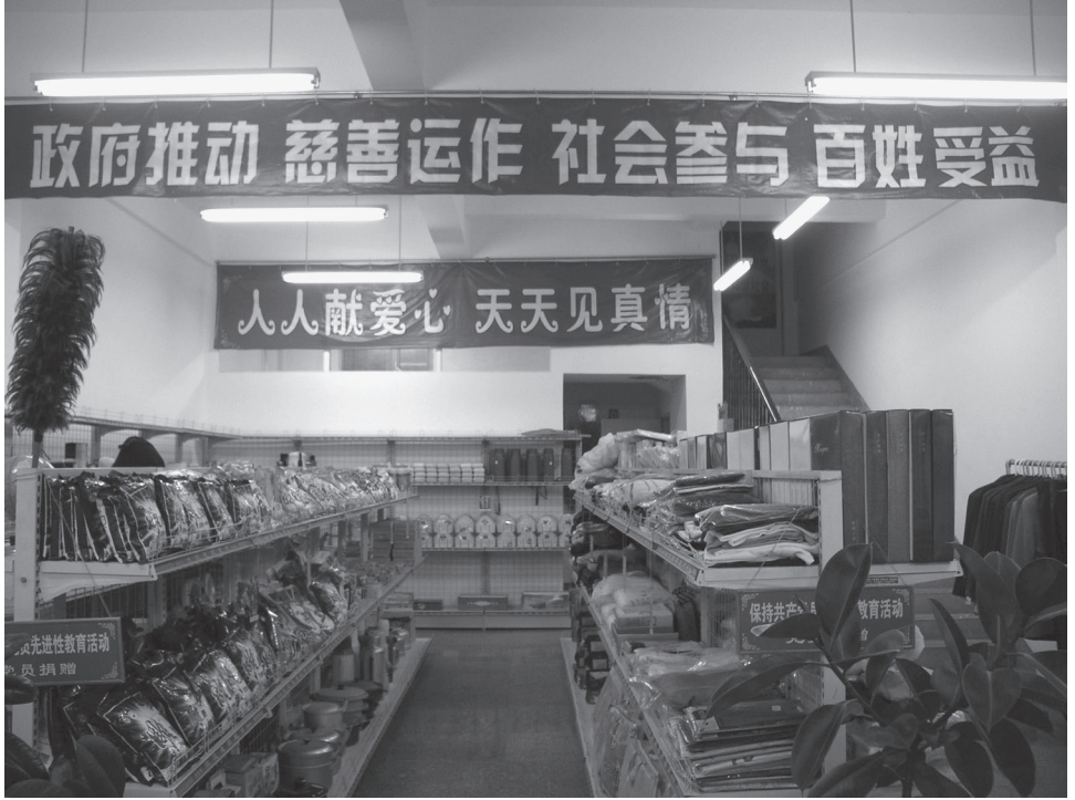
Kuva 16. ”Hyväntekeväisyyssupermarket”.

Köyhät asiakkaat saavat ostaa täältä tuotteita halvemmalla, ja voitot menevät vaikeuksissa olevien perheiden auttamiseen.