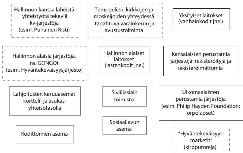
Kuvio 6. Sosiaalipalvelujen toimijoita Tianjinissa.