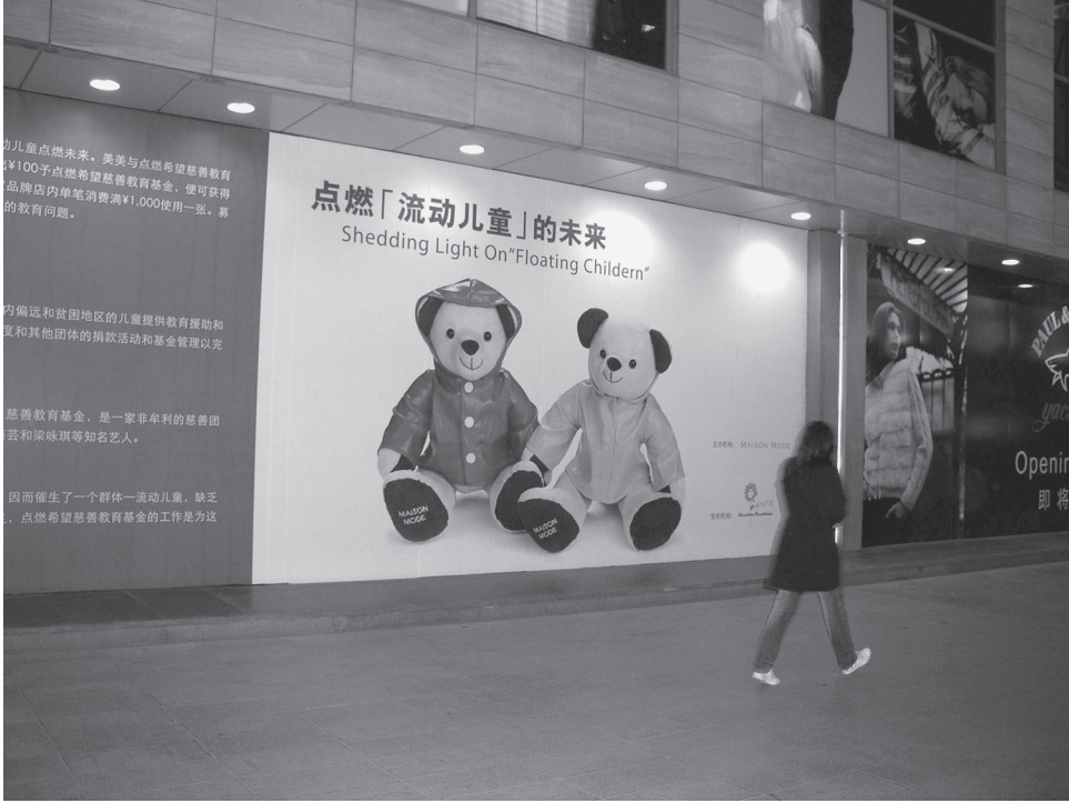
Kuva 14. Kauppakeskuksen hyväntekeväisyyskampanjan mainos. Kampanjan aikana osa myyntituotosta meni siirtotyöläisten lasten auttamiseen.

muuri ja saada kiinalaiset avustamaan oman sukulais- ja tuttavapiirin lisäksi myös tuntemattomia ja miten rakentaa lahjoittajien luottamus uudenlaista järjestötyyppiä kohtaan. Ensimmäinen ongelma ratkesi luomalla konkreettiset siteet lahjoittajan ja avustusta saavan koululaisen välille, jolloin avunsaaja voitiin mieltää oman perhepiirin jäseneksi. Järjestölle saatiin luoduksi luotettava imago, kun