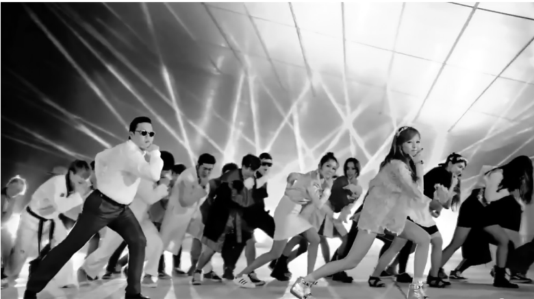
Kuva 2c. Lopun miettivä tanssiasento. Minkä genren mukaan tanssisimme? ”Gangnam Stylen” tarttuvan K-popin vai LMFAO:n ”Party Rock Anthem” -kappaleen hardcore housen/teknon tahtiin?