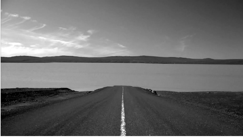
Kuva 3c. Tie häviää Háslón-rekoaltaaseen Kárahnjúkarin vesivoimala-alueella.