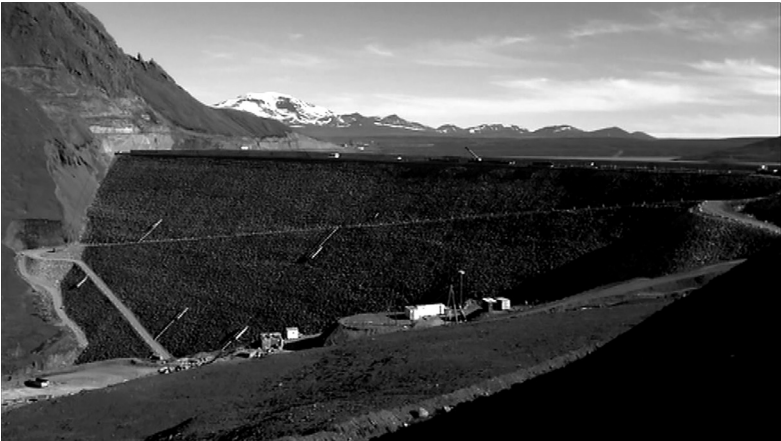
Kuva 3d. Uusi Kárahnjúkastifflan pato Kárahnjúkarin vesivoimalan alueella.