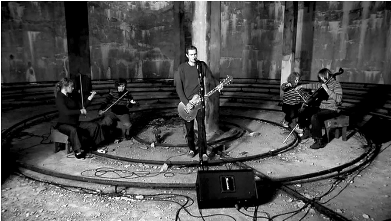
Kuva 3b. Sigur Rós esittämässä kappaletta ”Vaka” akustisesti Kárahnnjúkar-vesivoimala-projektin läheisyydessä. Projekti on lajissaan laajimpia koko Euroopassa.