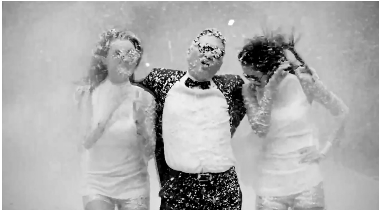
Kuva 2a. Tuulikone-parodia pop-esityksessä. Alkuperäisvideossa kuvallisesti, Gangnam Style without Music -videossa myös äänellisesti.

Genrejen vastakkainasettelu (tai genren vaihtaminen) on niin ikään tehokas keino muuntaa alkuperäisen videon merkityksiä. Alkuperäisen korealaisen tanssikappaleen pompahtelevat elektro-pop-äänit on muutettu videon viimeisissä ryhmätanssikohtauksissa voimakkaammiksi säilyttämällä videoon LMFAO-yhtyeen ”Party Rock Anthem” -kappaleen jyskyttävä rytmi ja vähemmän tarttuva kertosaakeistö (kuva 2c). Molempia kappaleita luonnehtii samankaltainen rytmi, mutta jälkimmäisen viskeraalinen voimakkuus ja alakulttuuriset konnotaatiot assosioituvat luontevimmin urbaaniin tanssilattaiympäristöön toisin kuin ”Gangnam Style”, jonka fyysinen huumori ja kepeä asenne sopivat paremmin kybersfääriin ohikiitäviin ja paikattomiin aika-tiloihin.