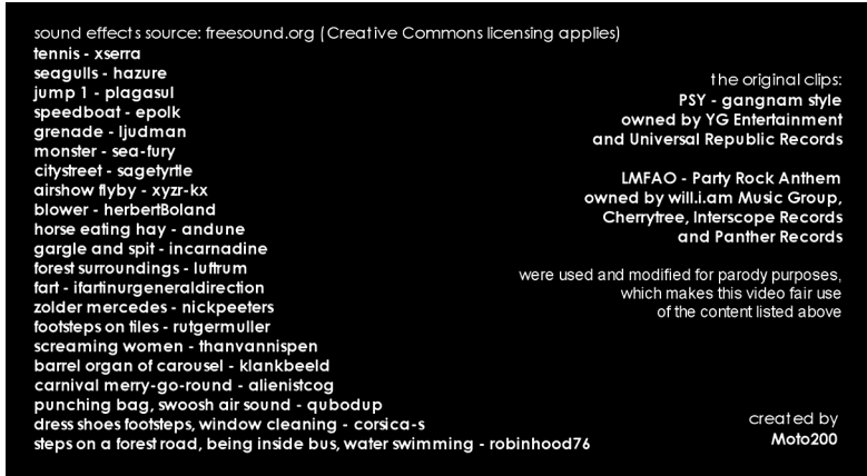
Kuva 1. Gangnam Style without Music . Lista ääniefektien lähteistä sekä irtisanoutumisen tekijänoikeuksista. Uudelleenäänitys Mikolaj Gackowski (2012). Alkuperäinen video Psy, ohj. Cho Soo-hyun (2012).

laj Gackowskin Music videos without music: GANGNAM STYLE , joka on yksi lukuisista Youtubesta löytyvistä Psyn ”Gangnam style” -kappaletta hyödyntävistä videoista (ks. Gackowski 2012). Hyödyntämällä alkuperäisen videon kuvaraitaa, kappaleen a cappella -miksausta sekä lisensioimattomia ääniefektejä (kuva 1) Gackowski on koostanut videon ääniraidasta runsaasti leikillisyyttä ja ironista liioittelua sisältävän foley-tulkinnan.