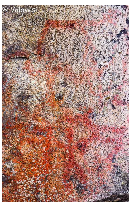
Kuva 2b: Hahlavuori.