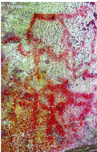
Kuva 2a: DStretch -käsittely Valovesi.

Palaan Hahlavuorelle useita kertoja eri vuodenaikoina. Talvella löydän sukeltavan hahmon, joka koskettaa jalallaan tanssijaa - se tuntuu katoavan kesäisin. Ihmistä muistuttavalla hahmolla on ihmisen vartalo, mutta eläimen pää, ja se seisoo kalliossa olevan halkeaman yläpuolella. Hahmon oikealla puolen on pienestä kallion kohoumasta muodostunut, poreiden tiiviisti rajaama ympyrä. Maalaja on pitänyt ympyrää tärkeänä, koska on maalannut sen esiin. Ympyrä sijoittuu hahmon vasempaan käteen, ja tuo mieleen rummun. Oikea käsi, tai ehkä ennemminkin kypälä, on nostettu ylös kuin lyömäasentoon. Ympyrän sisällä näkyvät kallion poreista muodostuvat kasvot: silmät ja nenä tai ehkä nokka. Ympyrän oikealla puolen on hirvi, jonka etujalka koskettaa sitä.