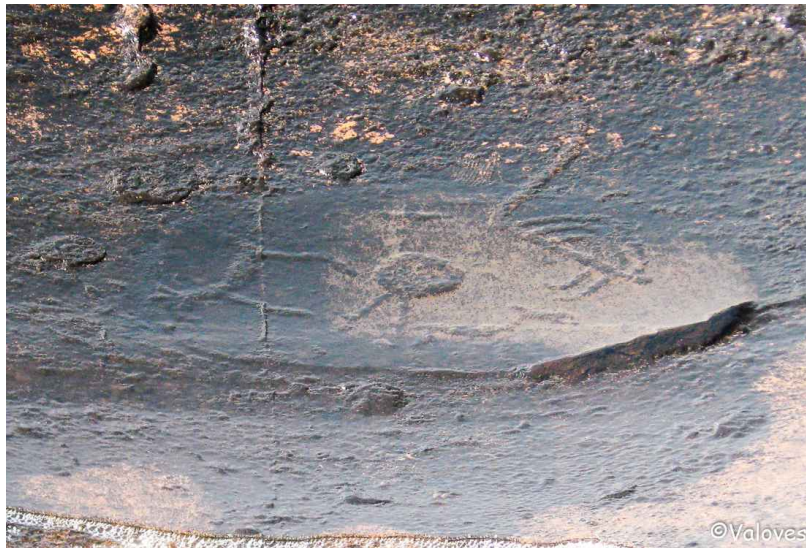
Kuva 3: Maailman synty Gurin saarella, Äänisellä.

Loveen lankeavaa noitaa on oikeastaan vaikea kuvata Hahlavuoren maalauksia paremmin. Hahlavuoren rummuttava noita ei selitä ainoastaan yhtä kuvaa, vaan myös sen ympärillä, tosiansa koskettavat kuvat. Se liittyy ne noidan rooliin välittäjänä mm. ihmisen ja hirven tai peuran, tämän ja tuonpuoleisen sekä ihmisen ja maailman synnyn välillä. Nämä ovat olleet noidan keskeisiä tehtäviä. Tulkintaa tukee maalauskallion erinomainen rummutuksen ja erikoinen laulun jälkikaiunta. Laulaminen, tanssiminen ja rummutus ovat olleet noitien keskeisiä tapoja vajota transsiin, joka on sekä saamelaisessa että suomalaisessa perinteessä ymmärretty juuri loveen lankeamisena. Myös paikan luonne tukee tulkintaa. Hahlavuori on vain yhdelle tai muutamalle ihmiselle kerrallaan, erityistä tarkoitusta varten sopiva paikka - ehkäpä juuri noidille ja noitien initiaatioon tarkoitettu?