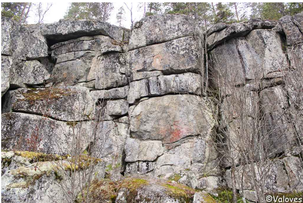
Kuva 1: Hahlavuori.

Maalauskaaliosta erottuu hieman pääkallomainen, vasemmalle katsova kasvoprofiili, jonka ohimolla maalaukset ovat (kuva 1). Kallion koloista muodostuu sille kaksi silmää ja kallion halkeamista leveästi naurava suu, jonka hampaat näkyvät. Yläpuolella on toinen hymyilevä profiili. Kallion pinta on rikas halkeamista ja koloista, ja siitä voi hahmottaa useita muitakin kivikasvoja ja -kuonoja. Seitojen henkien sanotaan ilmentäneen itseään kallion muodoissa. Sen perusteella täällä niitä asuu koko joukko.