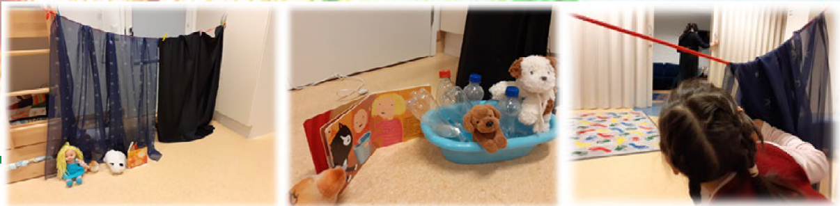
Vauvatetteria Lapsosen leikit -teoksen ympärillä.