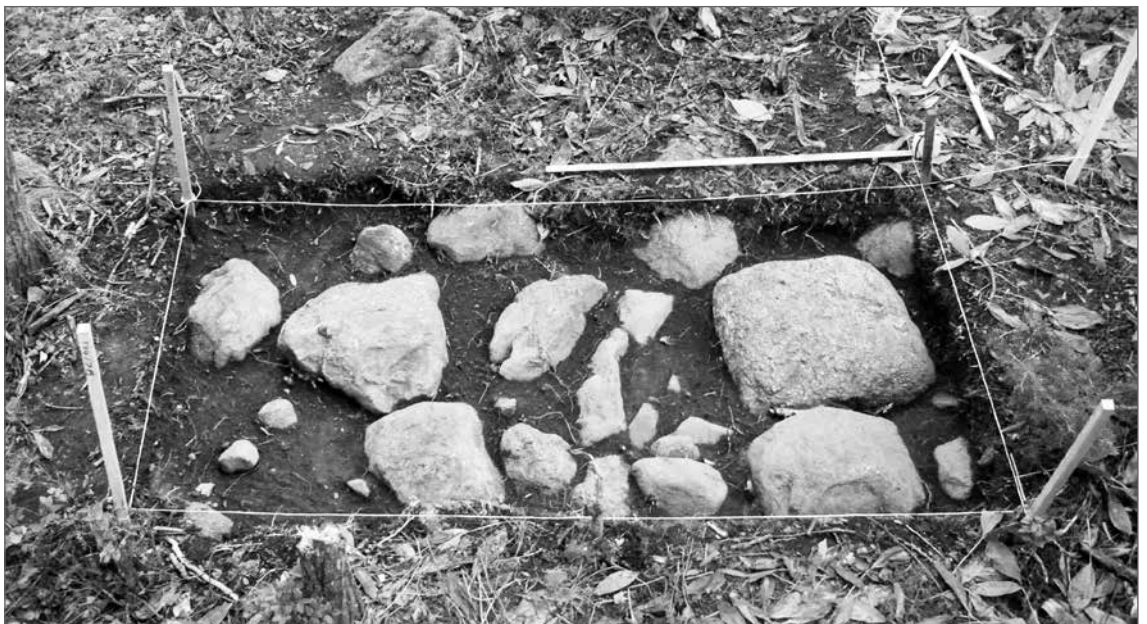
Ristimäen kalmistoa rajaavan aidan pohjakiveystä

R istimäen läpi kulkevan tien eteläpuolelta on tähän mennessä kartoitettu kolmisenkymmentä soikeaa maastopainannetta. Painanteiden todellinen lukumäärä lienee tätä jonkin verran suurempi, sillä vasta osa mäen pinnasta on pintavaahtu tarkasti. Tutkimusalueille ylänneet pitkänomaiset painanteet ovat kaivausten perusteella osoittautuneet ruumishautojen paikkaa ilmaiseviksi hautapainanteiksi.