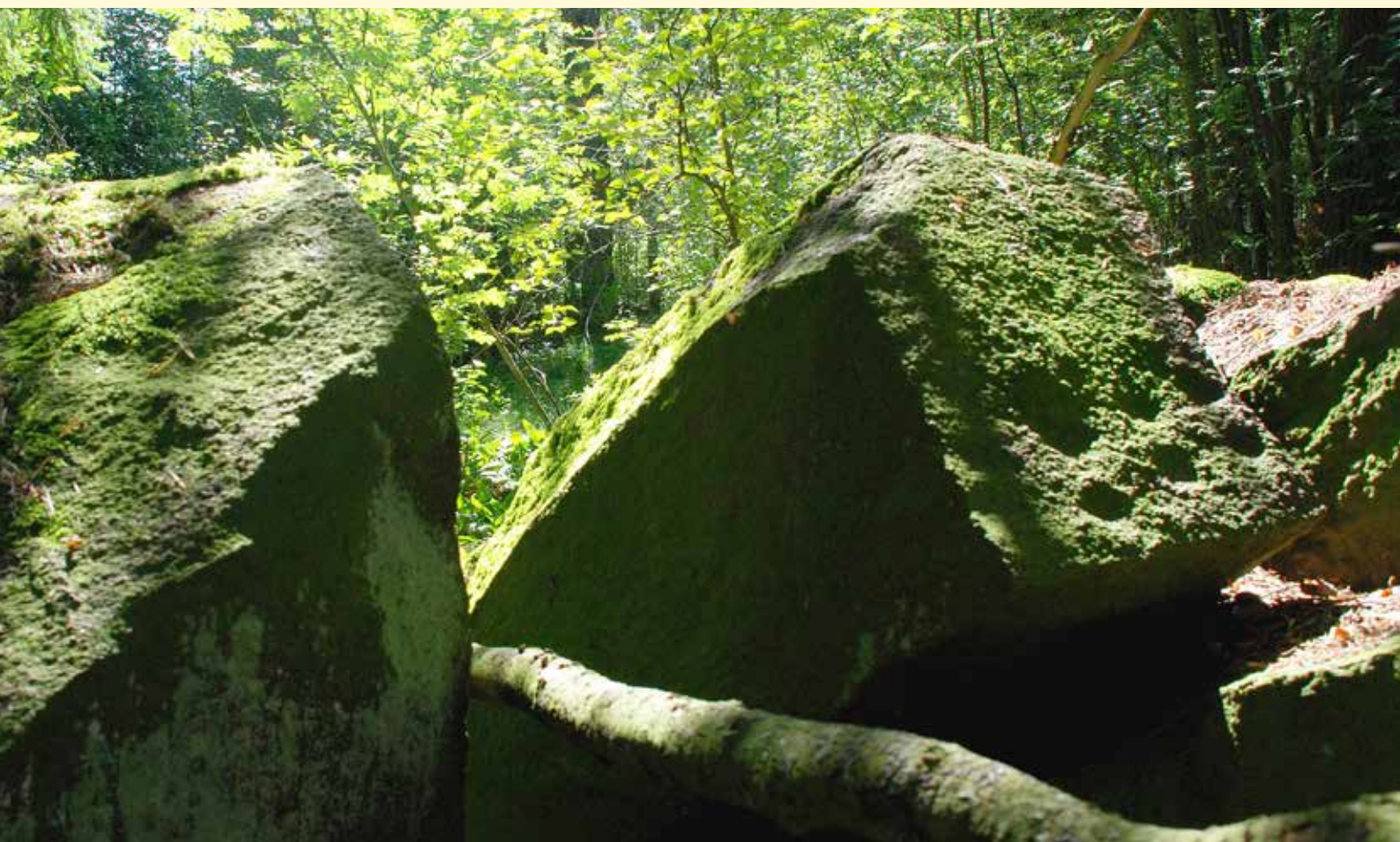
Särvän Ristimäeltä 2011 löytynyt uusi kuppikivi. Kupit on hakattu kiveen pareittain.

Ravattula on hyvä esimerkki alueesta, joka on arkeologisesti tunnettu lähes sadan vuoden ajan, mutta josta silti pitkäjänteisen perustutkimuksen kautta löydetään koko ajan lisää uusia, eri periodeille ajoittuvia muinaisjäännöksiä. Vastaavia potentiaalisia, mutta toistaiseksi heikosti tutkittuja alueita löytyy pelkästään Lounais-Suomesta kymmenittäin. Vaikka tutkimukset Ravattulassa ovat tähän mennessä olleet varsin pienimuotoisia, on alueen esi- ja varhaishistorian kuvaa saatu vuosi vuodelta täydennettyä. Myös tutkijoiden kärsivällisyys on palkittu, sillä harvoin ilman kiireitä ja pelastuskaivausten uhkaa on päästy käsiksi näin ainutlaatuisen ja hyvin säilyneeseen, tutkimusten kautta tiedoiltaan jatkossakin karttuvaan kokonaisuuteen.