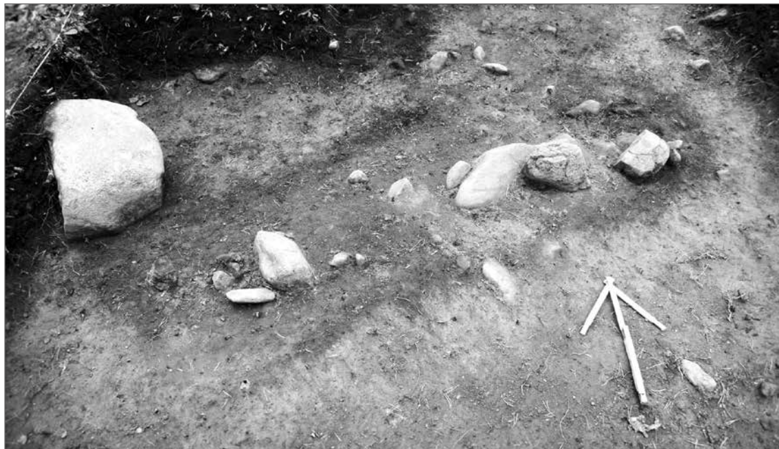
Ristimäen ruumishaudat erottuvat maassa tummempana läikkänä. Kuvassa vuonna 2010 tutkittu hauta.

rään kivikaudelle ajoitettu asuinpaikka. Kohde lienee ainakin osittain jäänyt Ravattulaan vievän uudehkon kylätien alle. Kvartsia on löytynyt myös pellolta Vanhan Ravattulantien eteläpuolelta, mutta tämä on muiden löytöjen puuttuessa vaikeammin liitettävissä mihinkään tiettyyn esihistorian periodiin.