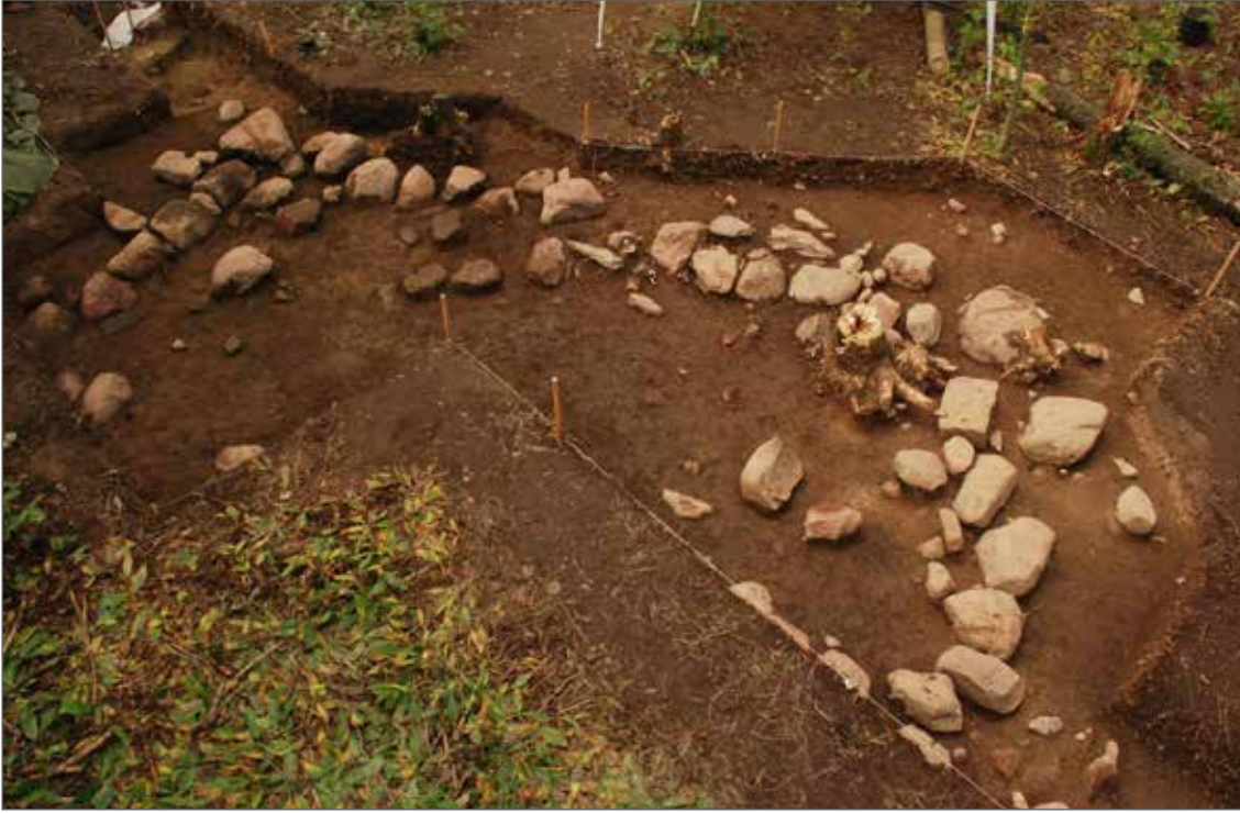
Ristimäen keskiosista löytyneen rakennuksen kivijalan lounaispäätty esiin kaivettuna.

Ristimäen yleisin löytöaineisto on nimittäin palanut savi sen eri muodoissa. Mäeltä on tähän mennessä talletettu yli 10000 palaneen saven, savitiiviteen tai kuonaantuneen saven palaa. Savea löytyykin kaikkialta, jokaisen