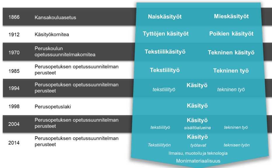
Kuvio 1. Käsityön oppiaineen kehittyminen vuosina 1866–2014 (mukaillen Lindfors, 2015; Lepistö & Lindfors, 2015)

opetussuunnitelman perusteissa oppiaineen nimenä perusopetuslain mukaisesti olikin käsityö (Opetushallitus, 2004). Vuoden 2004 perusopetuksen opetussuunnitelman perusteissa tekninen työ ja tekstiilityö määriteltiin käsityön sisältöalueiksi, jolloin ajatuksena oli tutustuttaa oppilaat erilaisiin käsityön materiaaleihin ja valmistusmenetelmiin. Oppilailla oli vuosiluokkien 1–4 yhteisen käsityön jälkeen mahdollisuus valita käsityön sisällöistä vuosiluokille 5–9 joko tekstiilityö tai tekninen työ oman kiinnostuksensa mukaisesti (Opetushallitus, 2004).