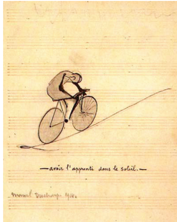
Kuva 2. Marcel Duchamp, Avoir l'Apprenti dans le soleil , 1914. Muste ja lyijykynä nuottipaperille. Philadelphia Museum of Art. https://www.wikiart.org/en/marcel-duchamp/to-have-the-apprentice-in-the-sun-1914

Kandinskyn ja Mauclairin tarjoamissa esimerkeissä taas moniaistisuus ja sen yhteys elämellisyyteen alkaa tyhjentyä gnoseosentrisiin, tietoisuuskeskeisiin väittämiin. Kandinskyn esimerkki hahmottaa transsendentaalin pinnan, jossa aistikokemukset kyllä sulautuvat ja saattavat olla yhteistä alkuperää, mutta jossa ne myös menettävät