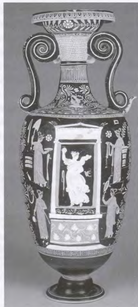
Punakuviainen apulialainen loutroforos, jossa mahdollisesti kuvattuna Elpis . Getty Mus. 86.AE.680 B,

Tietenkin on myös mahdollista ja ehkä myös hyödyllistä kyseenalaistaa oliko toivo (kreikan elpis , latinan