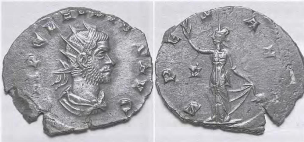
Claudius II Gothicuksen raha (RIC V.1 191), vasemmalla keisari (hallitsi 268-270) ja oikealla puolella Spes-jumalatar.