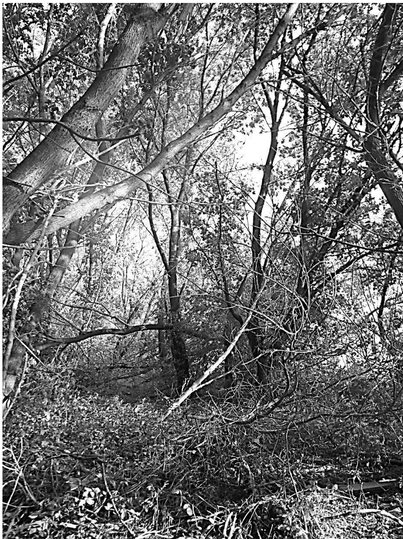
Рис. 1. Монодоминантное сообщество клена ясенелистного на берегу р. Кама.

На пойменных лугах A. negundo чаще обнаруживается в составе древесных и кустарниковых группировок (совместно с разными видами ив, тополем черным, вязом гладким), однако отмечен и в луговых сообществах. Именно в пойменных участках ООПТ обильно представлены плодоносящие особи в окружении потомков разного возраста.